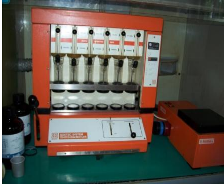
Slika 13. Ekstrakcija masti po Soxletu

sirovih masti povećanjuje sadržaj lipida u krmivima u kojima se oni nalaze u netopivom obliku kao što su fosfolipidi i lipoproteini, soli masnih kiselina ili sapuni.