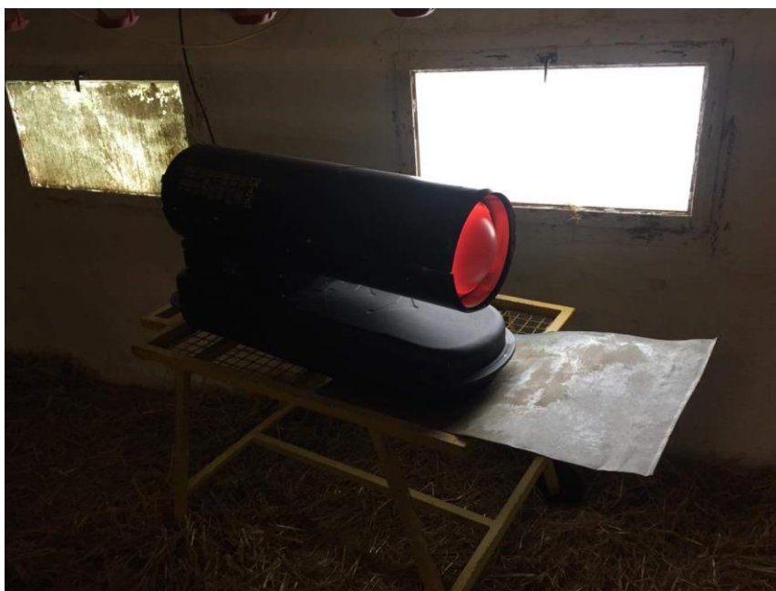
Slika 4. Master

U objekt se postave 4 grijaća tijela (masteri) koji rade na lož ulje (Slika 4.). Rade na principu upuhivanja toplog zraka u peradnjak. U svakom kutu nalazi se po jedan master, a u iznimnim slučajevima još se uključe i 2 plinska grijača. Na 25 metara od svakog grijaćeg tijela nalazi se jedan manji recirkulacijski ventilator kapaciteta 6400 m 3 /h kojem je svrha miješanje toplog zagrijanog zraka koji je neposredno izašao iz mastera s malo hladnijim zrakom koji se nalazi u objektu. Radom ovih ventilatora omogućeno je ravnomjerno raspoređivanje i izjednačavanje topline po cijelom objektu, a to je veoma bitno iz razloga što brojerska proizvodnja ne podnosi odstupanja ni u čemu, pa tako ni u manjoj temperaturi. Ovo se manifestira tako da na mjestima gdje nije idealna temperatura brojleri se okupljaju jer im je hladno, odnosno ne konzumiraju hranu i vodu te uslijed toga ne rastu. Kao krajnja opasnost prijeti i uginuće.