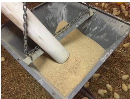
Slika 6. Smjesa u usipniku za hranu na farmi