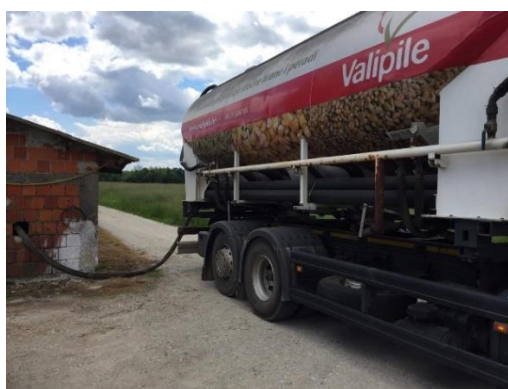
Slika 7. Prihvat smjese u silos