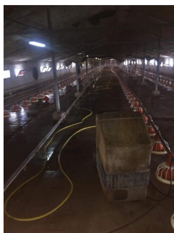
Slika 9. Pranje farme