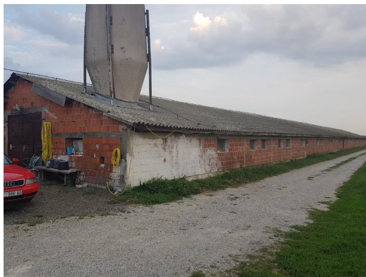
Slika 1. Peradnjak