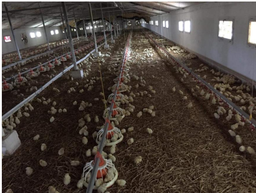
Slika 2. Jednodnevni pilići

Sustav hranjenja Augermatic s hranilicama Big Pan 330 sastoji se od usipnika za hranu, cijevi sa spiralom za prijenos hrane, pogona hrane sa senzorom, ovjesnog sustava s vitlom, žice protiv sjedanja peradi na liniju hranjenja i hranilica Big Pan 330. Hranilice Big Pan 330 slobodno se okreću oko cijevi. Dno hranilice izgrađeno u obliku slova "V" ulazi u stelju, što osigurava lagan pristup do hrane jednodnevnim pilićima. Glatki rub hranilice napravljen je na način da onemogući oštećenja prsa tijekom tova. Montaža hranilice vrši se bez vijaka (snap-on sustav), što omogućava laganu zamjenu hranilice i olakšano pranje. Na Slici 2 prikazane su hranilice i pojidbeni sustav na OPG Fureš.