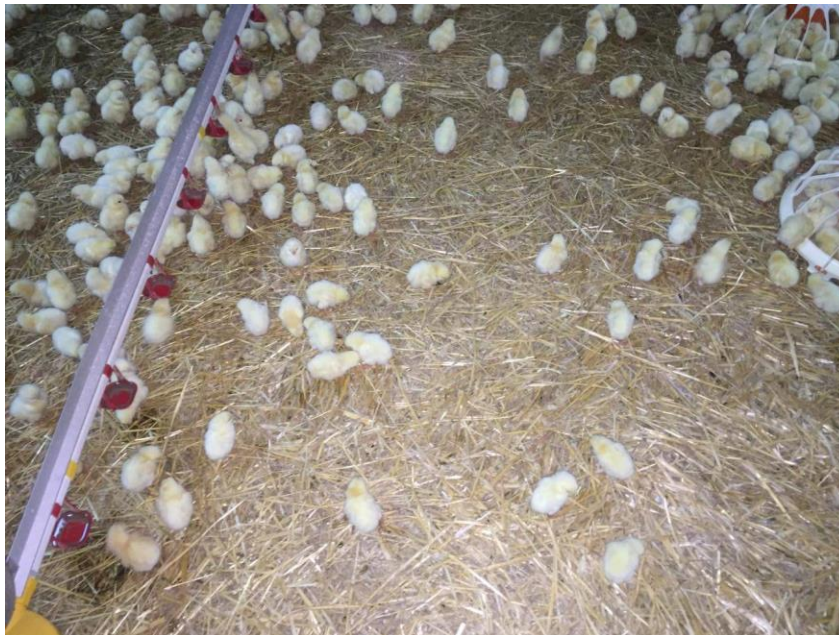
Slika 5. Jednodnevni pilići

U ovom turnusu zaprimljeno je 14 000 jednodnevnih pilića hibrida Ross, prosječne težine 40 grama po piletu.