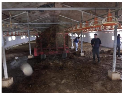
Slika 8. Čišćenje farme

Čišćenje objekta provodi se tako da 6 ljudi utovaruje stajnjak u prikolicu za stajnjak i izvozi na polja (Slika 8). U isto vrijeme vrši se struganje i metenje zaostalih sitnih čestica i prašine, što uglavnom radi dvoje ljudi. Nakon što se peradnjak očisti, slijedi pranje objekta visokotlačnim peračem koji radi na principu visokog pritiska te odstranjuje sve nečistoće i prljavštine. Objekt se u potpunosti pere bez ikakvih iznimaka (Slika 9). Za ovaj posao potrebno je dvoje do troje ljudi i to je izrazito neugodan posao. Objekti se detaljno peru toplom vodom temperature od 30 do 50°C. Nakon pranja objekt se suši 2 do 3 dana, a zatim slijedi dezinfekcija objekta sredstvima protiv virusa (natrijeva lužina 2%) i sredstvima protiv bakterija (Virkon i Izosan). Kod upotrebe ovih sredstava potrebno je koristiti zaštitnu opremu (rukavice, gumene čizme, zaštitno odijelo, naočale).