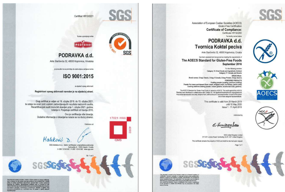
Slika 5. ISO 9001:2015 i AOECs (Gluten free) certifikat

Svaka suvremena prehrambena industrija ima certifikat, odnosno dokument kojeg izdaje ovlaštena tvrtka koja dokazuje usklađenost s određenim međunarodno priznatim normama, ISO 9001 (sustavi upravljanja kvalitetom), HACCP 13 principima (sustav samokontrole), zahtjevi velikih trgovačkih lanaca - IFS (International Food Standard) i BRC ((British Retail Consortium), certifikati Halal i Kosher certifikati (potvrđuju da je proizvod u skladu sa islamskim ili židovskim zakonima), certifikati , gluten free certifikati (garancija da proizvod ne sadrži gluten), vegan certifikati (oznaka za proizvode koji ne sadrži umjetne sastojke ni sirovine životinjskog porijekla), certifikati održivog razvoja, RSPO certifikat (Roundtable on Sustainable Palm Oil) standard za održivu proizvodnju palminog ulja.