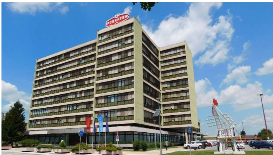
Slika 2. Podravka d.d.

Razvoj novih prehrambenih proizvoda je vrlo skup, zahtijeva puno vremena i naravno nosi određeni rizik, ali treba znati kako inventivnost pojedinih industrija se izražava u postojanju jasne strategije i budućim investicijama u razvoj novih proizvoda.