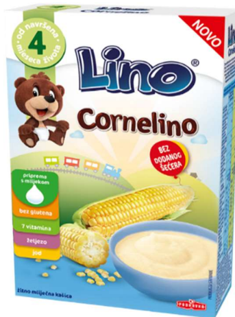
Slika 6. Prikaz dizajna, ambalaže i lentice na primjeru Lino Cornelino