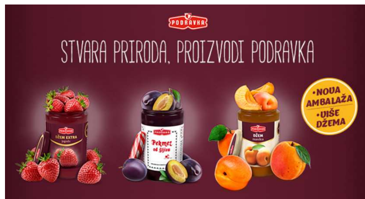
Slika 1. Voćni namazi Podravke

Za prehrambenu industriju novi proizvod je najmanja promjena na postojećem proizvodu zbog toga što zahtjeva odvojeno vođenje procesa, kao i kod potpuno novog proizvoda. Iako, koncenzus se postiže internim propisima u tvrtki koja definira što se smatra novim proizvodom. Primjerice, tvrtka Podravka ima status novog proizvoda tri godine, nakon čega se realizacija proizvoda prati u okviru postojećih proizvoda. Pod time se misli, da se proizvod ukida iz asortimana ukoliko u to vrijeme ne postigne definiranu minimalnu godišnju prodaju i ciljanu profitabilnost. Na nacionalnoj razini, novi proizvodi i inovacije potiču ekonomski rast, zatim povećavaju konkurentnost i izvozni potencijal gospodarstva, povećavaju zaposlenost stanovništva.