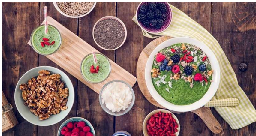
Slika 3. „Superhrana“