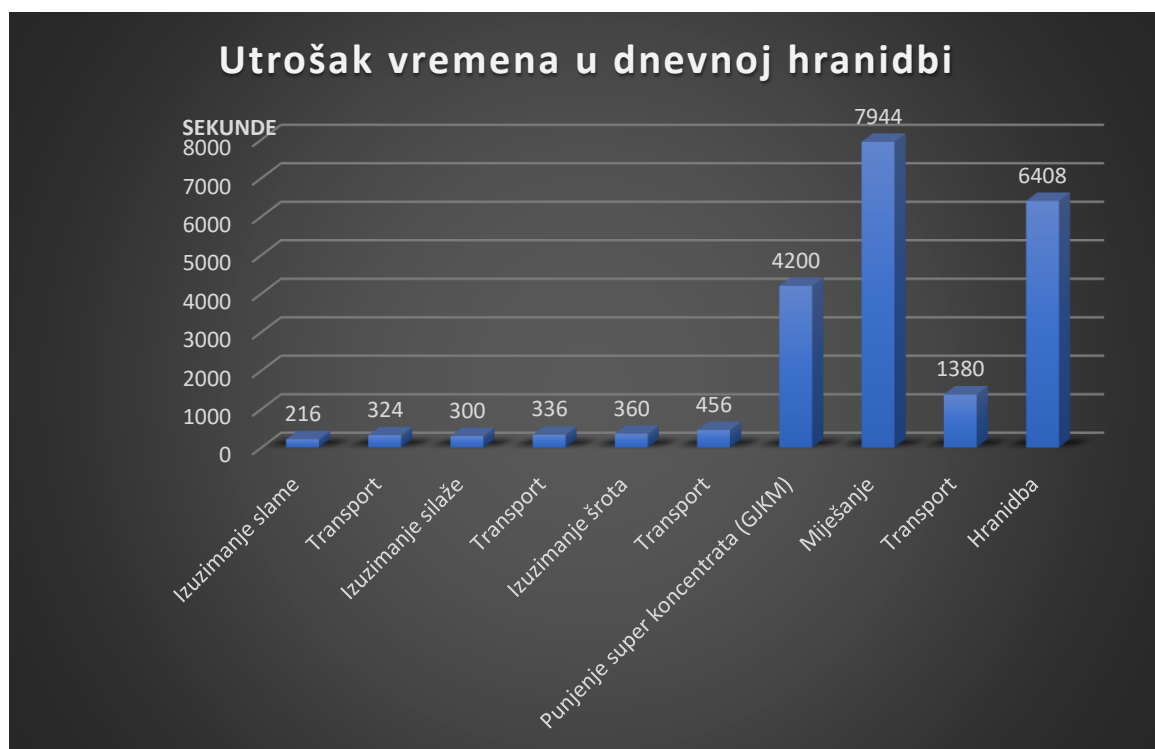
Grafikon 2. Utrošak vremena u procesu dnevne hranidbe