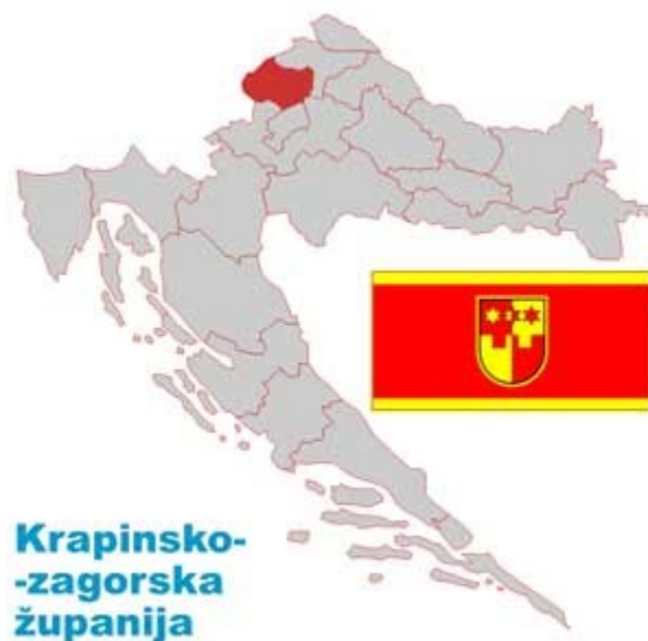
Slika 2. Krapinsko-zagorska županija - položaj na karti