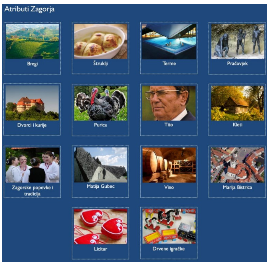
Slika 4. Osnovni atributi Zagorja