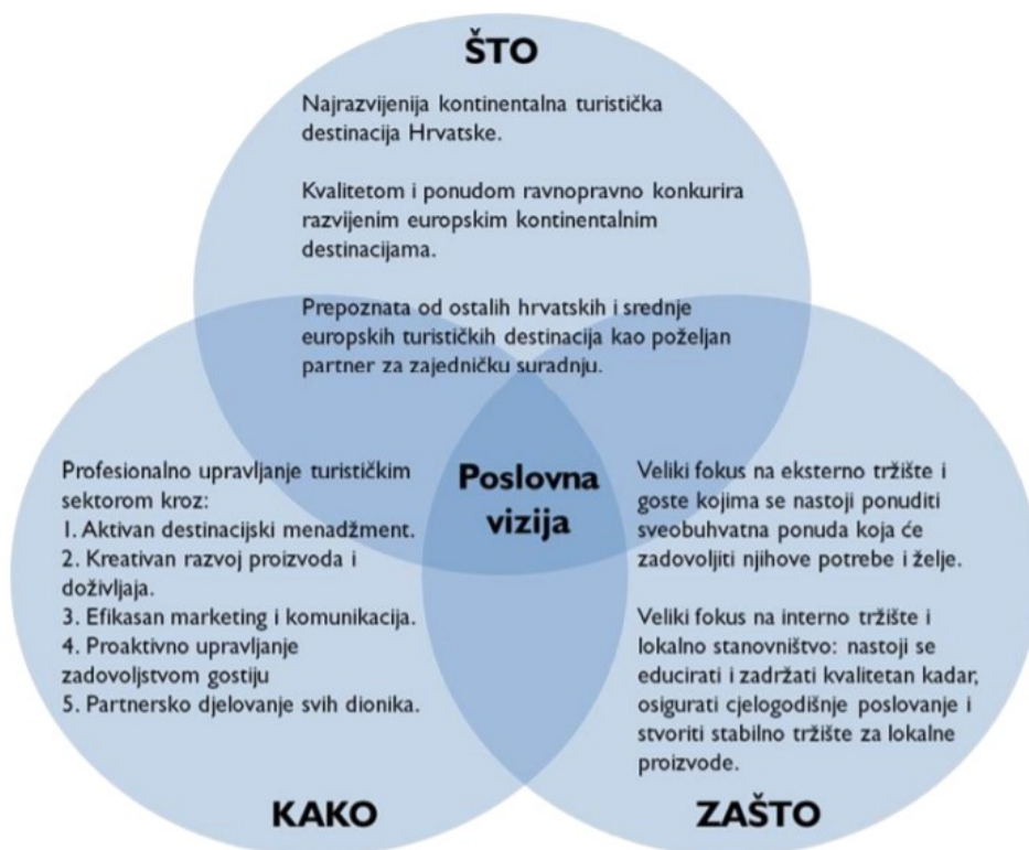
Grafikon 1. Poslovna vizija razvoja turizma Zagorja