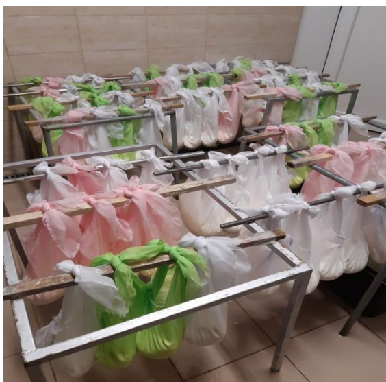
Slika 2. Cijedenje svježeg sira