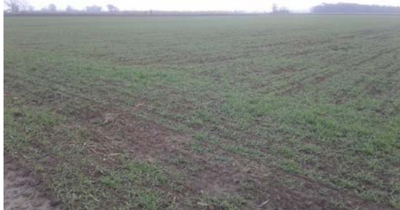
Slika 4. Hibridni ječam 15. 11. 2015.