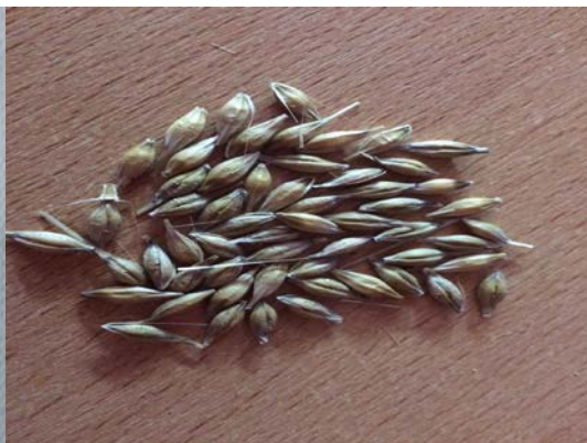
Slika 8. Zrno četverorednog ječma