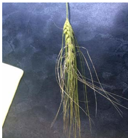
Slika 2..Oštećen klas od mraza, travanj 2016.