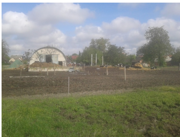
Slika 1. Staja i ispust

Od kultura najviše se sije kukuruz, ječam, talijanski ljulj, lucerna i stočni grašak u smjesi sa strnim žitaricama. Strukturu sjetve na oranicama prikazuje slijedeća tablica. Ljulj se na lošijim parcelama nakon prvog otkosa preorava i sije se kukuruz FAO grupe 500, a na boljim nakon drugog otkosa sije se kukuruz za silažu FAO grupe 300 do 400. Smjesa graška i pšenice se preorava nakon čega se sije sirak za silažu. U 2017. nakon žetve ječma i pšenoraži na dio površina se posijao usjev za zelenu gnojidbu, dok su ostale parcele obrađene plošnim kultivatorom (gruberom).