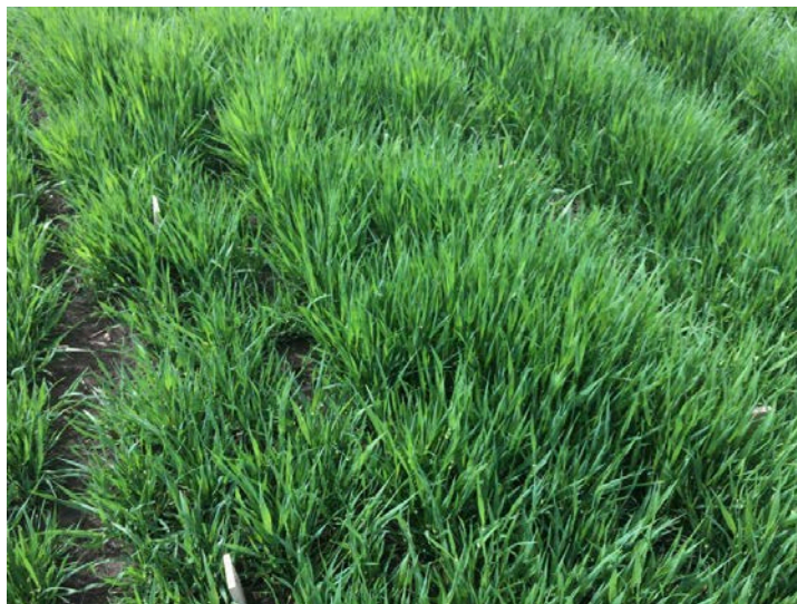
Slika 6. Ječam u fazi busanja, 6.12.2015.