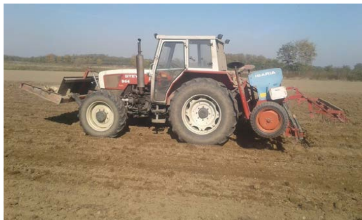
Slika 3. Sjetva ječma, 13.10.2016

Zaštita od korova provedena je u jesenskom periodu što je ekonomski najprihvatljivije. Herbicid Herbafleks je kontaktno – rezidualni herbicid koji svojim spektrom djelovanja pokriva sve korove te jednim prskanjem suzbija cijeli spektar jednogodišnjih travnih i širokolisnih korova. Amistar Extra dobro suzbija sivu i mrežastu pjegavost lista. Bio je primijenjen kada su bili dobri uvjeti za prskanje, što znači da nije bilo vjetera i prosječna temperatura je bila 10,3 °C. Ponovna primjena istog fungicida bila je nakon 3 tjedna, u dobrim vremenskim uvjetima i prosječnom temperaturom 12,2 °C.