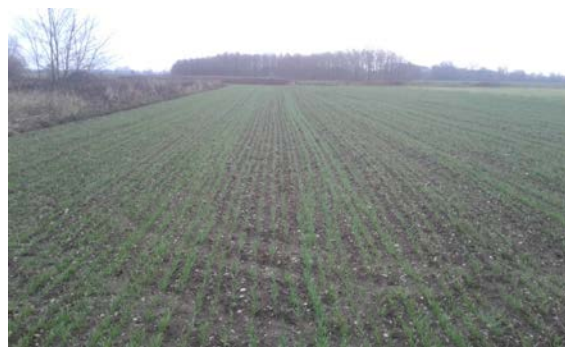
Slika 5. Hibridni ječam 8. 11. 2016.