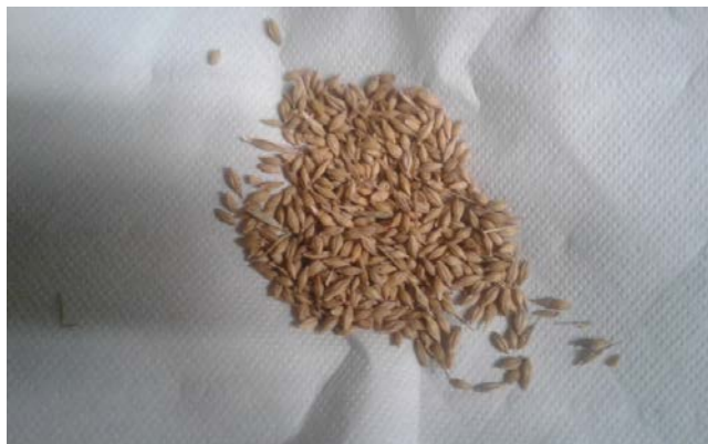
Slika 7. Zrno dvorednog ječma