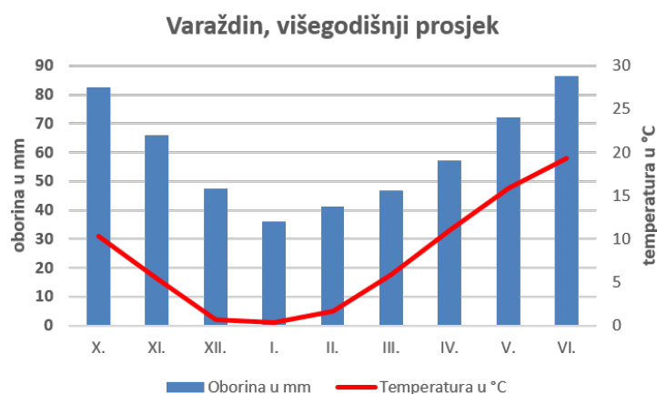
Grafikon 2. Hod temperature i oborine u vegetaciji ječma

Vremenske prilike u vegetaciji ječma 2016. - 2017. bile su nešto nepovoljnije i od prosjeka i od prethodne vegetacije. Sjetva je obavljena u optimalnom roku, a još u vrijeme sjetve palo je 86,4 mm oborine a tijekom studenog još 99,8 mm. Od prosinca pa sve do svibnja palo je manje oborine od višegodišnjeg prosjeka i relativno sušno razdoblje prekinuto je u svibnju. Ječam je dobro prezimio ali je bilo manjih oštećenja od izmrzavanja zbog dugog perioda niske temperature. Naime srednja mjesečna temperatura u prosincu i siječnja bila je niža od 0 °C. Kroz cijelo razdoblje zime bilo je malo oborine a značajnije oborine nisu pale ni u proljeće što je uvelike utjecalo na prinos ječma. Vremenske prilike u navedenim razdobljima prikazuju sljedeći grafikoni, a Slika 2. prikazuje oštećenje ječma od mraza u travnju 2016.