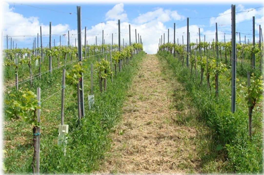
Slika 5. Proljetna obrada tla u vinogradima vinarije Bolfan Vinski Vrh

Agrotehničke mjere koje su se provodile u vinogradu u potpunosti su prilagođene ekološkom uzgoju vinove loze. Nakon berbe, u kasnu jesen provodi se podrivanje zbog poboljšanja vodozračnih odnosa jer se zbog mnoštva prohoda traktora i mehanizacije tlo zbija. To je posebno važno na dijelovima vinograda gdje su teža tla. U proljeće se koristi rotobrana za zatvaranje brazde, koja je važna za ulaganje mineralnog gnojiva u tlo. Ima ulogu smanjiti gubitak vode iz tla jer se prekida kapilarni uspon vode. Podrivanje, malčiranje i valjanje (slika 5) se provodi u svakom drugom redu prvenstveno zbog pravovremene mogućnosti provođenja agrotehničkih mjera i zaštite. U slučaju kiše i nepovoljnih vremenskih uvjeta nije moguće ući u redove u kojima su korišteni podrivači. Zbog toga se obrada uvijek vrši naizmjenično u svaki drugi red kako bi se uvijek moglo ući u vinograd s potrebnom mehanizacijom.