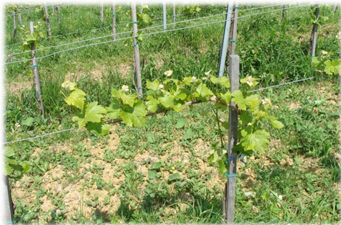
Slika 4. Jednokraki Guyot sustav uzgoja trsa u vinogradima u vinariji Bolfan Vinski Vrh

U pravilu se kod jednostrukog Guyot sustava jače razviju mladice oko glave i zadnje mladice na lucnju. Skraćivanjem lucnja želio se postići ravnomjerniji porast mladica.