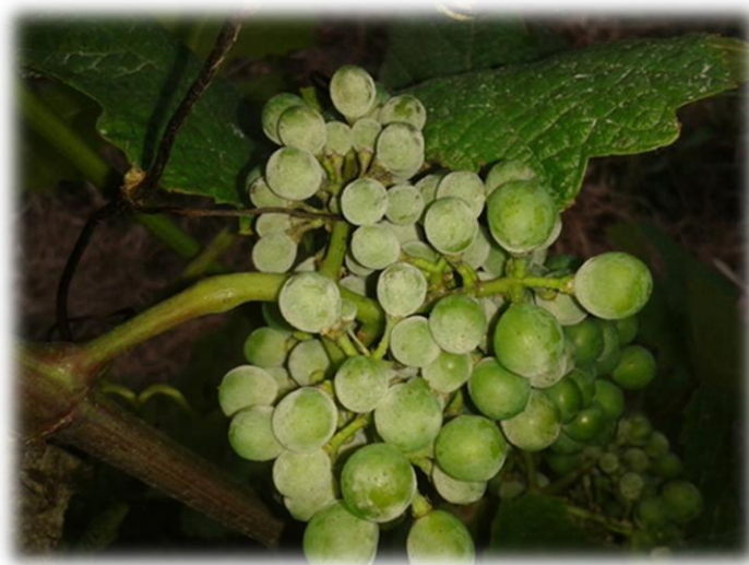
Slika 2: Pepelnica na grozdu vinove loze

Po Kišpatiću i Maceljskom (1991.) za prijenos i nije nužna kap vode već je dovoljna visoka vlažnost zraka i to preko 80% relativne vlažnosti. Micelij se u obliku prevlake širi po pokožici bobice te taj dio pokožice izumire. Bobica nastavlja dalje rasti a na odumrlim dijelovima dolazi do pucanja bobice (šaranje), sve do sjemenke, a kasnije i sušenja tog dijela što je karakterističan izgled za pepelnicu. Pri pogodnim temperaturama inkubacija traje 7-14 dana, a konidije kliju na temperaturi od 5 - 20 °C. Hifa najviše pogoduju temperature od 25 - 35 °C i tad se zaraza najbrže širi pa štete već kroz 3 - 6 dana mogu biti goleme ako se u međuvremenu ne koristi fungicid. Napad pepelnice koja u početku starta podmuklo i neprimjetno, a onda najednom bukne, može nanijeti štete u vinogradu (Slika 2) i više od 80% (Kišpatić i Maceljski, 1991). Pri kasnom napadu, kada bobice prestaju rasti, štete obično nisu velike (Cvjetković, 2010).