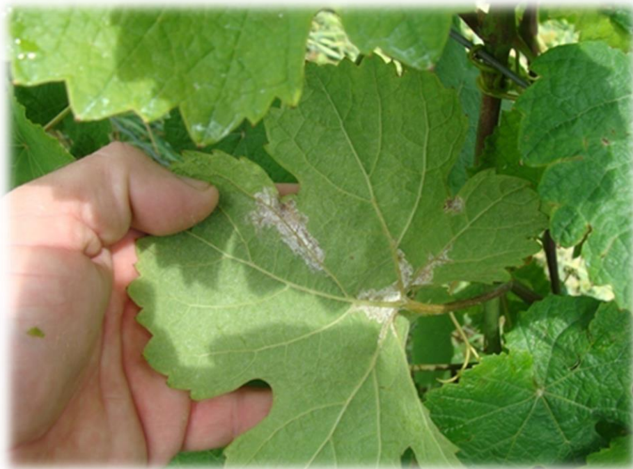
Slika 1. Plamenjača na listu vinove loze

Na mladim listovima nastaju nešto svjetlije zelene do žute zone, tzv. „uljne mrlje“, koje se postupno povećavaju i dosežu promjer 1 -3 cm (Slika 1). Ako je vrijeme vlažno, uskoro će se s donje strane lista na mjestu „uljnih mrlja“ pojaviti bijele prevlake (Maceljski i sur., 2006).