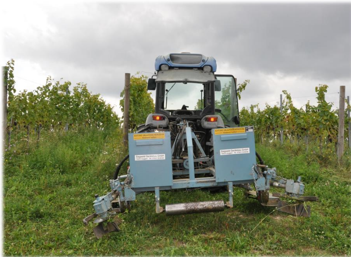
Slika 4. Malčiranje i valjanje trave u vinogradima vinarije Bolfan Vinski Vrh

U ožujku je za gnojidbu vinograda korišteno organsko dušično gnojivo Fertil supernova 12,5 čija osnovna karakteristika je sporo otpuštanje dušika (150 kg/ha).