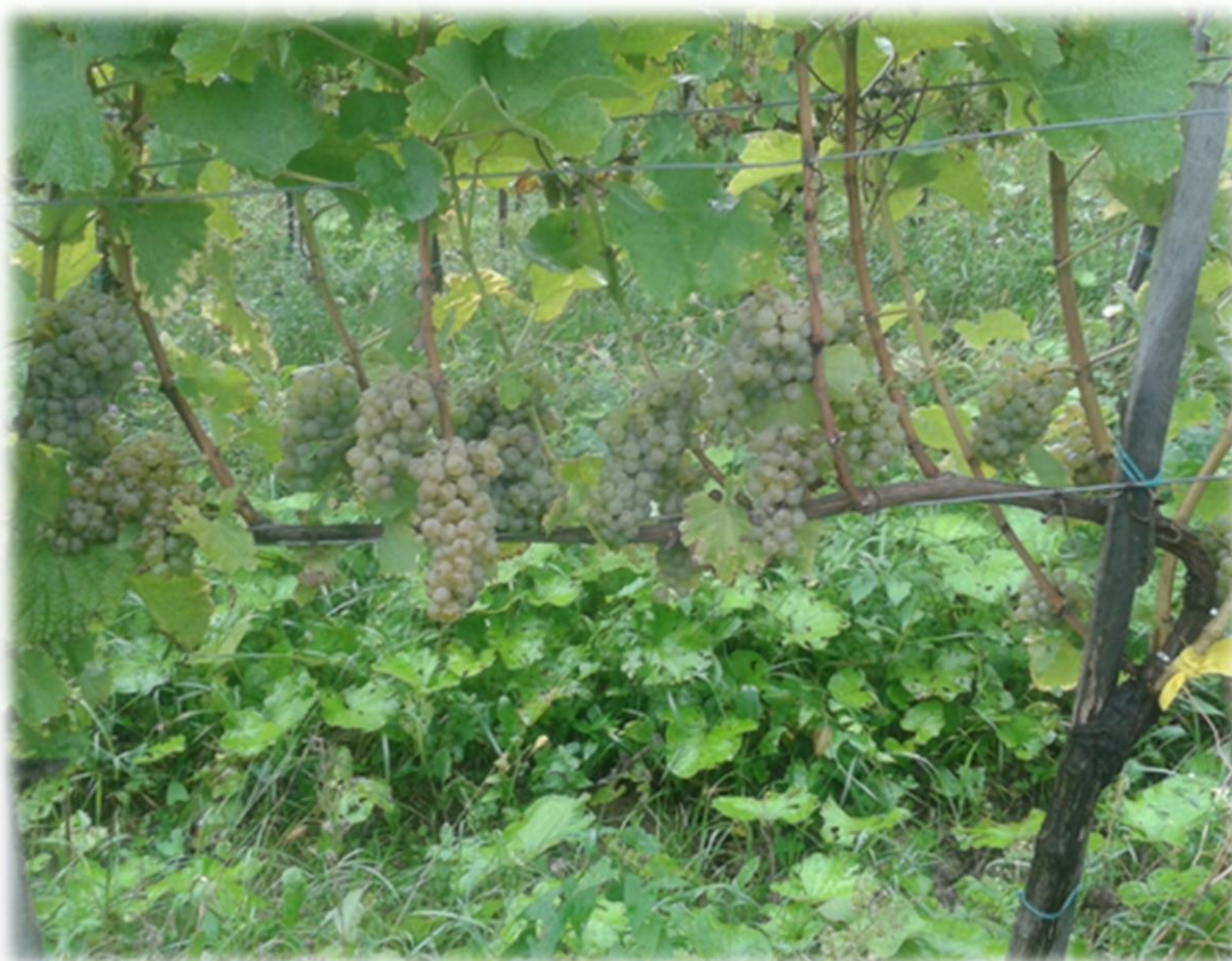
Slika 6. Urod sorte sauvignon bijeli u pokusu u vinogradima vinarije Bolfan Vinski Vrh

Rezultati u tablici 1 pokazuju da ukupan broj grozdova raste s brojem mladica pri čemu broj grozdova pri opterećenju trsa sa 6 mladica iznosi 210 (10,5 grozdova po trsu), pri opterećenju trsa sa 8 mladica ukupan broj grozdova je 259 (13 grozdova po trsu), a pri opterećenju 10 mladica on iznosi 279 grozdova (14 grozdova po trsu).