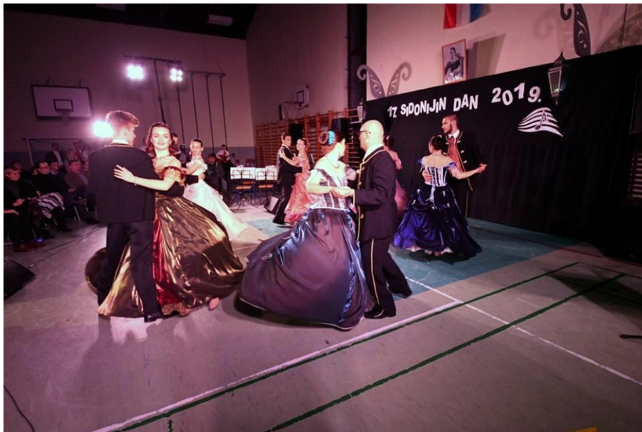
Slika 7. Manifestacija Sidonijin dan

Navedena manifestacija je od izuzetnog značaja za promociju općine Gornja Rijeka, jer kroz nju mještani čuvaju kulturnu baštinu svoga kraja. U Sidonijine dane stanovništvo općine Gornje Rijeke i razni gosti kroz klasičnu glazbu i klasične plesove oživljavaju život grofice Sidonije Erdödy Rubido. Stanovništvo općine Gornja Rijeka u njeno ime time njeguje kulturni život kojeg je ona bila začetnica. Kako bi se bolje razumio značaj naprijed navedene manifestacije, prikazati će se život grofice Sidonije Erdödy Rubido, prve Hrvatske primadone. Sidonija Erdödy potječe iz poznate plemenitaške obitelji Erdödy mađarskog podrijetla.