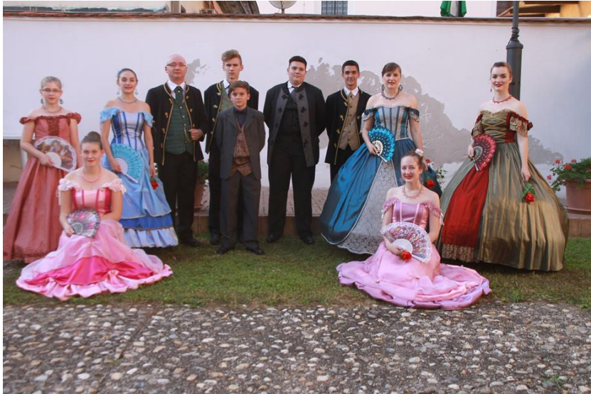
Slika 13. Udruga Potkalnički plemenitaši na manifestaciji Križevačko veliko spravišće