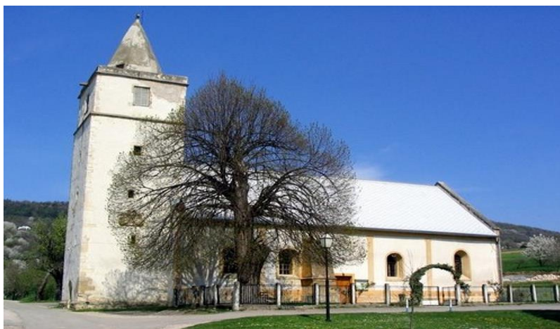
Slika 4. Župna crkva Uznesenja Marijina