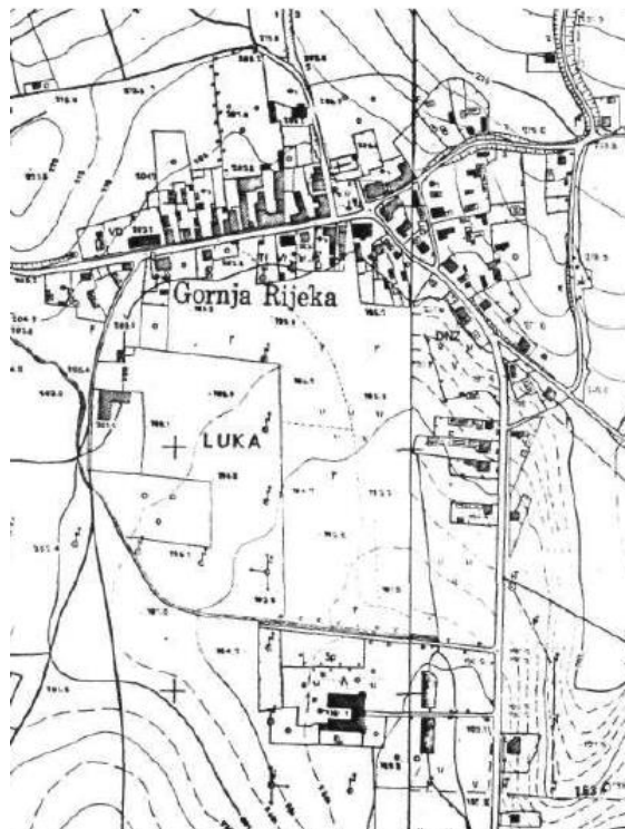
Slika 2. Smještaj Gornje Rijeke

Uz glavnu cestu niz je gradskih kuća s kraja 19. i početka 20. stoljeća. Općina Gornja Rijeka ima povoljan prometni položaj jer se nalazi u neposrednoj blizini autoceste A4 Zagreb–Varaždin. Kroz Općinu Gornja Rijeka prolazi dionica ceste D22 Novi Marof–Križevci–Sveti Ivan Žabno.