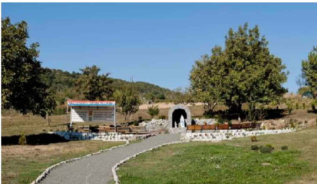
Slika 5. „Potkalnički Lourdes“

Posebno je u crkvi Uznesenja Marijina značajna grobnica obitelji Rubido–Zichy. Grobnicu u crkvi Uznesenja Marijina 1884. postavio je zahvalni sin Radoslav grofice Sidonije Erdödy Rubido. Prostorije u kojima su smješteni ljesovi s mrtvim tijelima sa članovima obitelji ukopani su pod crkvenim zidom oko 2 metra duboko ispod južnoga dijela zida crkve. U današnje vrijeme zbog izrazito dobre akustike u crkvi se često održavaju koncerti, te u njoj gostuju operne dive. Osim toga u crkvi djeluje kroz godinu nekoliko zborova, a njeguje se i tzv. pučko pjevanje. Općina Gornja Rijeka u dane blagdana „oživi“ jer se u crkvi skupi podosta ljudi, a posebno iz razloga jer se poštuju blagdani Velike i Male gospe, blagdan sv. Vida, sv. Fabijan, sv. Sebastijana, te sv. Florijana. U dvorištu crkve nedavno je izgrađena i spilja Majke Božje Lurdske, tzv. „Potkalnički Lourdes“ (Slika 5.).