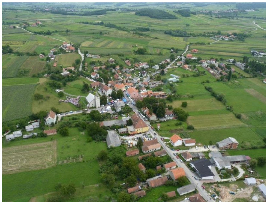
Slika 6. Općina Gornja Rijeka

Općina Gornja Rijeka 13 (Slika 6.) smještena je u zapadnom dijelu Kalničkog gorja, ispod nekadašnjeg vlastelinskog grada Malog Kalnika. Mali Kalnik smješten je na teško pristupačnoj stijeni zapadnog dijela planine Kalnik. Danas su vidljive samo ruševine starog grada Mali Kalnik. Nekada pokraj utvrda nalazila se i kapelica sv. Barbare koja je krajem 18. st. srušena. Kalničko prigorje obuhvaća u užem administrativnom smislu Grad Križevce i općine Gornje Rijeke, Kalnik Sv. Ivan Žabno i Sv. Petar Orehovec. Kalničko prigorje je brežuljkasto poljoprivredno područje, dijelom obraslo šumom, na kojem se stanovništvo bavi ratarskim kulturama, voćarstvom, vinogradarstvom te stočarstvom u proizvodnjom mlijeka. Krajem dominira visoko i kamenito Kalničko gorje s blagim brežuljcima i padinama. Reljef je raščlanjen brojnim dolinama, šumama i blagim brežuljcima. Iznad općine Gornje Rijeke nalazi se slap koji je dio potoka Šokot koji prolazi kroz dugački klanac, u području koji se zove Sopot. Slap je visok 3,5m i širok 2,5m, a osim glavnog postoji i nekoliko manjih slapova. U blizini slapa nalazi se i istoimeni vrh Šokot.