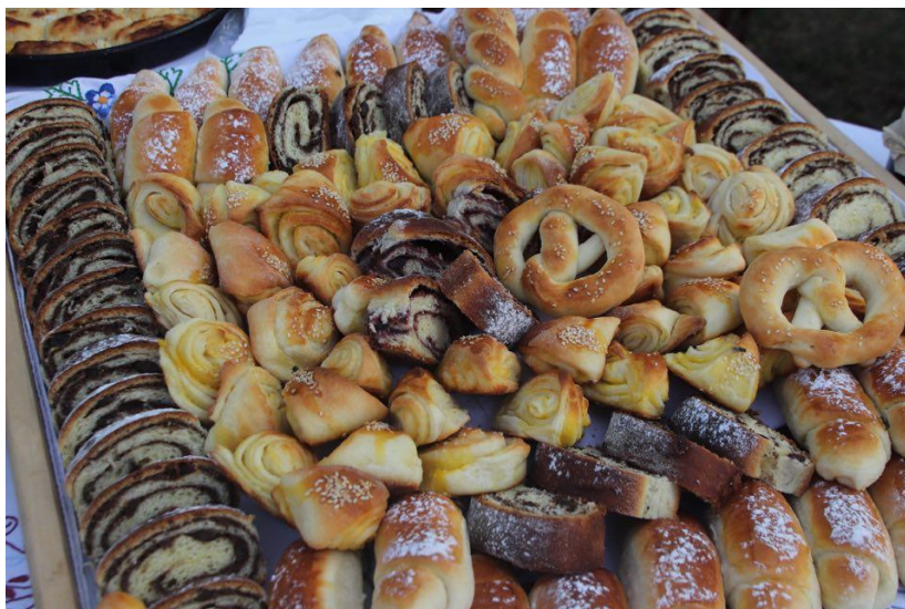
Slika 11. Domaći proizvodi od šljiva

marmelade od šljiva, džemovi od šljiva, rakija šljivovica, te ostali tradicijski proizvodi u kojima je šljiva glavni sastojak.