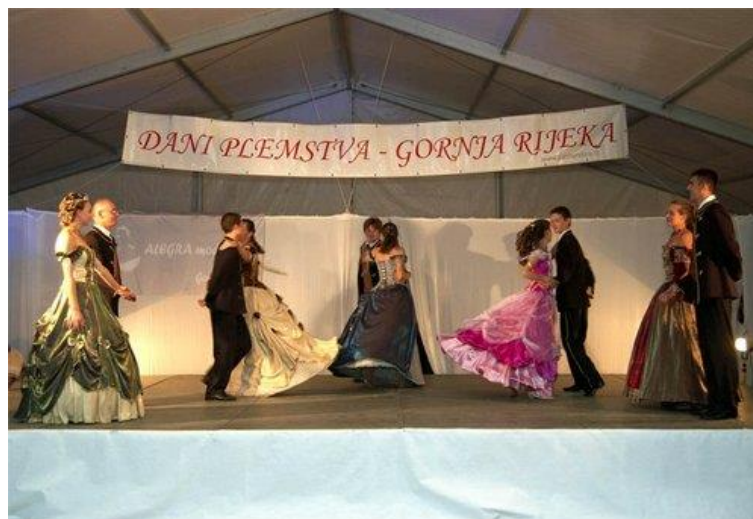
Slika 9. Dani plemstva

Veliku pozornost pridaje se i manifestaciji Dani plemstva (Slika 9.) jer je vezana uz župnu crkvu Uznesenja Marijina i održava se u povodu blagdana Velike Gospe dana 15. kolovoza. Tada se održava sveta misa te se skupi podosta ljudi. Nakon mise tradicionalno se održava nogometni turnir, gdje se okuplja 20-ak ekipa iz raznih županija. Turnir uvijek prate i zabavni programi s koncertom nekih pjevača. Navedena manifestacija posvećena je tradiciji „Potkalničkih plemenitaša“ tkz. Šljivara. Nekada se na navedenoj manifestaciji tradicionalno održavao izbor najplemkinje, najplemića i najprinceze. Raznovrsni program za isti dan pripremali su članovi udruge Potkalnički plemenitaši.