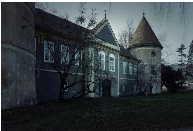
Slika 3. Dvorac Erdödy – Rubido

– Gospodin Božić je 2015. godine podnio zahtjev za revizijom odluke o stečaju Vrhovnom sudu. Dok on ne donese rješenje, ja ne mogu učiniti ništa s imovinom tvrtke Split Ship Management, odnosno oglasiti je na prodaju kako bi se namirili vjerovnici – kazao nam je prošli tjedan Zoran Miletić, stečajni upravitelj iz Splita koji vodi taj predmet. Kazao je kako raspolaže neslužbenim informacijama da bi Vrhovni sud odluku trebao donijeti do konca ove godine. Tada bi i dvorac u Gornjoj Rijeci mogao na dražbu.“ 12