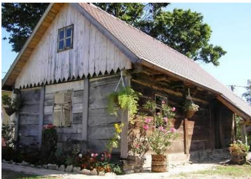
Slika 12. Drvena hiža u Kostanjevcu Riječkom