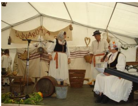
Slika 10. Šljivarijada u Dropkovcu

Manifestacija zvana Šljivarijada u Dropkovcu (Slika 10.) održava se u naselju Dropkovec, koje naselje je sastavni dio općine Gornja Rijeka. Ista se održava potkraj mjeseca kolovoza u sklopu „Šljivarskog čoška“. Ime „Šljivarski čošak“ je dobilo ime po mještanima koji se od davnina nazivaju „Šljivari“. Prema legendi o kralju Beli IV. koji se skrivao od Tatara, mještani su ga hranili šljivama kako bi preživio. Zauzvrat kao zahvalu što su ga mještani hranili i spasili, kralj im je dodijelio plemenitaške titule, pa ljudi u ovom naselju često znaju isticati da imaju plavu krv plemenitaša. Uz pomoć mještana sportsko–rekreacijsko društvo zvano „Plava krv“ je uredilo „Šljivarski čošek“ 14 . U njemu su postavljeni stari elementi etno sela u kojem se nalazi stari dreš i sjenica. Oko etno sela nalazi se uređen mali etno park i obnovljen je bunar. Uz etno selo nalazi se nogometno igralište s tribinom od 75 sjedećih mjesta i dječje igralište. Ova manifestacija ima kulturno–povijesni karakter, jer se temelji na povijesnim činjenicama i tradiciji. Šljivarijada se priređuje u znak sjećanja na kalničke šljivare. Spomenuta manifestacija ima i gastronomski karakter jer se daje naglasak na šljivu koja ima vrijednosti još od davnina.