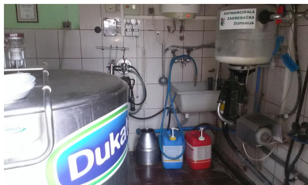
Slika 7. Izmuzište na OPG Horvatić