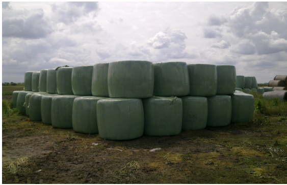
Slika 10. Silaža talijanskog ljulja