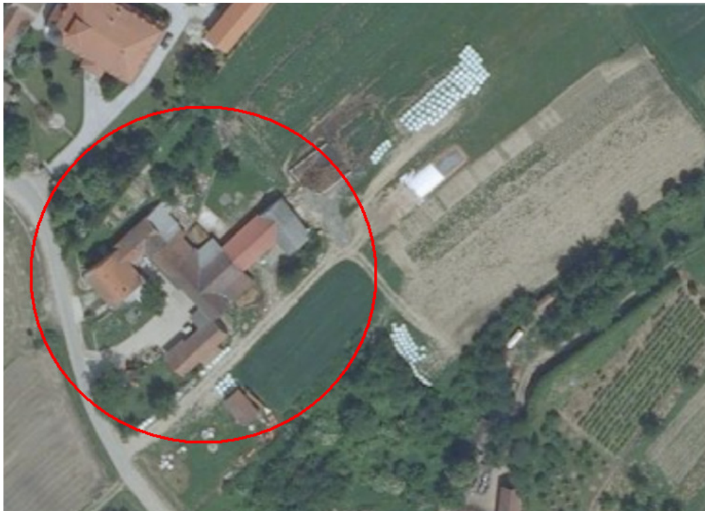
Slika 5. Satelitska snimka gospodarstva Horvatić

Mlijeko je istraživanih godina, kao i danas, otkupljivala Zagrebačka mljekara Dukat. Gospodarstvo je raspolagalo sa 44 ha poljoprivrednih površina, od čega je 27 hektara bilo u vlasništvu, a 17 hektara u zakupu. U 2013. godini gospodarstvo je imalo 24 mliječne krave dok je 2014. stočni fond povećan na 28 mliječnih krava.