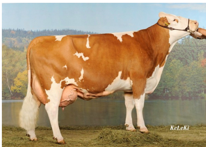
Melli (Rommel x Flipper) GZW 114 ŽP: 5/4 51.798 kg Rez. šampionke dugovječnih krava

Simentalska pasmina goveda jedna je od najpoznatijih kombiniranih pasmina na svijetu s dvostrukom namjenom: za proizvodnju mlijeka i za proizvodnju mesa. Podrijetlo pasmine je Švicarska. Osnovne karakteristike simentalskog goveda je dlaka koja je svijetložute do crvene boje, po tijelu se nalaze bijele plohe različite veličine, dok su glava i rep bijele boje. Životinja je snažne konstitucije, prilagođena uvjetima proizvodnje u nizinskim i brežuljkastim krajevima Hrvatske. Ta je pasmina po zastupljenosti dominantna u Hrvatskoj (oko 70 %). Tjelesna masa krava kreće se 600-750 kg, visine u grebenu 136-140 cm (Domaćinović, 2008).