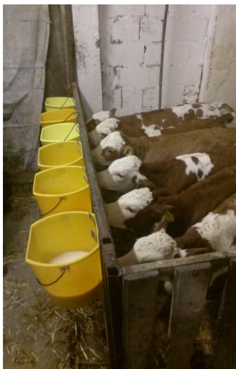
Slika 13. Napajanje teladi na OPG Horvatić