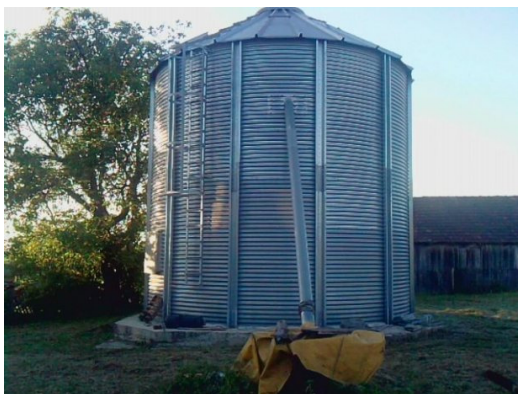
Slika 8. Silos za kukuruz u zrnu

Prinos zrna kukuruza koji se postižu na gospodarstvu bio je oko 8 t/ha u 2013. godini zbog suše, a u 2014. godini prinos je bio oko 11 t/ha. Vlaga zrna iznosila je od 25 do 28 %. Pobrano zrno sušilo se pomoću toplog zraka u sušarama da bi mu se sadržaj vode spustio na 14 % pri čemu se čuvao u skladištima i silosima (slika 8). Prinos silaže u 2013. godini je bio oko 50 t/ha, dok je 2014. godine bio oko 65 t/ha. Siliranjem biljne mase kukuruza nastoje se sačuvati i održati duže vrijeme hranive tvari svježije mase bez bitnih promjena, odnosno dobiva se ujednačena kvaliteta hrane tijekom cijele godine. Proces siliranja trajao je 4-6 tjedana i nakon toga silaža je prikladna za hranidbu stoke. Silažna masa se dovozila na zemljanu podlogu bez dodatnih izgrađenih okvira za punjenje (slika 9). Silos se prikrivao plastičnom folijom na koju se još stavljala i mreža koja služi kao zaštita od sitnih životinja ili drugih vanjskih nepravilika.