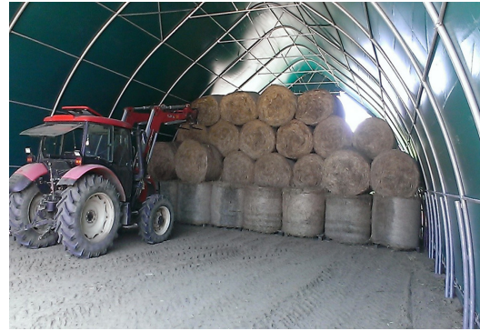
Slika 11. Sijeno