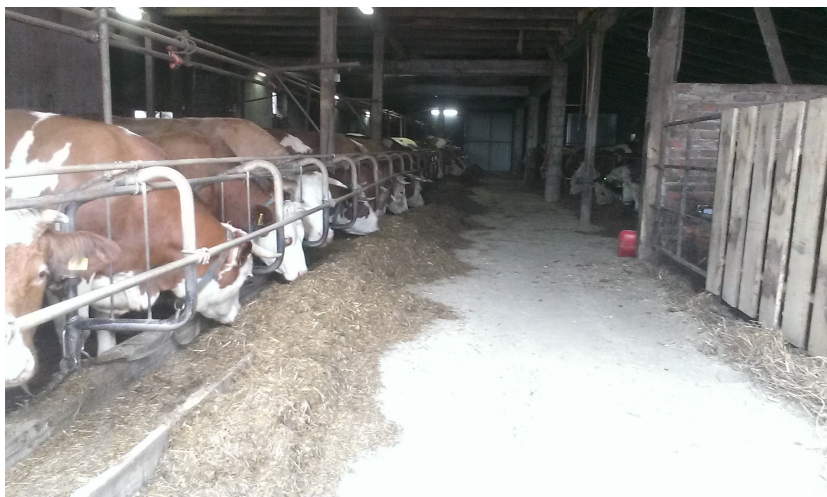
Slika 6. Staja mliječnih krava na OPG Horvatić

OPG Horvatić je u 2013. godini imalo 24 muzne krave, 8 steonih junica te 13 ženske i 9 muške teladi. U 2014. gospodarstvo je povećalo stočni fond te je imalo 28 mliječnih krava, 12 steonih junica te 15 ženske i 13 muške teladi. Razlog povećanju stočnog fonda možemo potražiti u činjenici da je tih godina proizvodnja mlijeka bila izrazito isplativa. Tako da se ženska telad ostavljala dalje za rasplod, a muška se točila do 650 kg težine nakon čega se prodavala u klaonicu.