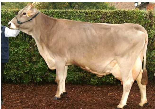
Slika 3. Krava smeđe pasmine