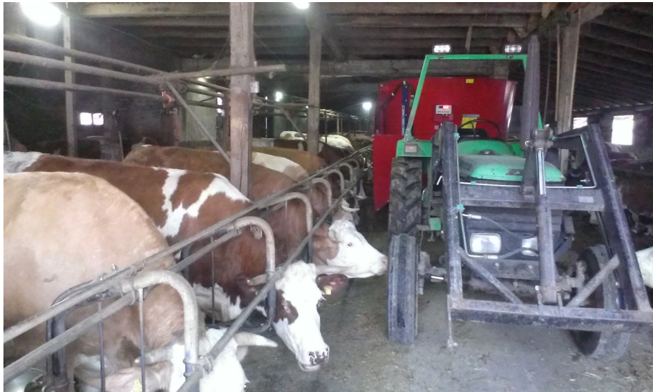
Slika 12. Hranjenje muznih krava mikser (TMR) prikolicom

i sjenažom. Junice su se pripuštale u dobi od 15-17 mjeseci i težini oko 380 kg. Nakon pripusta dnevni prirast junica ne prelazi 650 grama. U posljednja dva mjeseca graviditeta preporučuje se isti način hranidbe koji se primjenjuje kod gravidnih krava s puno voluminozne krme ako je krma odlične kvalitete. Kukuruzna silaža nije preporučljiva, a ako se mora davati, ne smije prijeći 8 kg na dan, ali onda uz nju se daje barem 3 kg slame na dan i obavezno se dodaje 50-80 grama mineralno-vitaminskih dodatka. Zadnja 3 tjedna prije teljenja junice su se hranile kao i krave prije teljenja. Postupno se uvodila najbolja voluminozna krma i 2 kg smjese za suhostaj na dan.