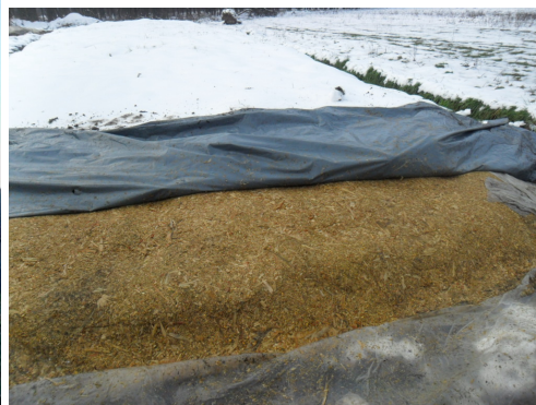
Slika 9. Kukuruzna silaža