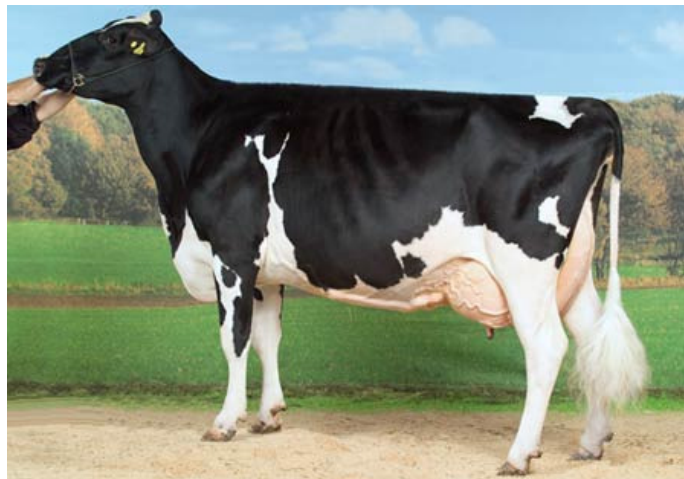
Slika 2. Krava holštajn pasmine

Glavni uzroci ranog izlučivanja, odnosno godišnjeg remonta i do 30, su neplodnost i mastitis. Kratki životni vijek nije genetski određen (Caput, 1996).