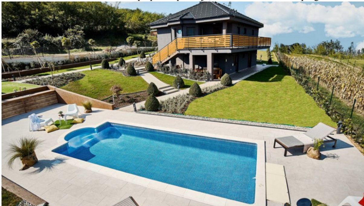
Slika 3. Mala kuća Mia za odmor i potpuno opuštanje, financirano iz IPARD programa