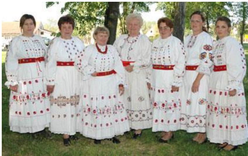
Slika 8. Članice Udruga žena „Hrvatsko srce“ iz Drnja