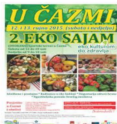
Slika 4. Letak 2. Eko sajma u Čazmi

Eko sajam u Čazmi pod nazivom „Eko kulturom do zdravlja“ (slika 4, 5 i 6), unazad dvije godine pod nazivom „Zdrava hrana vaš izbor“ održava se 5. godinu zaredom u mjesecu rujnu, u trajanju od dva dana. To je manifestacija koja okuplja certificirane proizvođače ekološke hrane. Organizator Eko sajma je županijska udruga „Eko kultura“, a popratni sadržaji sajma su pripremanje eko hrane, razne radionice i edukativna predavanja o zdravoj hrani, programi za djecu te ostali zabavni sadržaj. Sajam se na samim počecima održavao na prostoru sportskih terena Grada Čazme, ali se sada premjestio na Trg čazmanskog kaptola, u samom centru Grada. Na sajmu sudjeluje oko tridesetak proizvođača ekološke hrane, a u ponudi se mogu naći proizvodi od raznog voća, lavande, razne ljekovite kreme i preparati, razno povrće, čajevi, proizvodi od industrijske konoplje i slično. Promoviranje eko sajma odvija se putem radija, ne samo čazmanskog, već i drugih, te putem plakata. Posjetitelji sajma mogu se informirati o proizvodnji proizvoda, kušati ih te ih i kupiti.