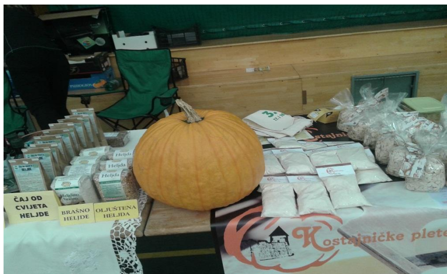
Slika 6. Primjer izložbenog stola na Eko sajmu u Čazmi