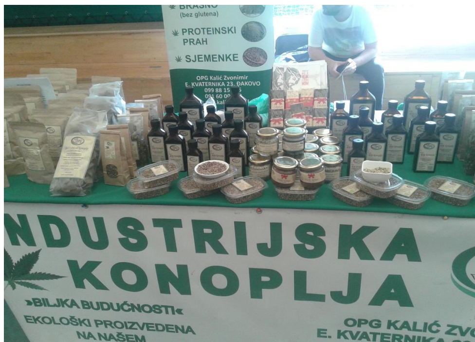
Slika 5. Primjer izložbenog stola na Eko sajmu u Čazmi