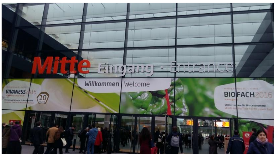
Slika 3. Međunarodni sajam BIOFACH u Njemačkoj

Međunarodni sajam BIOFACH (slika 3) jedan je od najvećih eko sajmova u svijetu, a odražava se od 1990.g. u izložbenom centru u Nürnbergu, Njemačka. Sajam BIOFACH održava se pod pokroviteljstvom svjetske organizacije IFOAM – Međunarodna organizacija za ekološku poljoprivredu. Republika Hrvatska na sajmu je prvi puta sudjelovala 2009.g. pod pokroviteljstvom Ministarstva poljoprivrede. Neki od hrvatskih eko proizvođača koji se predstavljaju na sajmu su; Art of Raw, Bobica, Ecogos, Exploria, Jan Spider i mnogi drugi.