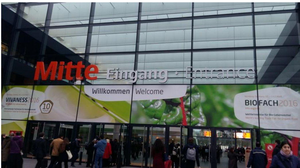
Slika 3. Međunarodni sajam BIOFACH u Njemačkoj

Međunarodni sajam BIOFACH (slika 3) jedan je od najvećih eko sajmova u svijetu, a odražava se od 1990.g. u izložbenom centru u Nürnbergu, Njemačka. Sajam BIOFACH održava se pod pokroviteljstvom svjetske organizacije IFOAM – Međunarodna organizacija za ekološku poljoprivredu. Republika Hrvatska na sajmu je prvi puta sudjelovala 2009.g. pod pokroviteljstvom Ministarstva poljoprivrede. Neki od hrvatskih eko proizvođača koji se predstavljaju na sajmu su; Art of Raw, Bobica, Ecogos, Exploria, Jan Spider i mnogi drugi.