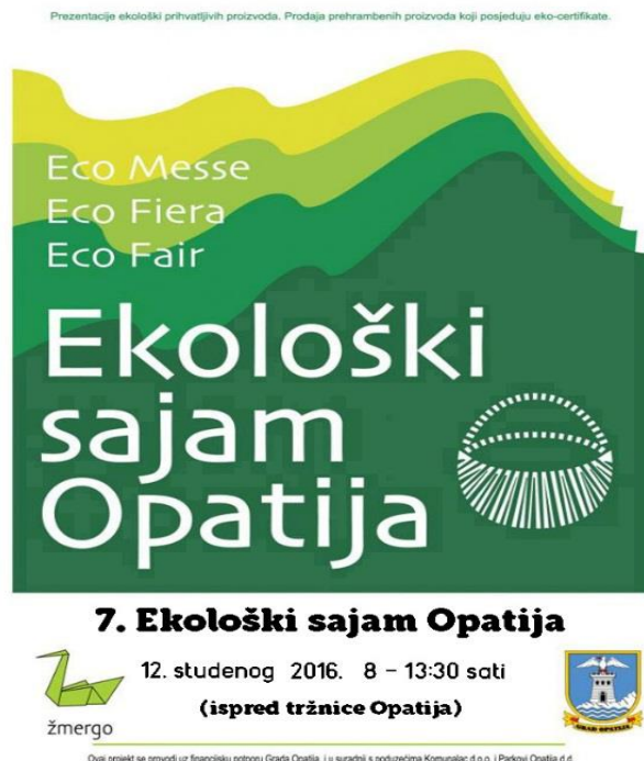
Slika 1. Prikaz plakata Ekološkog sajma u Opatiji