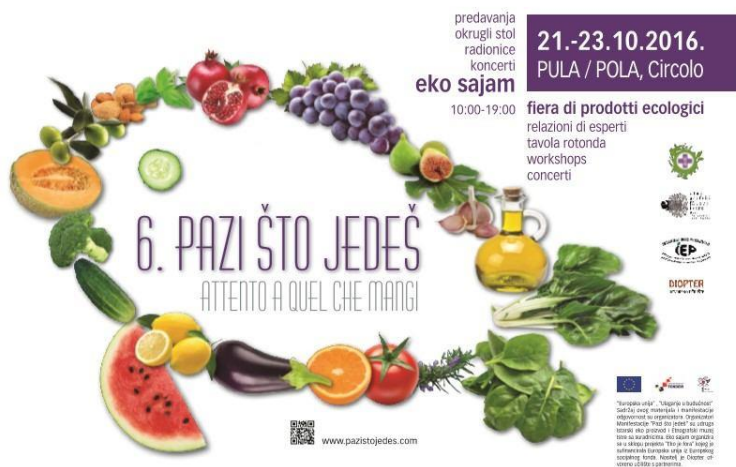
Slika 2. Prikaz plakata manifestacije „Pazi što jedeš“

„Pazi što jedeš“ manifestacija je koja se održava u Puli od 2011. godine (slika 2). Manifestacija je edukativnog i sajmenog karaktera na kojoj izlažu eko proizvođači iz cijele Hrvatske. 2017.g. tema sajma bila je „Znanje i okus“-prenošenje znanja i očuvanje okusa, a naglasak je bio na tradicijskim receptima karakterističnim za Istru. Organizator ovog sajma je Etnografski muzej Istre.