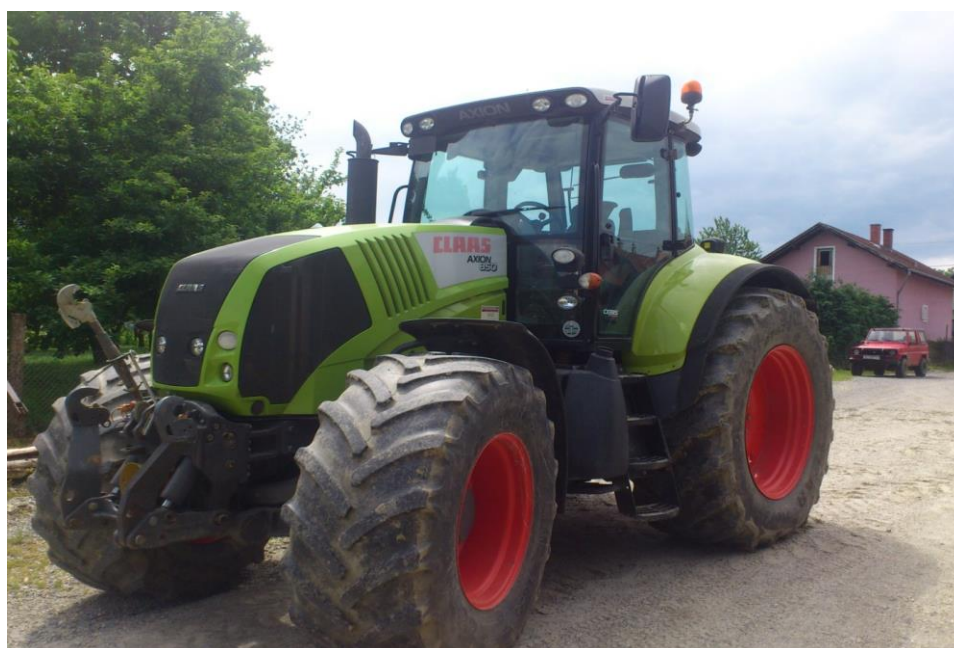
Slika 9. Traktor Claas axion 850

Claas Axion 850 2007. godina proizvodnje, 3750 radnih sati. Motor DPS turbo punjeni dizel 6 cilindara i 24 ventila hlađenje kilerom pomoću rashladne tekućine. Traktor je snage 265 KS 195 kw, maksimalna brzina traktora je 50 km/h što mu daje dodatnu prednost na cesti u transportu. S njim se najviše obavljaju zahvati kao što su oranje i rotiranje.