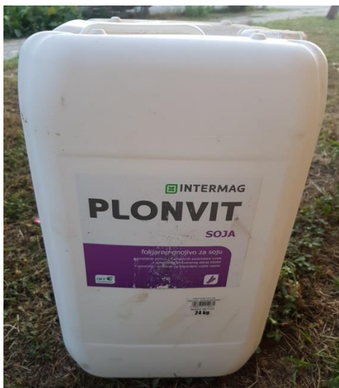
Slika 18. Folijarno gnojivo Plonvit soja

Na gospodarstvu je izvršena gnojidba i to predsetveno u količini od 350 kg/ha gnojiva NPK 15:15:15. Od te količine gnojiva u tlo je čistih hranjiva dodano 52kg dušika, 52 kg fosfora i 52kg kalija/ha. Za folijarnu prihranu preko lista koristili su Plonvit soja folijarno gnojivo koje je otopina dušičnog gnojiva N-15 s mikro-hranjivim tvarima i opskrbljuje biljku svim potrebnim mikroelementima koji odgovaraju za potrebe soje, te sadrži magnezij i dušik koji poboljšavaju usvajanje i upijanje mikroelemenata. Od drugih još elemenata sadrži i kobalt koji je neophodan za biljke koje žive u simbiotskoj zajednici s kvržičnim bakterijama. Folijarno gnojivo Plonvit soja se primjenjivalo u količini od 2 l/ha, koncentracijom otopine gnojiva najviše je dodano dušika i to u količini od 360 g/ha.