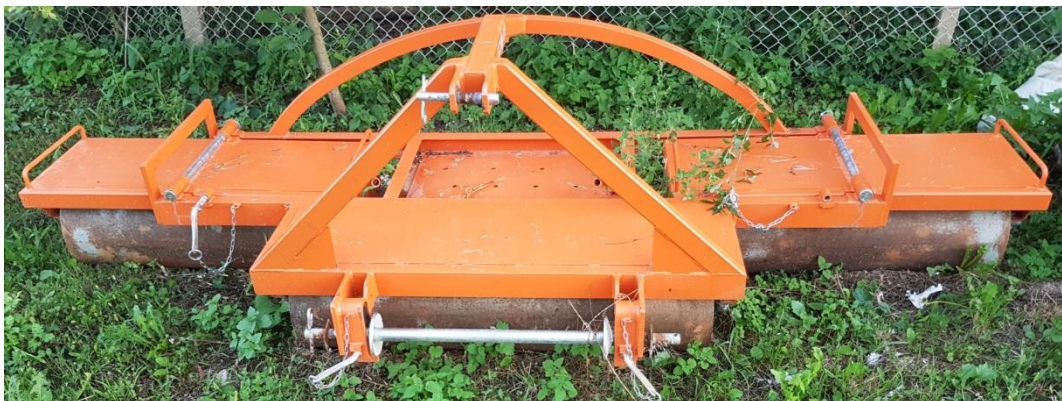
Slika 16. Valjak

Valjak širine radnog zahvata 3 m, sklopiv je radi lakšeg transporta. Koristi se za valjanje soje nakon sjetve tako da se postigne što bolji dodir tla sa sjemenom. Valjak sadrži valjka od po 1m radnog zahvata te srednji valjak je fiksiran dok su bočni valjci pokretni i prate oblik terena. Valjak je napunjen vodom koja mu daje dodatnu težinu za bolji pritisak i poravnavanje tla.