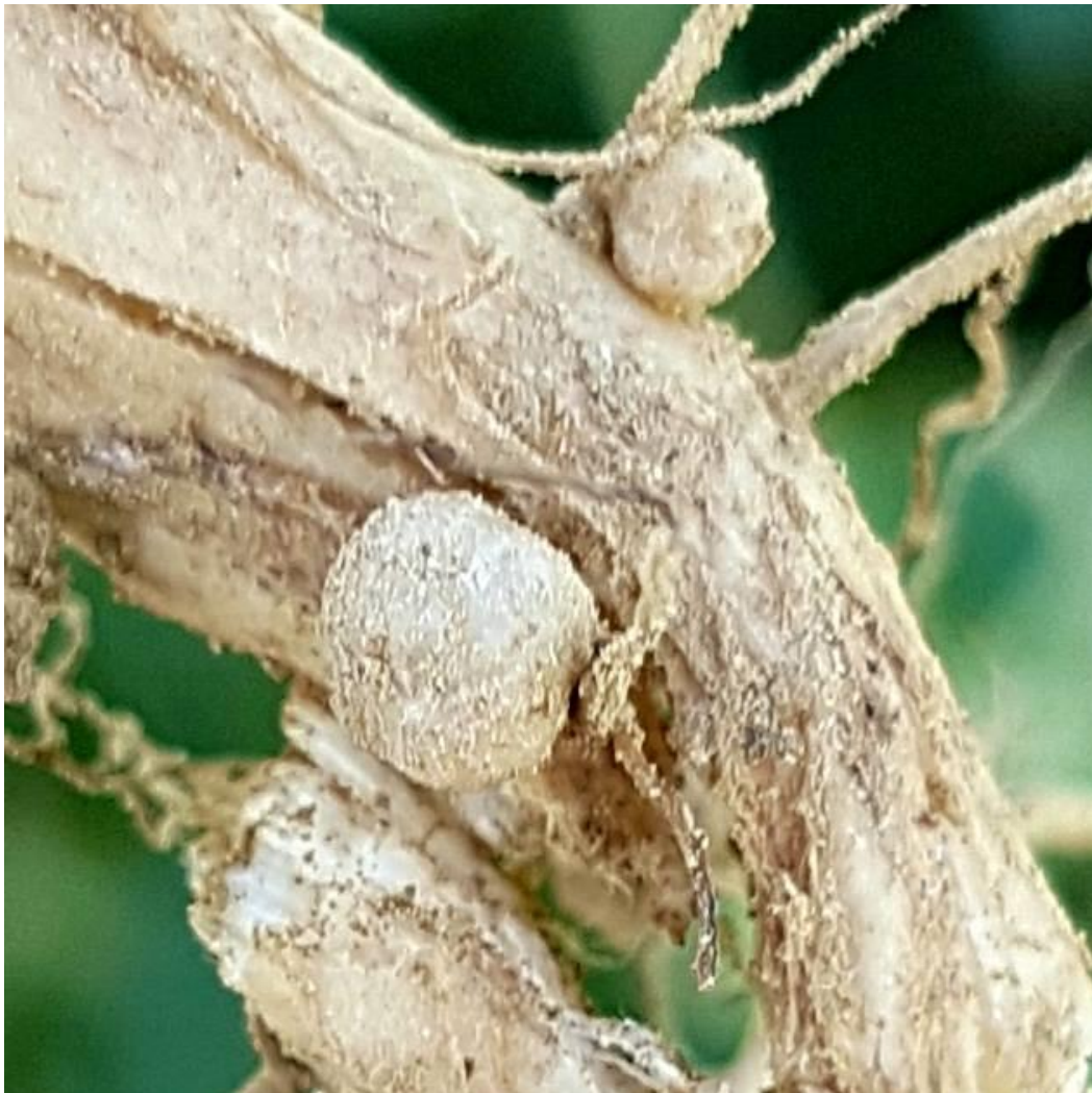
Slika 8. Kvržične bakterije na korijenu soje

može odbaciti (Topali i Kanižaj Šarić, 2013.) U sredini sezone rasta na korijenu leguminoze trebale bi dominirati kvržice koje su na presjeku ružičaste ili crvene boje. No ako dominiraju bijele, sive ili zelene kvržice, fiksacija dušika je slaba, što može biti rezultat infekcije i nodulacije s neučinkovitim slojem kvržičnih bakterija, nedovoljne ishrane biljke, razvoja mahune ili nekog drugog uzroka stresa biljke. Kod zrelih kvržica od osnovne važnosti je njihova građa jer je upravo ona odgovorna za osiguravanje točno određenih uvjeta koji omogućuju nesmetano odvijanje procesa fiksacije molekularnog dušika. Kod leguminoza, u svakoj zreloj kvržici nalazi se peribakteroidna membrana stvorena od biljke koja okružuje unutarstaničnog mikrosimbionta, odnosno bakterioide koji u stanicama kvržica fiksiraju atmosferski dušik.