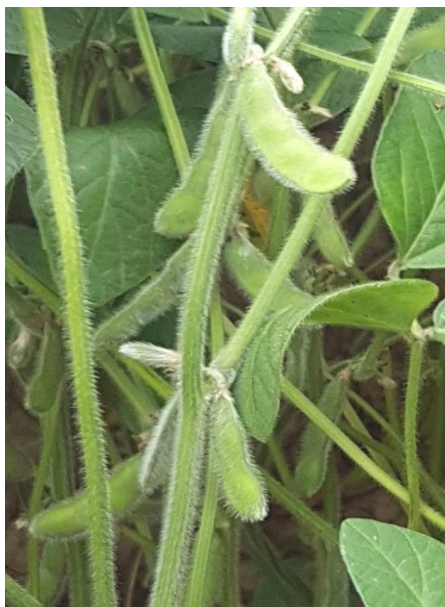
Slika 4. Mahuna soje