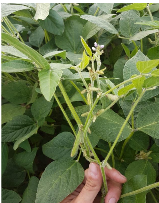
Slika 2. Stabljika soje