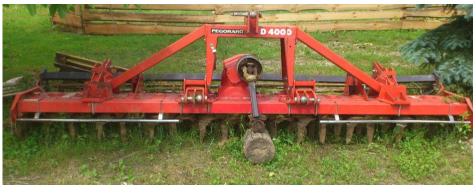
Slika 12. Roto drljača Pegoraro D4000

Od mehanizacije za sjetvu i obradu tla na gospodarstvu se koriste: Roto drljače marke pegoraro D4000, priključuju se na traktor s plivajućim donjim priključcima u dva položaja. Mjenjač u reduktoru je sa dvije brzine rada kod 540 o/min kardanskog vratila broj okretaja radnih tijela-noževa 193 o/min i kod okretaja kardanskog vratila od 1000 o/min broj okretaja radnih tijela-noževa je 357 o/min. Drljača ima 32 noža, radni zahvat joj je 4m a dubina obrade 28cm iza ima letvičasti valjak koji dodatno usitnjava krupnije grude tla.