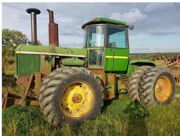
Slika 11. Traktor john deere 8630

John Deere 8630 godina proizvodnje 1978. ima 10,1 L 6 cilindrični motor 275 KS 205kw. Traktor je pogon na sve kotače i radi boljeg upora i prijanjanja na podlogu ima duple kotače i na prednjem i stražnjem djelu. Izvedba je zglojni traktor koji služi za vuču teških vučenih tanjurača te zbog zglobnog skretanja puno je lakši rad s tanjuračama.