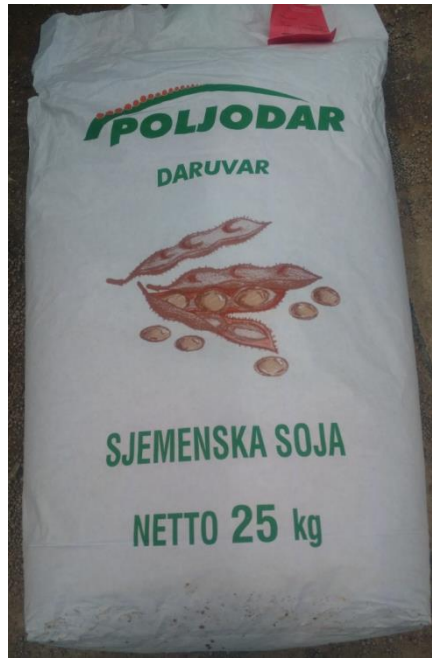
Slika 21. Vreća sjemenske soje