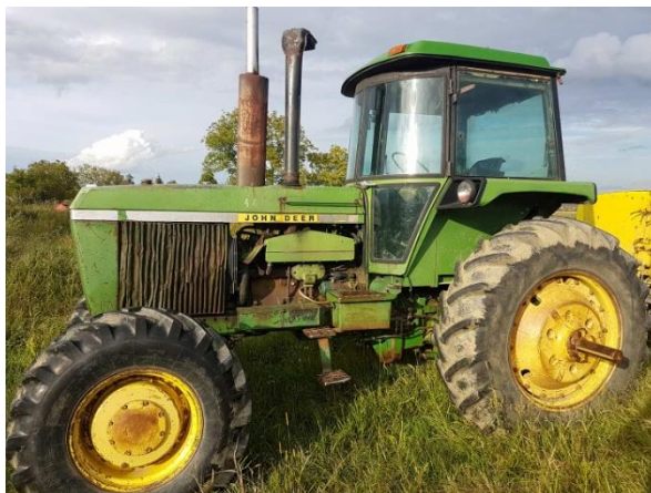
Slika 10. Traktor john deere 4630

John Deere 4630 godina proizvodnje 1976. sa 6 cilindarskim dizel motorom snage 170KS. Najčešće se upotrebljava u poslovima rotiranja, sjetve te vuče cisterne kod prskanja. Traktor je vrlo dobre okretnosti.