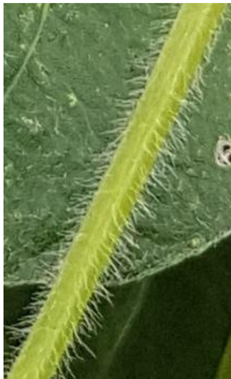
Slika 3. Sojine dlačice

Dlake soje su jednostanične i nastaju iz stanica epiderme. Svaka normalna sojina biljka prekrivena je dlakama. Postoje umjerene varijacije u broju, opsegu, orijentaciji i rasporedu dlačica, iako većina sorti ima prosječnu količinu dlaka koje su poredane zbijeno u razmaknutim vertikalnim redovima na stabljici (Vratarić i Sudarić, 2008.) Nadalje, postoje i sorte s vrlo gustim dlakama, poput krzna, kao i sorte koje imaju vrlo rijetke dlake na stabljici. Većina dlaka su pod pravim kutom, tj. uspravne su, no postoje i sorte kod kojih su dlake prilegnute. Boja dlaka je najčešće siva ili smeđa, a smeđe dlake su uglavnom dominantnije nad sivim.