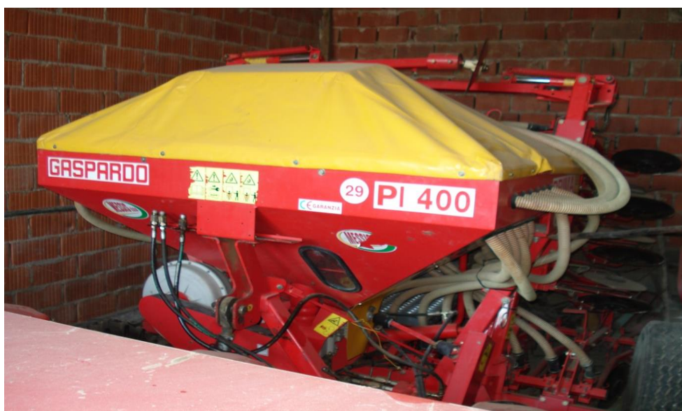
Slika 13. Pneumatska žitna sijačica

Pneumatska žitna sijačica marke Gaspardo PL400 koristi se za sjetvu soje na gospodarstvu. Radna širina sijačice je 4m, dubina sjetve sijačice je 5 cm. Razmak između redova sijačice je nešto manji zato što je to žitna sijačica tako da se zatvaraju svaki drugi red na sijačici da se dobije razmak između redova 25 cm.