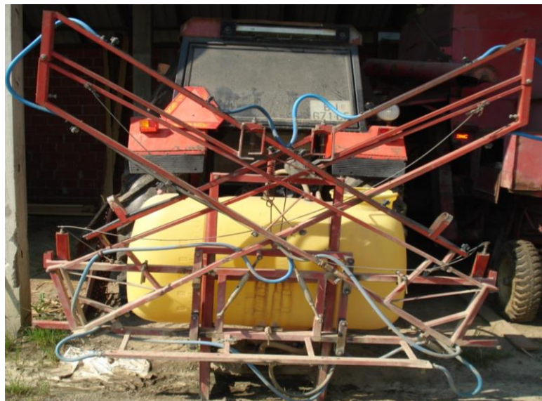
Slika 15. Prskalica

Prskalica proizvođača Agromehanika 600 L spremnik za tekućinu, radna širina prskalice je 12 m sa mehaničkim rasklopivim granama.