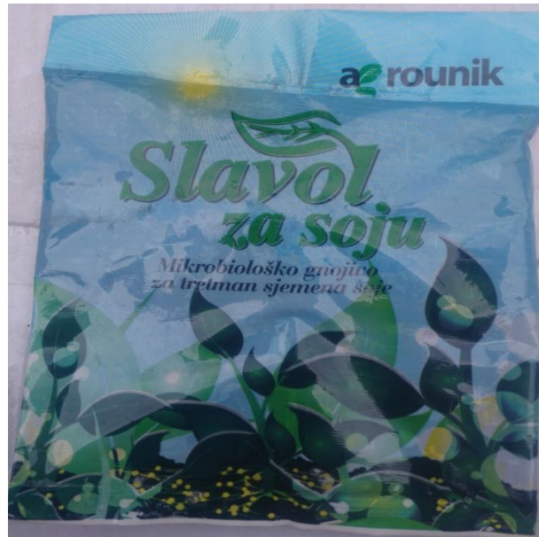
Slika 19. Bakterije za inokulaciju sjemena soje