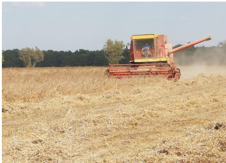
Slika 23. Žetva soje na gospodarstvu Dergić

Žetvu soje trebalo bih obaviti prije nego što mahune počnu pucati i sjeme ispadati iz njih jer tada dolazi do velikih gubitaka najviše ekonomskih. Žetva soje na gospodarstvu poljoprivredno-prijevozničkog obrta Dergić obavljena je u periodu od 30.rujna do 3.listopada. Žetva je obavljena kombajnom marke Zmaj 170 sa žitnim adapterom širine radnog zahvata 5,5m. Prije same žetve kombajn je prilagođen za soju. Vlažnost zrna soje u žetvi bih trebala biti između 14 i 16%, a na gospodarstvu u žetvi soja je imala 16% vlažnost zrna. Prinos soje na gospodarstvu je bio dosta smanjen zbog izrazito sušne godine i leda koji je u fazi cvatnje pao te ošteti i uništio jedan dio soje. Usjev se s vremenom oporavio ali je broj mahuna bio znatno smanjena a time i prinos dosta manji. Prinos sorte Iak bio je 1,5t/ha a Tene 1,1t/ha. To je dosta nizak prinos jer su upravo te sorte oštećene tučom. Prinos pioneer sorte M10 bio je 2,2t/ha a sorte Lucija 2,3t/ha, a na smanjenje prinosa najviše je utjecalo sušno vrijeme dok je kod sorte pioneer M10 došlo i do djelomičnog osipavanja sjemena.