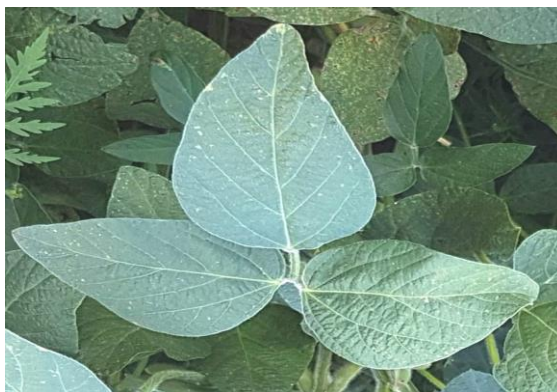
Slika 6. List soje

Kod soje postoje četiri tipa listova, a to su: kotiledoni, jednostavni primarni listovi, troliske i trokutasti listovi tj. zalisci. Primarni listovi formiraju se još u sjemenci i dobro su razvijeni kada klijanac izbija na površinu. Primarni listovi su jednostavni, s peteljkom dugom 1 do 2 centimetra, a položeni su jedan nasuprot drugog na stabljici. Ostali listovi, kako na glavnoj stabljici tako i na granama, su troliske i smješteni su na stabljici naizmjenično. Krmne sorte odlikuju veći listovi, dok su divlje sorte prepoznatljive po malim listovima. Neke sorte karakteriziraju vrlo uski listovi, a ovo svojstvo vezano je s većim brojem zrna u mahuni i većom otpornošću na sušu (Vratarić i Sudarić, 2008.) Većina sorata soje ima listove s tri lisice i uglavnom su podjednake veličine na cijeloj stabljici, a broj im se kreće prosječno 15-20 listova po biljci, a maksimalno može biti i do 100 listova. List se sastoji od epiderme, mezofila i provodnog tkiva. Tanki sloj kutina nalazi se na obje strane lista i na gornjem i na donjem epidermalnom sloju. Stome ili puči su prisutne na obje površine lista. Provodni sustav povezan je preko peteljke sa stabljikom te je na taj način omogućen protok vode i hranjivih tvari po cijelom listu.