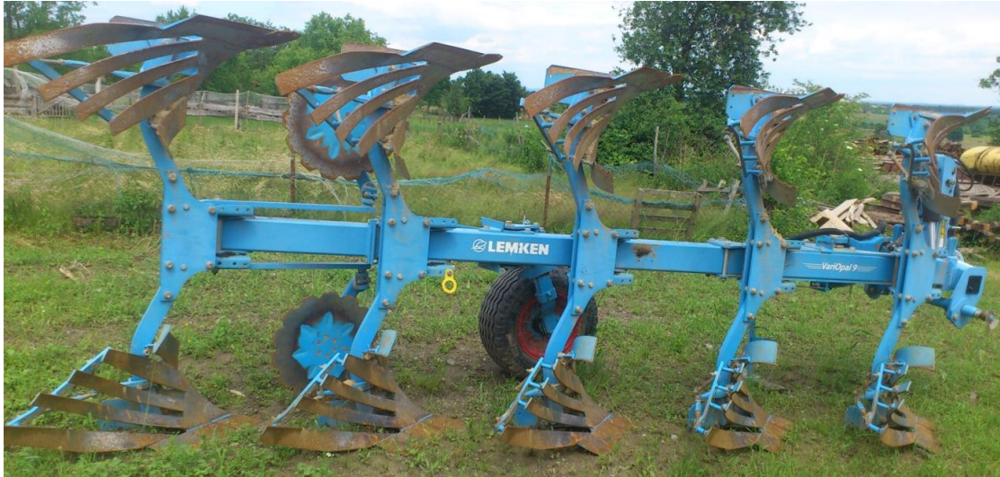
Slika 14. Plug

Plug je marke Lemken variopal 9 premetnjak koji ima 5 brazdi. Plug je podesivi od 25 – 55 cm radne širine jedne brazde. Oranje tim plugom je dosta jednostavnije jer se ore u ravnicu i daska pluga je letvičasta i samim tim brazda nakon okretanja nije slijepljena već rahlije strukture.