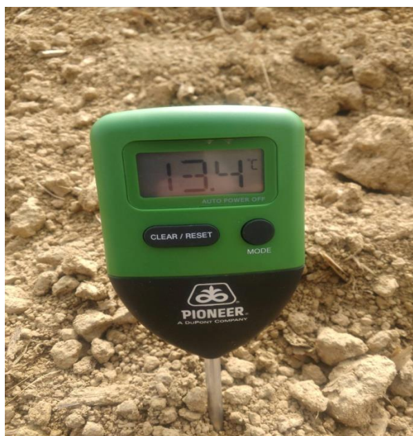
Slika 20. Uređaj za mjerenje temperature tla

Na gospodarstvu Dergić nekoliko dana prije sjetve soje izvršena su mjerenja temperature tla tj. sjetvenog sloja, temperatura je iznosila 13,4 °C što je idealna temperatura za sjetvu. Sjetva soje je bila u redove razmaka 25cm, što soji dobro pogoduje taj razmak između redova ali tada se ne mogu obavljati dopunske operacije suzbijanja korova strojno već se primjenjuju herbicidi, dubina sjetve iznosi 5 cm. Utrošena količina sjemena za sorte pioneer M-10 i Lucija je 135 - 140 kg/ha a nešto malo kasnije sorte Ika i Tena u količini od 120 kg/ha. Odmah nakon sjetve izvršeno je valjanje tako da se dobije što bolja povezanost tla sa sjemenom a time se potiče bolja adsorpcija hranjiva i brže klijanje. Od ostalih mjera njege koristila se zaštita od korova i folijarna prihrana soje.