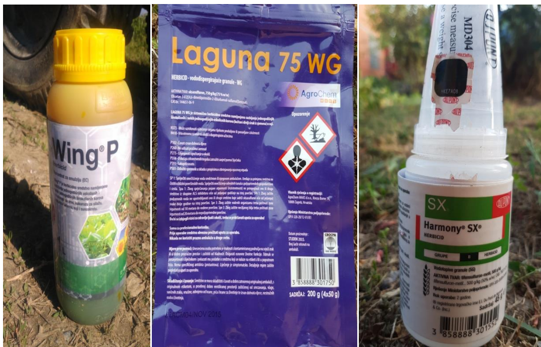
Slika 22. Sredstva za zaštitu Wing p, Laguna 75wg i Harmony sx