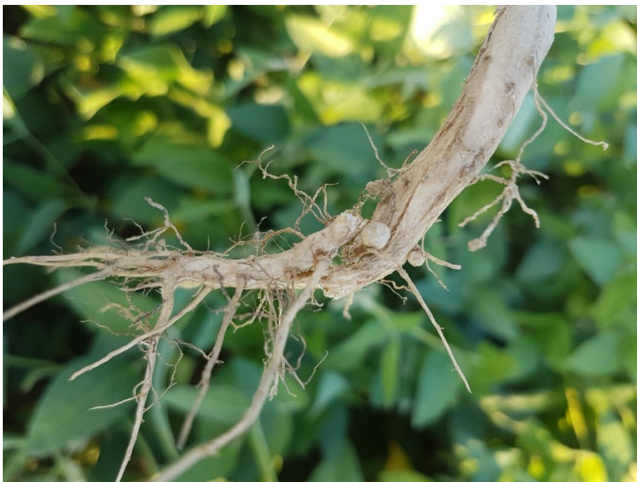
Slika 1. Korijen soje