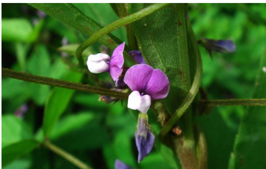
Slika 5. Cvijet soje