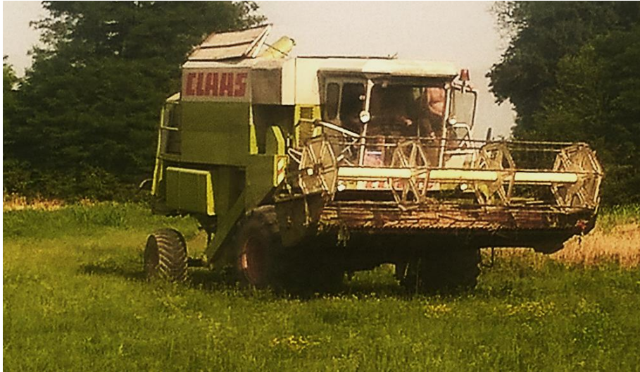
Slika 5. Žitni kombajn Claas Dominator 116cs