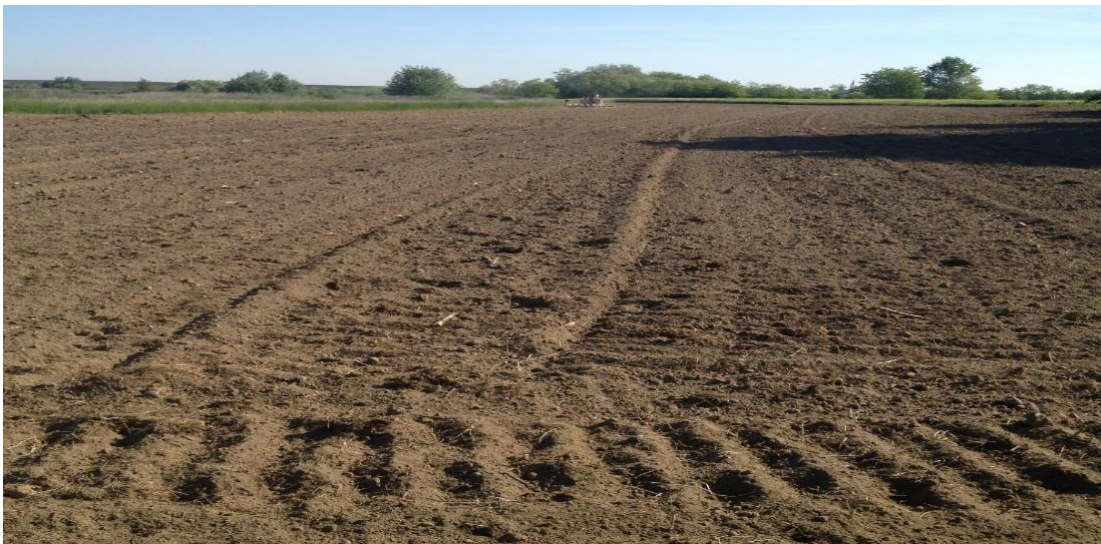
Slika 2. Prikaz površina nakon pred sjetvene pripreme

Na Opg-u Pongračić jesenska obrada tla vršila se na dubinu od 25 cm, nosećim četvero brazdnim plugovima premetačima proizvođača Vogel&Noot modela PF 20402 priključenim u tri točke na traktor marke Schlüter Super 1600 TVL snage 119 kw. Nakon jesenske obrade tla u proljeće vršena je pred sjetvena priprema tla roto drljačom marke IMT tipa Z313 zahvata obrade 3 m također priključena na isti traktor. Također u pred sjetvenoj pripremi je dodano 250 kg/ha NPK 15:15:15.