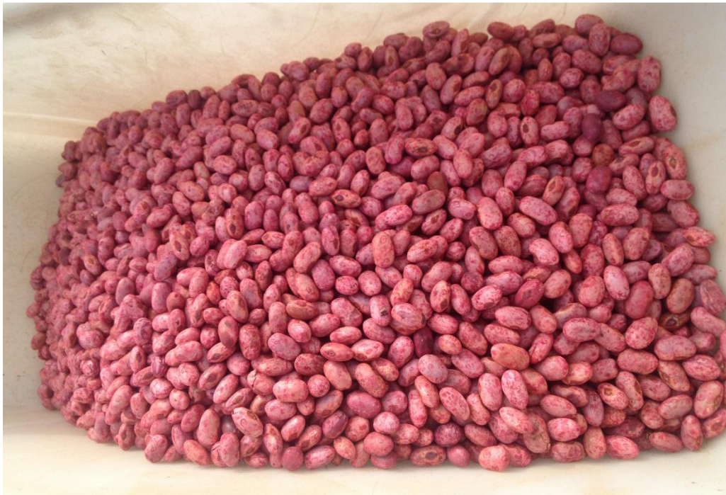
Slika 2. Sjeme tretoranog graha za sjetvu

Proizvodnja graha na OPG-u Pongračić vršila se na četiri oranice zajedničke površine od 1,87 ha. sjetva se vršila u optimalnom roku 04.05.2015. u četvero poljnom plodoredu nakon sirka. Sjetva graha obavljala se na razmak među redovima 45 cm, a u redu 5 cm, na dubinu od 3 cm. Tako da je z ovakvu sjetvu potrošeno 444 444 zrna/ha, te je bilo potrebno oko 110 kg/ha sjemena. Sjeme je bilo kategorije osnovno sjeme dobiveno od Semenarne Ljubljana d.d. sorte Trešnjevac. Sjetva se vršila sa 6 rednom pneumatskom sijačicom marke OLT 6 reda, priključena za traktor marke Massey Ferguson 135 snage 34 kw.