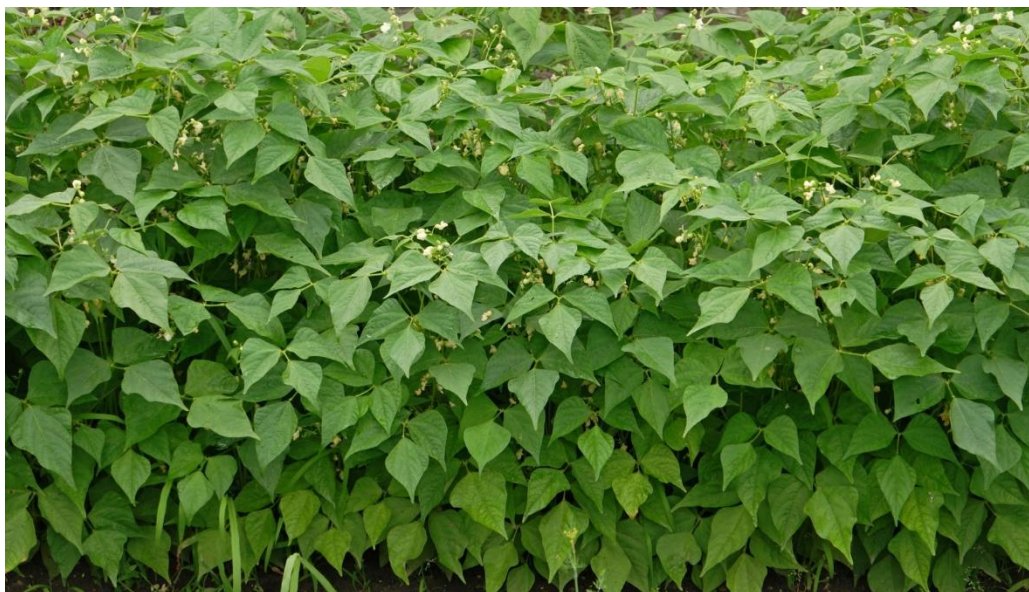
Slika 4. Cvatnja Phaseolus vulgaris

Na OPG-u Pongračić nadzor je vršio mr.sc Željko Tomić iz Centra za poljoprivredu, hranu i selo - Zavod za zaštitu bilja. Prvi pregled vršen je 7.7.2015. u stadiju cvatnje iz koje je zaključeno da nije prisutna bakterija Xanthomonas phaseoli . Drugi pregled radio se 3.8.2015. tj. sredina fiziološke zriobe te nisu bili zamijećeni simptomi napada bakterije Xanthomonas phaseoli i nisu uzeti uzorci graha.