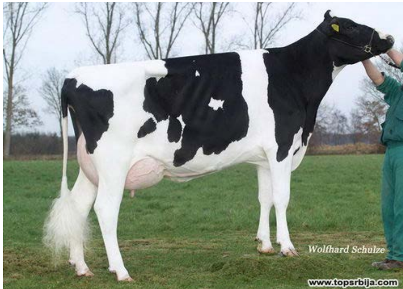
Slika 2. Krava Holstein pasmine

dok se crveno-bijeli (Red Holstein) javlja u otprilike 1% slučajeva. Proizvodni vijek holstein pasmine je relativno kratak, u prosjeku 3 do 4 godine u intenzivnoj proizvodnji. Glavni uzroci ranog izlučivanja, odnosno godišnjeg remonta i do 30%, su neplodnost i mastitis. Kratki životni vijek nije genetski određen (Caput, 1996).