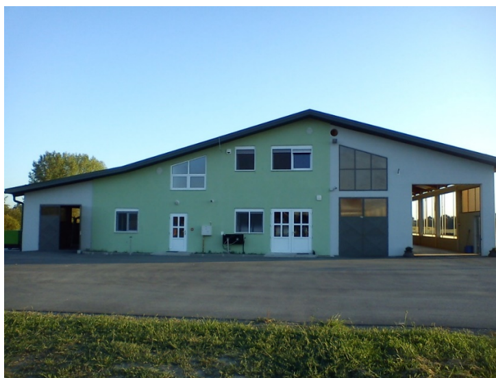
Slika 4: Staja za muzne krave na P.O. Kopecki

Od proizvodnih parametara kroz dvogodišnje razdoblje pratili smo broj goveda na gospodarstvu, količinu i kemijski sastav mlijeka, hranidbu mliječnih krava i zemljišne površine. Za procjenu hranidbene vrijednosti dopunske smjese i izračun hranidbenog obroka muznih krava korištene su tablice hranidbene vrijednosti krmiva i tablice hranidbenih preporuka potreba preživača prema Marenčiću (2012).