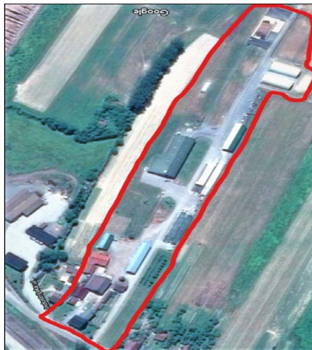
Slika 5: Satelitska snimka PO Kopecki

Poljoprivredni obrt Kopecki nalazi se na granici Sisačko-moslavačke županije u zapadnoj Slavoniji u mjestu Lipovljani. Obitelj čini tri generacije članova, i to: dva umirovljenika, dvoje stalno zaposlenih, jednoga studenta i jednog člana koji se sezonski zapošljava na gospodarstvu. Intenzivnija proizvodnja mlijeka i razvoj gospodarstva počeo je 1975. kada je izgrađena prva staja sa vezanim načinom držanja. Staja je tada imala 10 vezova za krave i 8 vezova za junice i telad. U početku gospodarstvo je obrađivalo oko 15 jutara zemlje za vlastitu potrebu, uzgajala se hrana za ishranu domaćih životinja. 1997. izgrađena je nova staja sa 24 veza i mljekovodom s 3 muzne jedinice. 2000. godine na gospodarstvu je ukupno bilo 24 krave s podmlatkom. Sljedećih osam godina godišnje je povećavan broj za po dvije krave. 2009. godine na gospodarstvu je bilo 40 muznih krava nakon čega je odlučeno da se kreće u gradnju nove staje. Nova staja sagrađena je slijedeće 2010. sa slobodnim načinom držanja sa 80 liege boksova, s rešetkastim podom, lagunom (1000 m 3 ) ispod staje i tandem izmuzištem sa 8 muznih mjesta. Izmuzište je opremila firma Westfalia GEA Farm Technologies. Svako muzno mjesto opremljeno je sa: metatronom 21, muznim jedinicama IQ, te PosiCare rukama za izmuzivanje.