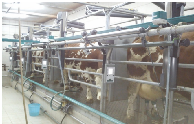
Slika 6: Prikaz izmuzišta na mliječnoj farmi