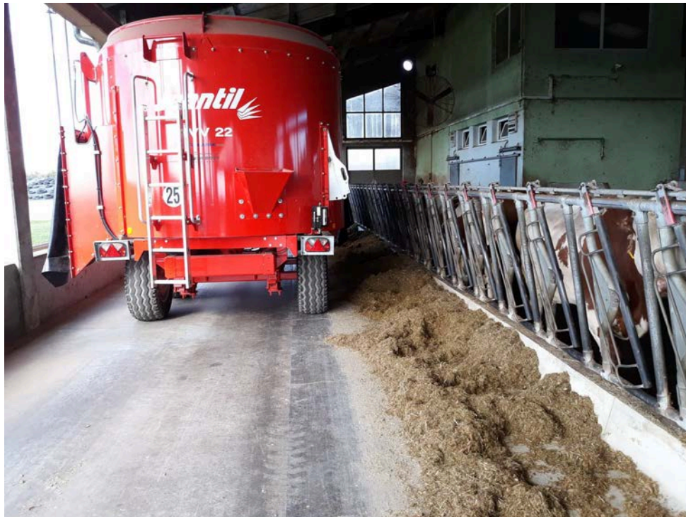
Slika 7. Hranidba krava mikser prikolicom