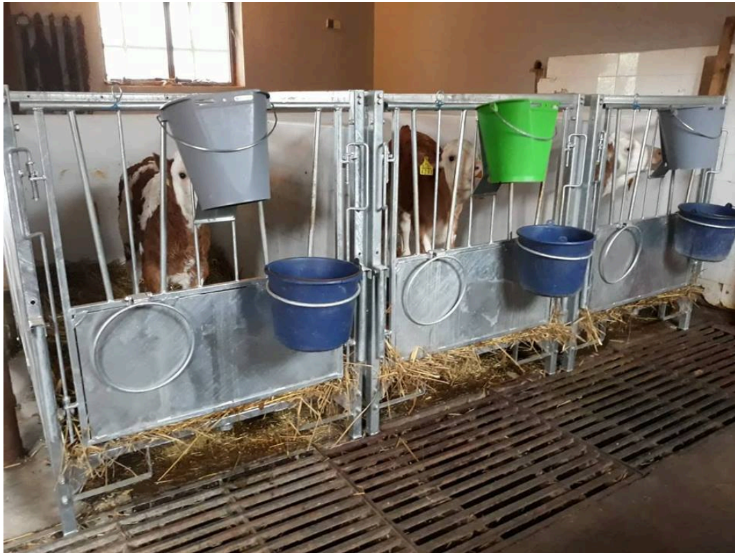
Slika 8. Boksevi za smještaj i hranidbu teladi