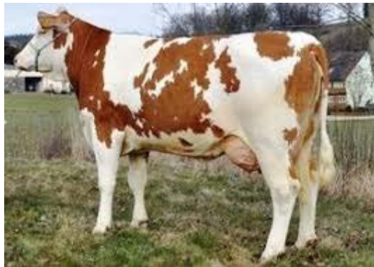
Slika 1. Krava simentalске pasmine

Simentalska pasmina je najbrojnija pasmina goveda u Republici Hrvatskoj. S obzirom na svoje anatomske, fiziološke i proizvodne karakteristike zastupljena je uglavnom na manjim i srednjim obiteljskim gospodarstvima. Veći dio njih su mješovita stada, gdje se skupa sa simentalским kravama drže krave drugih pasmina. Uz dobra proizvodna svojstva, zdravlje, dugovječnost, plodnost i funkcionalna vanjšina glavne su karakteristike simentalске pasmine u Hrvatskoj. Osnovne karakteristike simentalškog goveda je dlaka koja je svijetložute do crvene boje, po tijelu se nalaze bijele plohe različite veličine, dok su glava i rep bijele boje. Tjelesna masa krava kreće se 600-750 kg, visine u grebenu 136-140 cm (Caput, 1996).