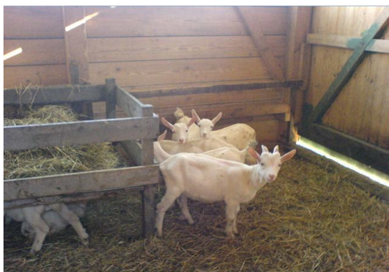
Slika 7.: Koze u staji OPG-a Žeger