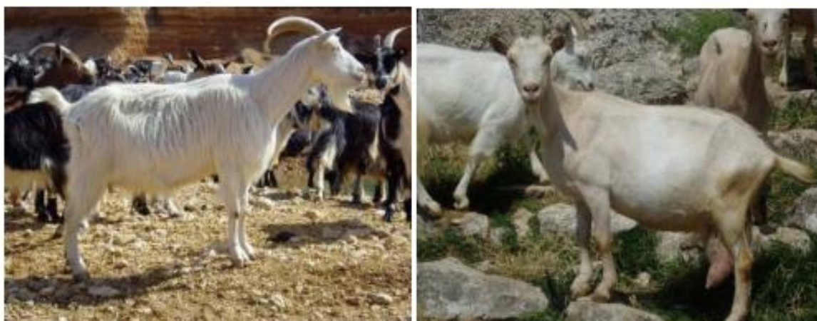
Slika 2.: Hrvatska bijela koza