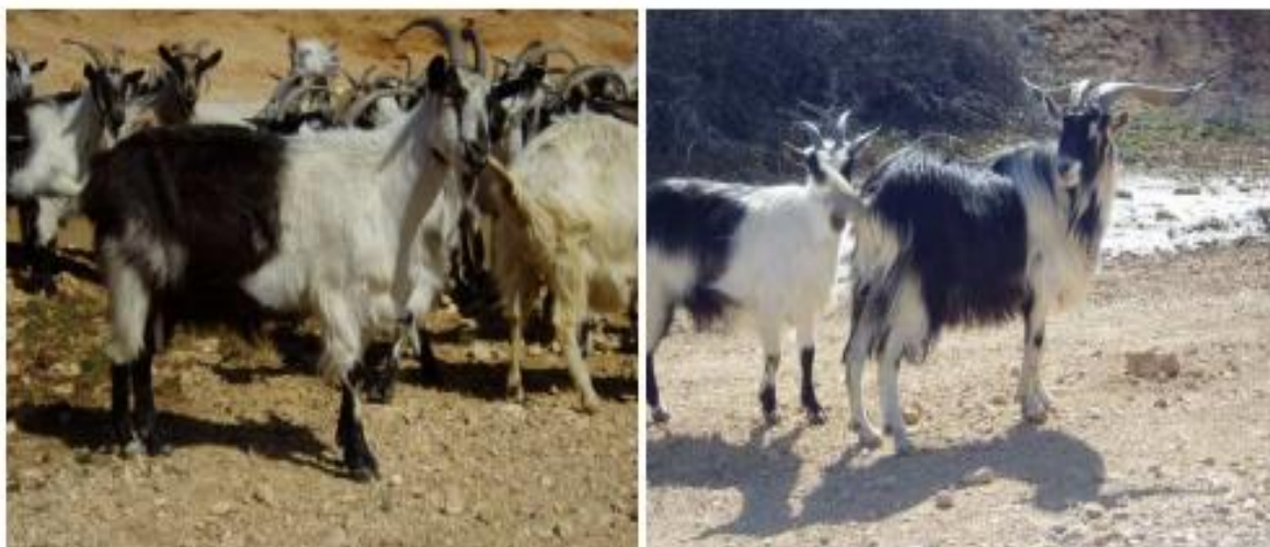
Slika 1.: Hrvatska šarena koza