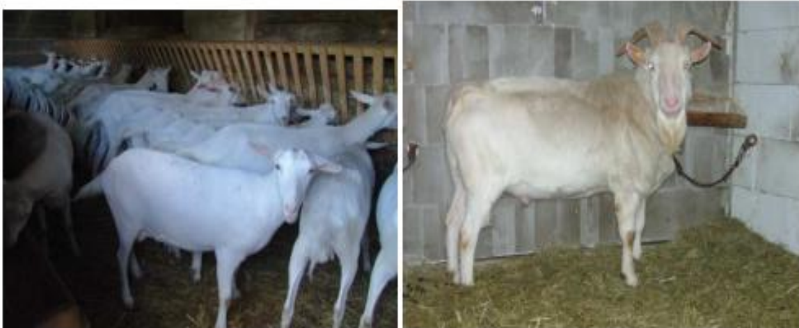
Slika 3.: Sanske koze i jarac

Izvor: http://www.hpa.hr/wp-content/uploads/2014/07/Program%20uzgoja%20koza%20u%20Republici%20Hrvatskoj.pdf