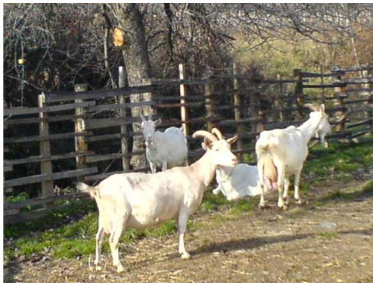
Slika 6.: Sanska koza na OPG-u Žeger