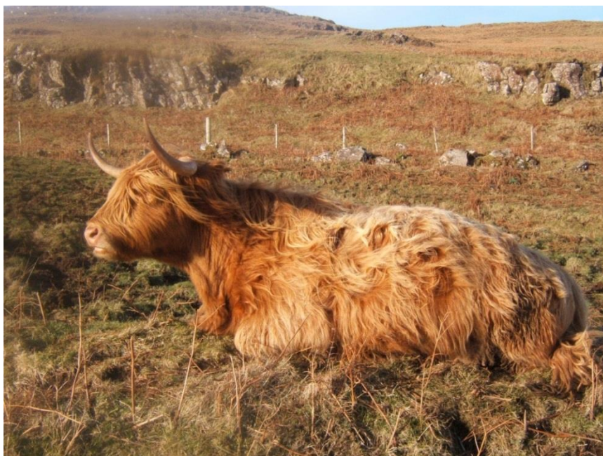
Slika 8. Škotsko visinsko govedo

Izvor: http://www.ludens.media/wp-content/uploads/2017/06/%C5%A0kotsko-govedo-1.jpg , (22.siječnja.2018.)