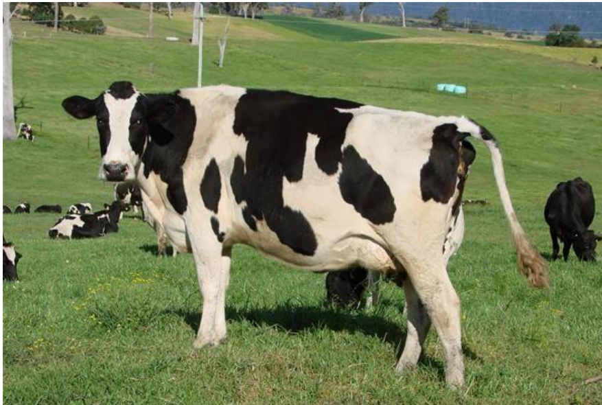
Slika 10. Krava holštajn pasmine

čistog mesa u trupu znatno slabiji nego u naših kombiniranih pasmina. Ranije je zrelo pa je dobna i težinska granica zamašćenja trupa ranija, nego npr. u simentalca (Caput, 1996.).