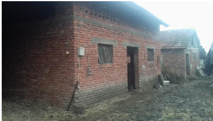
Slika 12. Staje za držanje krava i junica zimi

Staje za junad također imaju mjesta za vezove junadi i junad obitava na stelji koja se čisti jednom dnevno uz svakodnevno nastiranje baliranom slamom dobivenom od zobi i balirane kukuruzovine. Na gospodarstvu se nalaze dvije staje podjednake veličine u kojima se može vezati najviše do 5 junadi u završnom tovu. Staje nemaju pojilice pa se voda napušta u hranidbeni kopače poslije hranidbe. Hranidba junadi provodi se kao i kod krava u jaslama i kopaču, zbog starog načina gradnje staja.