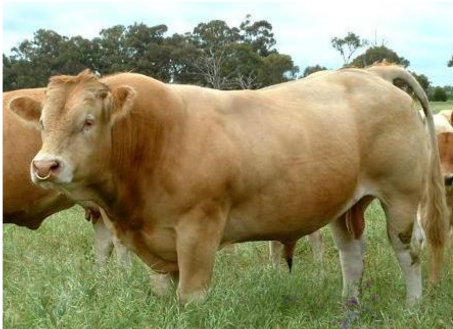
Slika 2. Bik blonde d' Aquitaine pasmine

pšenice, koja varira od svijetle do zagasite, često s bijelim i sivim pjegicama. Prosječna masa tijela bikova je 1000 do 1300 kg, a krave 700 do 850 kg. Bikovi u grebenu dosežu visinu do 150 cm, a krave su prosječne visine oko 145 cm. Porodna masa teladi je 43 do 47 kg, što djelom uvjetuje pojavu težih teljenja (do 5%). Mladi bikovi u tovu ostvaruju dobre dnevne priraste (1100 do 2000 g/dan), a iskoristivost trupa nerijetko prelazi i 72 % (Vujčić, 1991.).