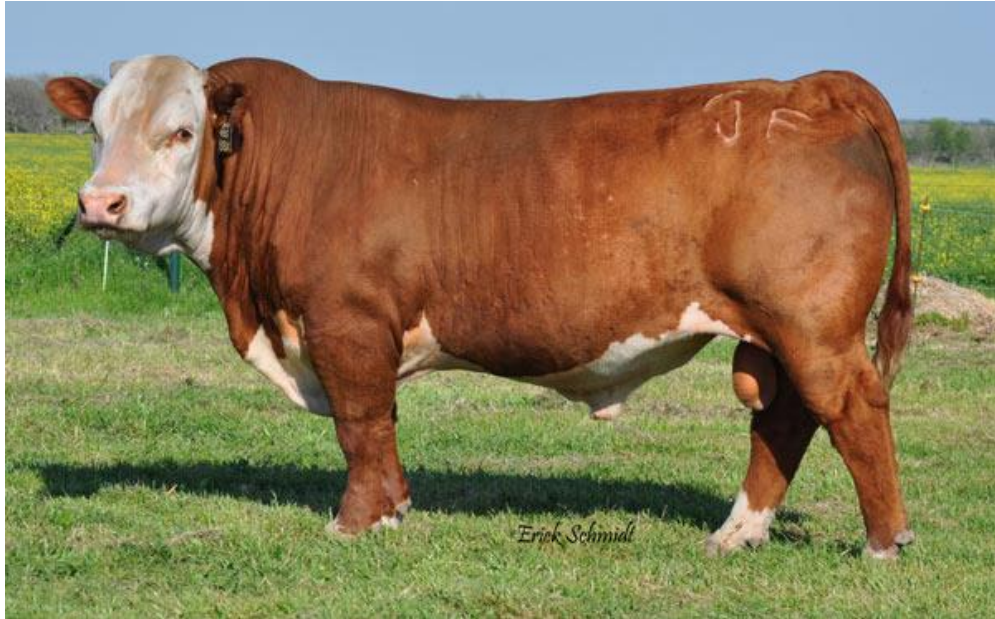
Slika 5. Bik hereford pasmine