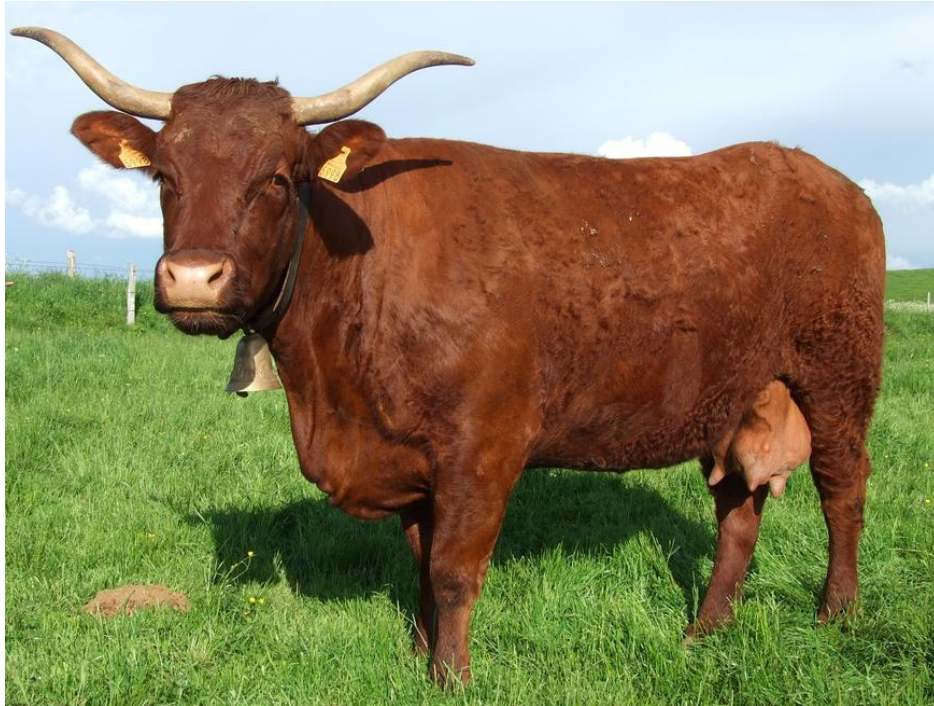
Slika 7. Krava salers pasmine