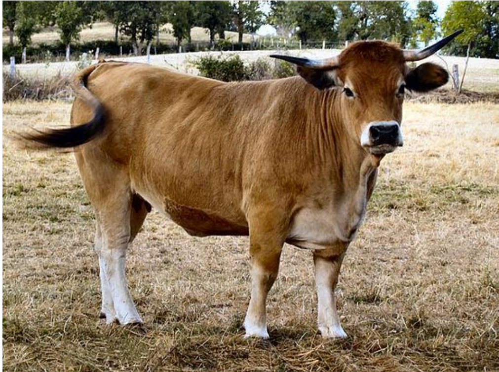
Slika 6. Krava aubrac pasmine