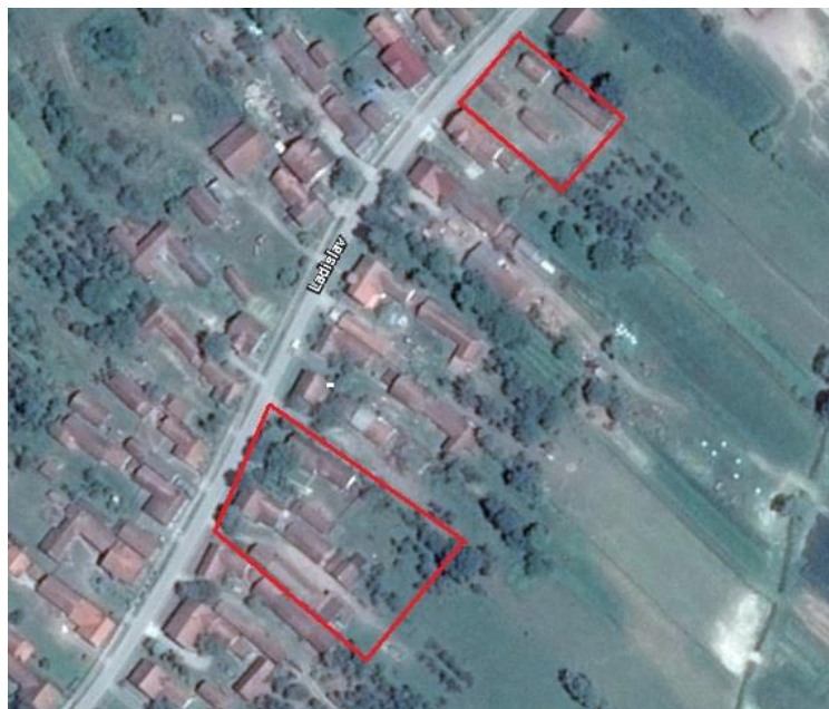
Slika 11. Imanja OPG-a Milan Jurčević

OPG Jurčević stvarano je dugi niz godina isključivo prihodima od poljoprivredne proizvodnje. Tako da je 2017. gospodarstvo Jurčević raspolagalo sa 27 grla goveda: 18 krava i 9 junica. Za proizvodnju voluminozne krme i žitarica koje se uglavnom sve koriste u hranidbi goveda, gospodarstvo je obrađivalo oko 21 ha poljoprivrednih površina od čega je 18 ha vlastitog poljoprivrednog zemljišta, a 3 ha u zakupu. Od ukupno raspoloživog zemljišta 9 ha otpadalo je na pašnjake koji su bili podijeljeni na 4 pregonska pašnjaka. Voda je osigurana iz prirodnih izvora na samim pašnjacima, dok u ljetnom dijelu godine kada izvori presuše stoka se napajala iz vlastitog zdenca ili se dovozila iz obližnjeg hidranta. Gospodarstvo je od postojećih gospodarskih objekata posjedovalo: 2 štale za tov junadi, 2 staje za prezimljavanje krava, garaže za poljoprivredne strojeve, sjenike za skladištenje suhe voluminozne hrane i silos za kukuruznu silažu. Gospodarstvo je pored gospodarskih objekata posjedovalo i mehanizaciju za obradu i sjetvu poljoprivrednih površina. Sva mehanizacija je bila nabavljena rabljena te je kupljena vlastitim novčanim sredstvima.