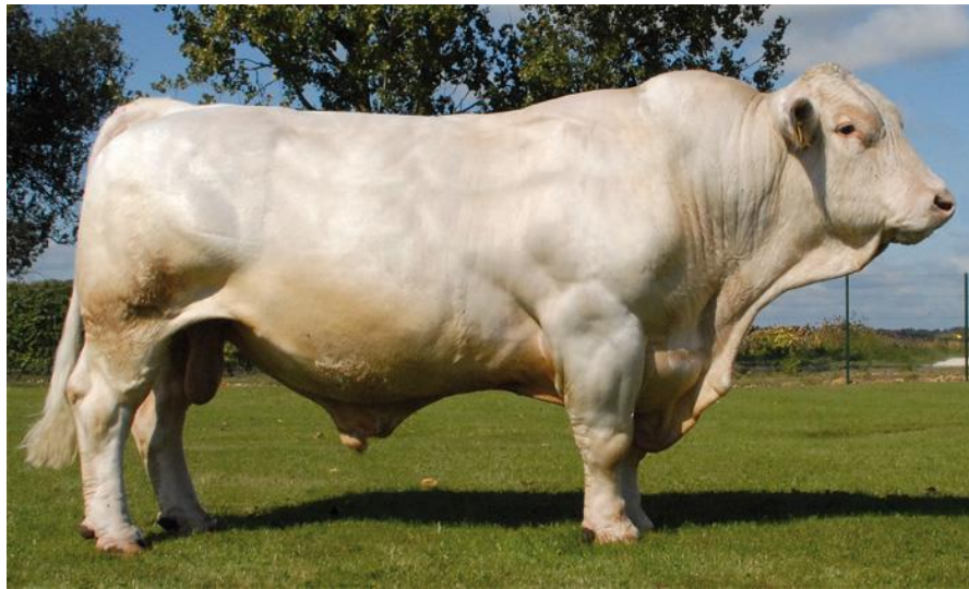
Slika 1. Bik charolais pasmine

Najznačajnija je tovna pasmina u Francuskoj. Danas je proširena po cijelom svijetu. Charolais goveda imaju dlaku bijele ili krem boje, velikih su dimenzija i dobrih tovnih značajki. Prosječna masa tijela krave je od 700 do 900 kg, a bikova 1000 do 1400 kg. Visina grebena krava je 135 do 140 cm, a bikova 142 do 148 cm. Junad u tovu do 18 mjeseci i završne težine oko 600 kg postiže dobre priraste od 1100 do 1200 g. U tovu može jesti više suhe tvari iz voluminozne krme i koncentrate nego druge mesne pasmine. Randman toplih polovica je oko 68 (Katalinić, 1994.)