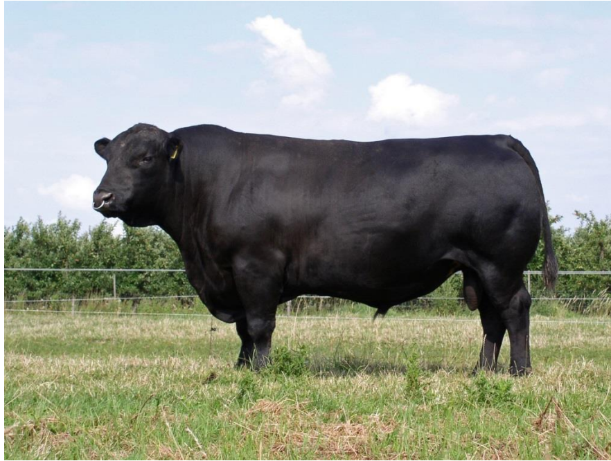
Slika 4. Bik angus pasmine