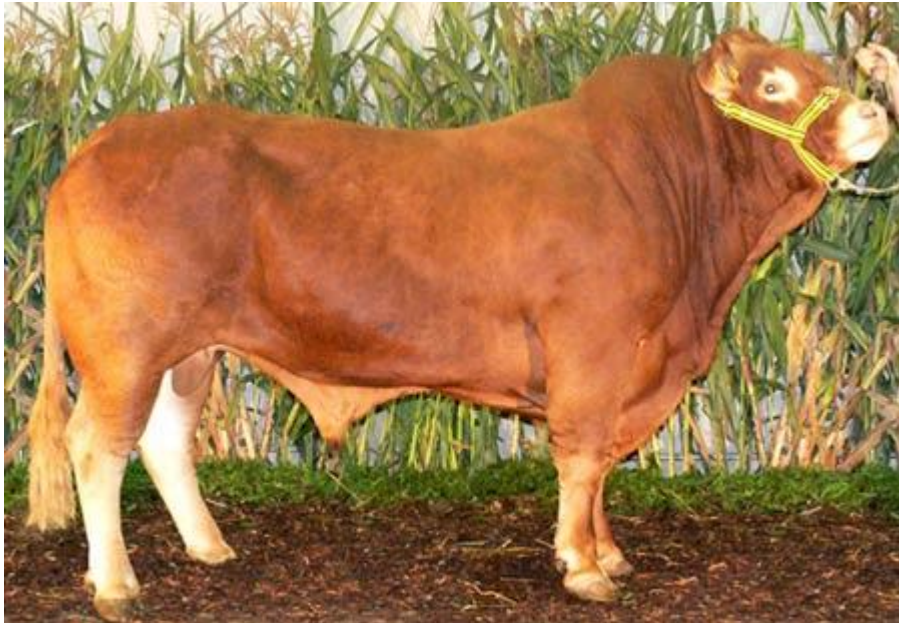
Slika 3. Bik limousin pasmine

teljenja uvjetovana je manjom porodnom masom teladi (35 do 40 kg), zbog čega je limuzin pasmina pogodna za uporabna križanja s drugim pasminama goveda (Vujčić, 1991.).