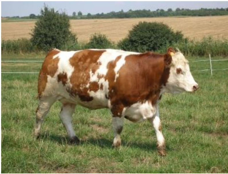
Slika 9. Krava simentalске pasmine

dijela. Potpuno uzrasli bikovi dosežu do 1.250 kg, a odrasle krave su prosječne tjelesne mase 600 do 750 kg. Bikovi su prosječne visine 145 do 155 cm, a krave oko 140 cm. Prosječna porodna masa teladi je 38 do 43 kg, što osigurava laka teljenja. unad u tovu postižu dobre dnevne priraste 1.100 do 1.250 g/dan, ima poželjnu konformaciju trupa i visoku iskoristivost trupa (randman 62 do 67%) (Ivanković, 2015.).