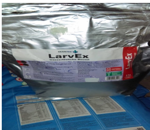
Slika 13. LarvEx sredstvo za suzbijanje muha

Sredstva koja se koriste u dezinfekciji i dezinsekciji farme prikazuju slike 13 do 16.