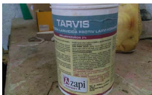
Slika 15. Tarvis (sredstvo za suzbijanje komaraca)