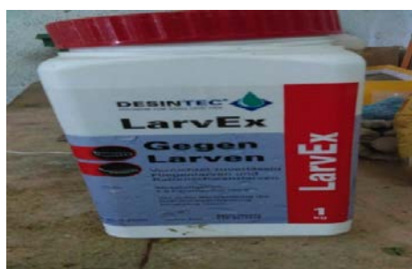
Slika 16. LarvEx Gegen Larven (Sredstvo za suzbijanje pojave ličinki)