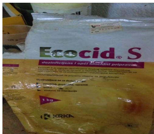
Slika 14. Ecocid®S (vodo-topivi prašak za pripremu otopine za dezinfekciju