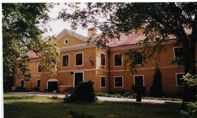
Slika 9. Dvorac Maksimilijana Vrhovca