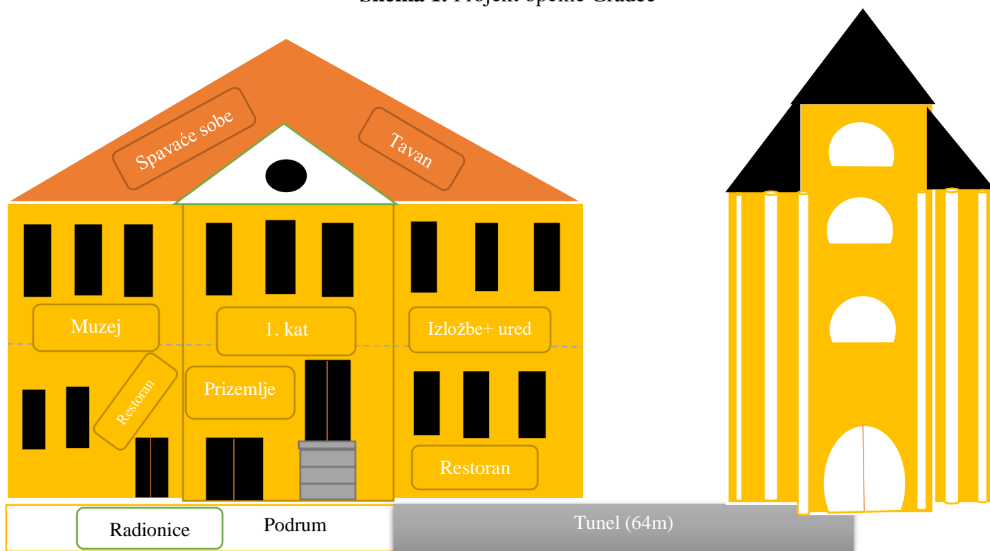
Shema 1. Projekt općine Gradec