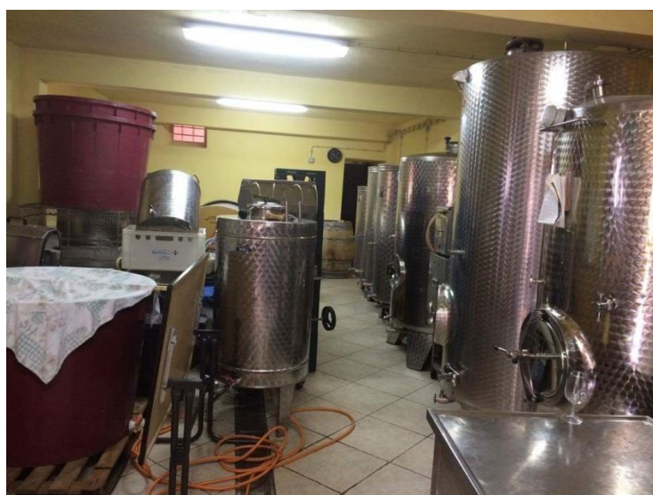
Slika 8: Vinski podrum