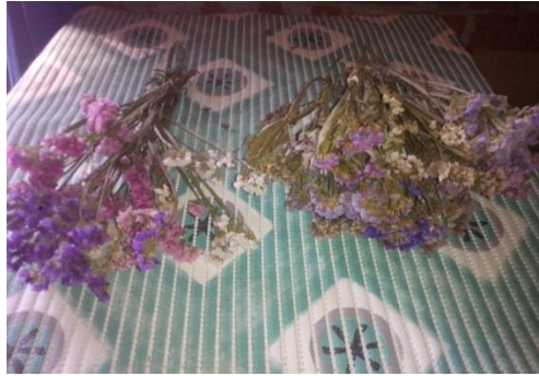
Slika 23. Primjer osušenih statica ( Limonium sinuatum ) u fazi rascvalog cvijeta (na slici lijevo) i u fazi rascvalog cvijeta koji su duže ostali na gredici (desno na slici)