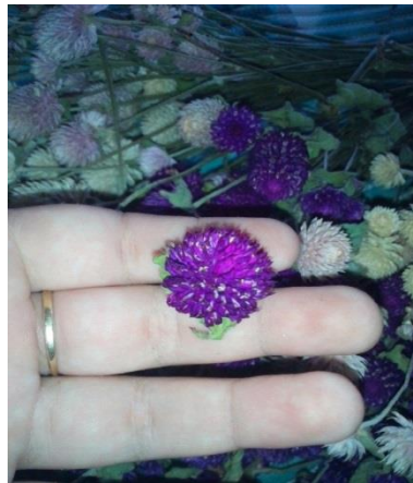
Slika 24. Osušeni cvat netreska ( Gomphrena globosa )

Najbolje vrijeme za branje u svrhu sušenja kod vrste Gomphrena globosa (netresak) je kada se formira cvat u obliku loptice (slika 24.). Ako se cvat izduži i poprimi duguljasti oblik i smeđu boju nakon sušenja gotovo cijeli posmeđi i nema tako jarku boju (slika 25.).