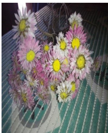
Slika 22. Primjer osušenog ružičastog slamnatog cvijeta ( Helipterum roseum )