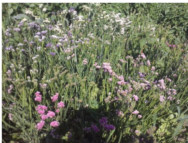
Slika 4. Statice ( Limonium sinuatum ) u cvatnji

Limonium sinuatum (statica) ubraja se u porodicu Plumbaginaceae (porodica vranjemila) (McDonald, 1995.). Potječe iz Mediterana, trajnica je koja se uzgaja kao jednoljetnica (Auguštin, 2003.). Naraste od 30 do 90 centimetara, razgranata je i raste uspravno. Cvjetići su zbijeni u guste cvatove boje lavande, žute, kremaste, blago ružičaste do tamno ružičaste, tamno plave, boja breskve, marelice, često su i dvobojni. Cvate od srpnja do rujna (McDonald, 1995.). Za sušenje se bere kada cvjetovi pod opipom šušte, zavežu se u bukete i objese prema dolje u tamnu, suhu i prozračnu prostoriju. Koriste se u aranžmanima, buketama, vazama, te kao ukras na gredicama.