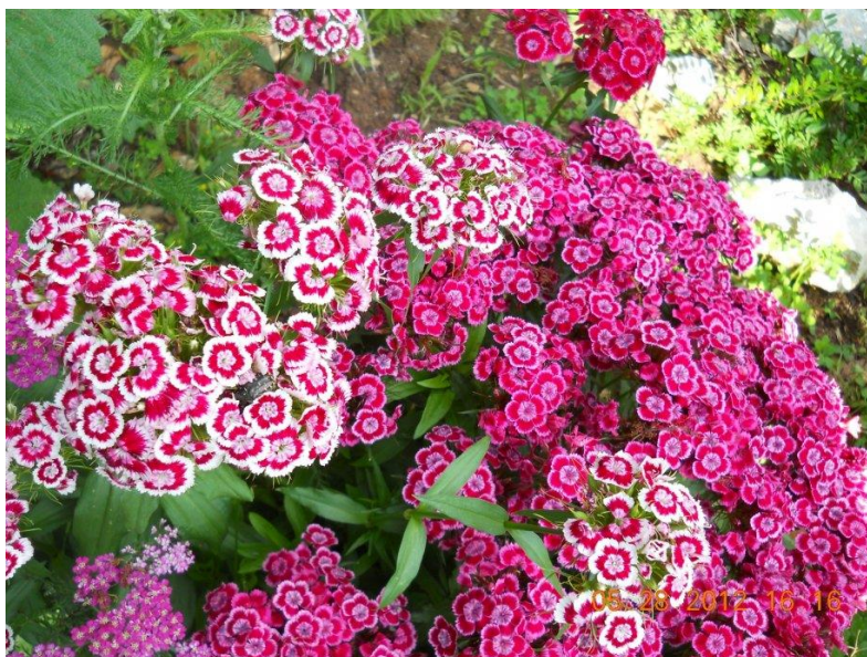
Slika 9. Turski karanfil ( Dianthus barbatus )