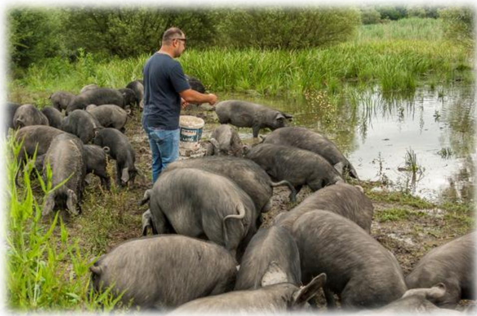
Slika 4. Ekstenzivna proizvodnja crne slavonske svinje

Uzgoj crne slavonske svinje ima niz prednosti u odnosu na konvencionalnu svinjogojsku proizvodnju temeljenu na visoko-proizvodnim pasminama. Troškovi smještaja i hranidbe su nekoliko desetaka puta niži, a tehnologija držanja je jednostavnija. Ovakav način držanja zadovoljava kriterije dobrobiti i zdravlja svinja, te ima pozitivan učinak na okoliš i razvoj ruralnih područja. Na temelju ovih činjenica moguće je ostvariti značajnu financijsku korist kroz sustav potpora koji ne postoji u intenzivnom svinjogojstvu. Da bi se ostvarila „ozbiljna“ i organizirana proizvodnja potrebno je povećati broj krmača crne slavonske svinje te provesti uzgojno-seleksijske zahvate u svrhu oplemenjivanja i unapređivanja njenih proizvodnih i reproduktivnih svojstava. Pri tome treba voditi računa da se ne naruše njena morfološka i fiziološka svojstva (izgled, boja, kvaliteta mišićnog i masnog tkiva) (Margeta, 2013).