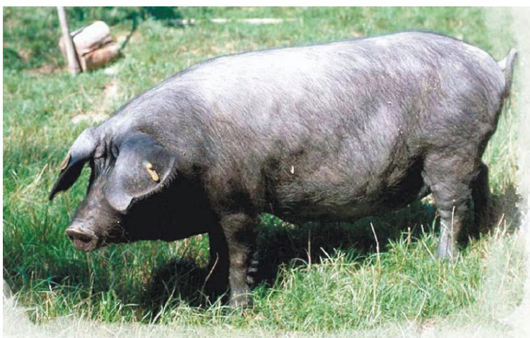
Slika 1: Crna slavonska svinja

Crna slavonska svinja uzgajala se u slobodnom držanju što podrazumijeva da životinja veći dio vremena provodi na otvorenom krećući se po pašnjacima, livadama ili šumama gdje nalazi dio potrebne hrane. Samo u nepovoljnim uvjetima, u vrijeme prašenja i u vrijeme tova zatvarane su u za to pripremljene objekte. Crna slavonska svinja pripada u srednje velike pasmine svinja (60 – 75 cm visina do grebena). Glava je srednje duga, suha s ugnutim profilom, uši su srednje veličine i poluklopave. Vrat je srednje dug, dosta širok i dobre muskulature. Trup je dosta kratak s dubokim i širokim grudnim košem. Sapi su srednje široke i neznatno oborene. Šunke su srednje obrasle mišićjem. Noge su relativno kratke i tanke. Koža je pepeljaste boje, obrasla crnom srednje dugom i rijetkom ravnom čekinjom. Rilo i papci su crne boje.