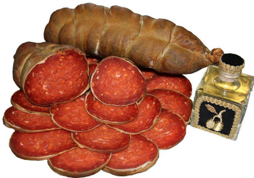
Slika 3. Slavonski kulen/kulin

puta godišnje. Meso crne slavonske svinje je zadovoljavajuće kakvoće, a boja mesa je svjetloružičasta. S obzirom na to da meso ima dobru sposobnost vezanja vode, pogodno je za preradu u trajne proizvode (Karolyi i sur., 2010). Kakvoća prerađevina ovisi i o sastavu masnih kiselina u intramuskularnoj masti koji je bolji kod crne slavonske pasmine u odnosu na plemenite pasmine svinja (Uremović, 2004).