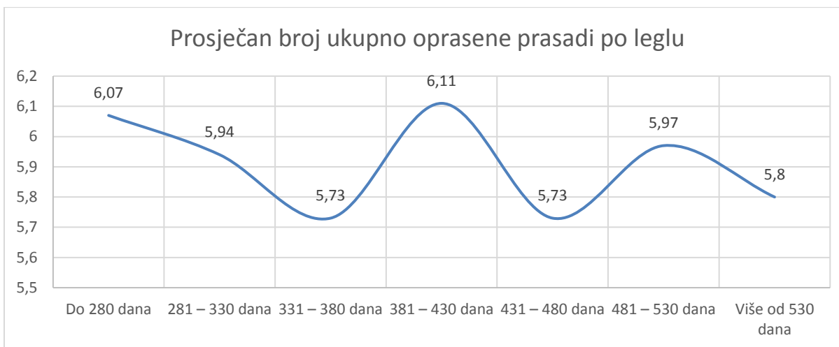
Graf 2. Prosječan broj ukupno oprasene prasadi po leglu