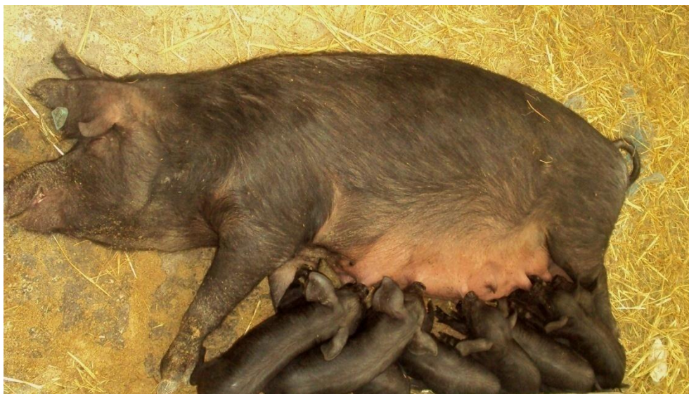
Slika 2: Crna slavonska svinja s praščićima