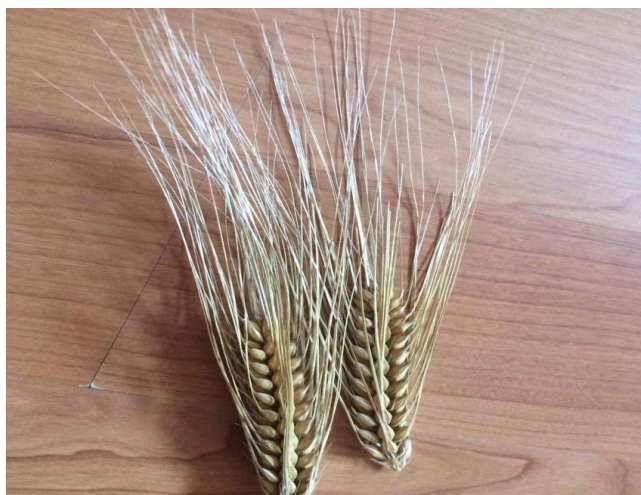
Slika 9. Klasovi čtetverorednog ječma