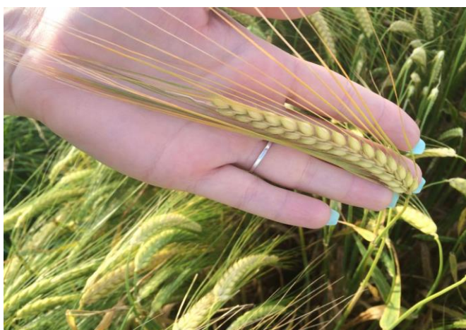
Slika 10. Klas dvorednog ječma