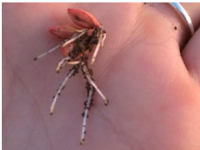
Slika 3. Korjenčić ječma, 29. 10. 2015.