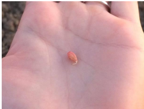
Slika 2. Klijanje ječma, 24.10.2015.