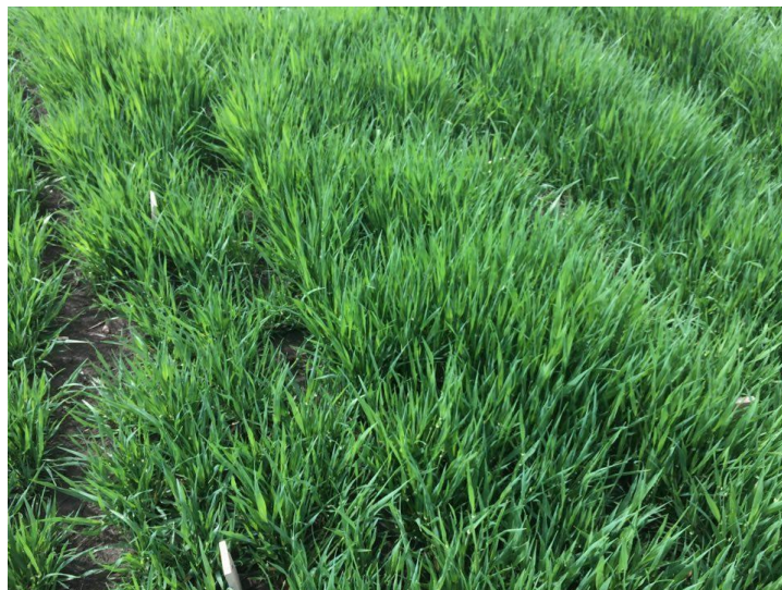
Slika 5. Ječam u fazi busanja, 05.12.2015.