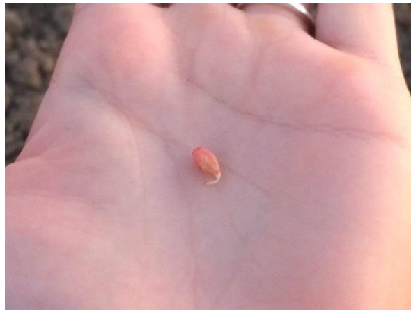
Slika 2. Klijanje ječma, 24.10.2015.