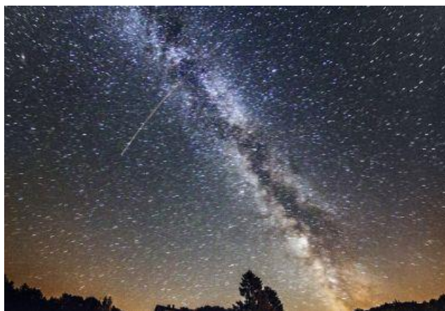
Slika 5. 10 dana astronomije u Daruvaru

drugih. Za najmlađe astrofile održan je astronomski vrtić. U osnovnim su školama učenici promatrali Sunce teleskopom i prisustvovali raznim radionicama i predavanjima, a srednjoškolci su širiti svoje astronomske vidike na Inspiring Science Education radionici.