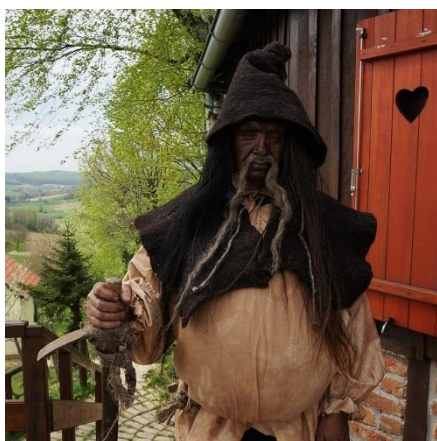
Slika 22. Skriveno blago veda

Vedi (slika 22) su prema pripovijedanju bila bića neobične visine i snage - viša od kuća, sva dlakava u oskudnoj odjeći i poderanoj - odrpanoj odjeći. Govorilo se o onome koji je imao poderanu i neurednu odjeću: „ Kak je zdrapan kak ved “. Vedi su živjeli u brdima dubokih Bilogorskih šuma, tu su imali svoje gradove i groblja. Bilo je muških i ženskih Veda . Vedi su dolazili u selo i pomagali ljudima u teškim poslovima, ali su ih znali i mučiti i odvoditi u svoje gradove kao sluge. Priča se kako je nekad svaka kuća imala svoju Ved ili svoga Veda . Oni su rado pomagali u poljskim i kućnim poslovima, a domaćini bi im davali za uzvrat hranu i odjeću. Bilo je dobrih i zli Veda . Još žive sjećanja kako su se ljudi i u Crkvi molili za pomoć svojih Veda , ali i da im tuđi Vedi ne naude.