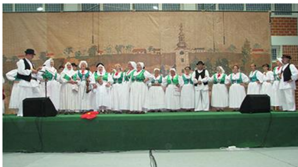
Slika 13. Proljeće u Velikom Trojstvu