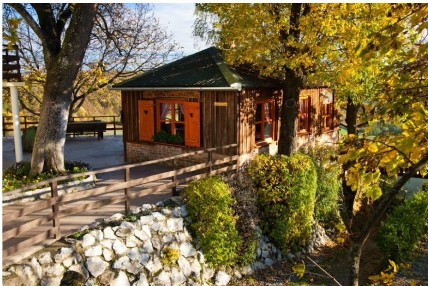
Slika 2. Na brijegu, pod starom kruškom