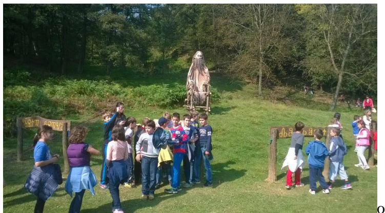
Slika 21. Skriveno blago Veda