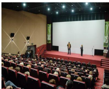
Slika 8.. Kino dvorana Kulturnog i multimedijskog centra Bjelovar.

DOKUart-Međunarodni festival dokumentarnog filma je međunarodni festival dokumentarnog filma u Bjelovaru. Prilika je to sudjelovati i upoznati se s najnovijim dostignućima s područja dokumentarnog filma u zemlji i svijetu i susresti se sa najvažnijim akterima ove umjetnosti. Kroz cijeli tjedan prikazivanja filmova povezani smo sa najnovijim događanjima sa znanjima i filmskom tehnologijom. Organizator ove vrijedne manifestacije je Udruga za promicanje kulture DOKUart, a festival se održava uz pokroviteljstvo Grada Bjelovara i Hrvatskog audiovizualnog centra, te uz podršku Hrvatskog filmskog saveza. Festival prate Gradski muzej i Narodna knjižnica Petra Preradovića. Glavne projekcije održavaju se u kino dvorani Kulturnog i multimedijskog centra u Bjelovaru (slika 8). Posebna atrakcija su projekcije u DOKUbusu: malom kinu (slika 9) u odabranim alternativnim prostorima i seoskim sredinama. Sastavni dio festivala je i Mali DOKUart koji već devetu godinu nagrađuje dokumentarne filmove osnovnoškolaca, DOKUradionica za osnovnoškolce s uglednim predavačima i projekcija za osnovce i srednjoškolce.