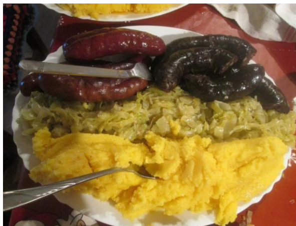
Slika 19. Kravice sa zeljem