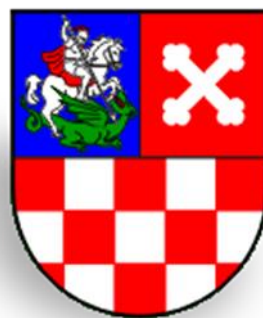
Slika 2. Grb Bjelovarsko-bilogorske županije