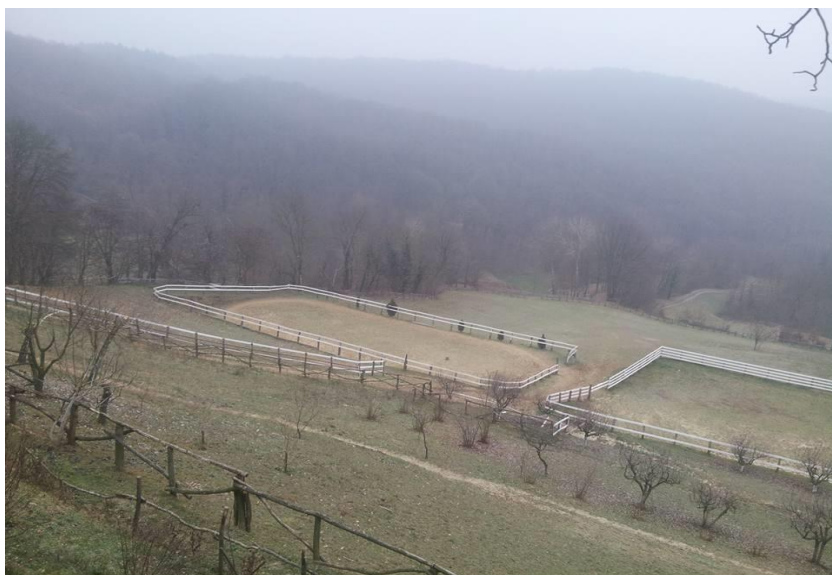
Slika 6. Pogled sa brijega