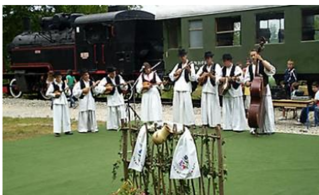
Slika 12. Lovrakovi dani kulture u Velikom Grđevcu