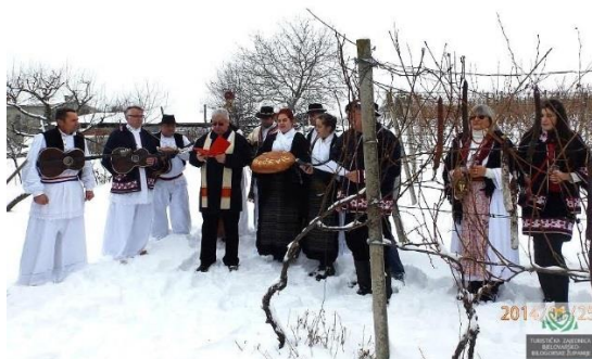
Slika 4. Vincekovo-Vinogradarski blagdan posvećivanja trsja i vinograda

Vincekovo (slika 4) je vinogradarski blagdan posvećivanja trsja i vinograda nazvan po najpoznatijem nebeskom zaštitniku vinogradara i vina sv.Vinku (lat. vincens: onaj koji pobjeđuje). Njegov blagdan 22. siječnja, spada u vrijeme početka prvih radova u vinogradu. Vinogradari će obvezatno obići vinograde i blagosloviti ih molitvom i vinom. Za rodnost loze Bilogorci će na trsove objesiti kobasice i špek i odrezati tri loze. One će na toplom pokazati rodnost vinograda nove gospodarske godine. Svečanu i veselu prvu rezidbu Bilogorci obavljaju u svojim vinogradima i klijetima.