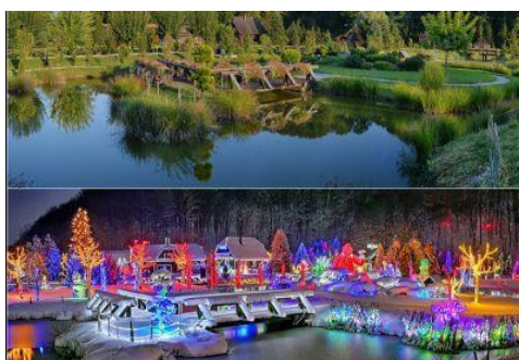
Slika 11. Božićna priča Čazme u Grabovnici