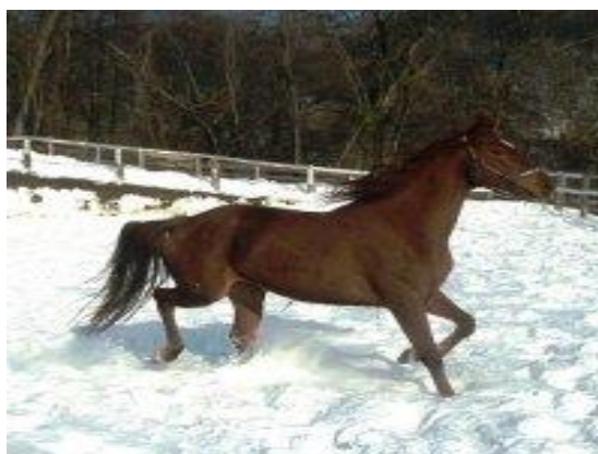
Slika 20. Konji