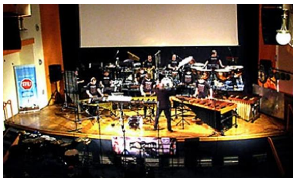
Slika 3. IPEW - Međunarodni tjedan udaraljkaša

IPEW - Međunarodni tjedan udaraljkaša (slika 3) ugošćuje najznačajnija imena svjetske i hrvatske udaraljkaše glazbe.