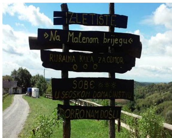
Slika 8. Natpis na gospodarstvu obitelji „Vlajinić“