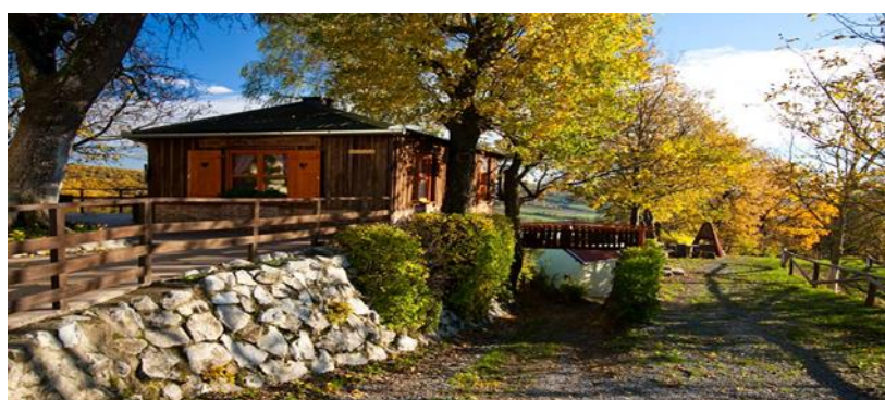
Slika 10. Mala sala izvana