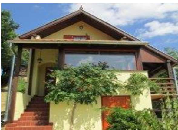
Slika 18. Bakina vikendica

Domaćini Malenog brijega svojim gostima nude smještaj u obnovljenoj Bakinoj vikendici (slika 18) koju sada krasi i istočna terasa na kojoj posjetitelji mogu provoditi sunčane dane i uživati u svježem zraku u svako godišnje doba. Ruralna kućica za odmor pruža svojim gostima potpuni komfor. Ima kuhinju, kupaonicu, dva kreveta i dva pomoćna kreveta u potkrovlju, dvije terase te ostakljeni dnevni boravak iz kojeg se pruža predivan pogled bez obzira na godišnje doba. Poseban je ugođaj za vrijeme zimskih dana. Kućica je opremljena drvenim namještajem i podovima koji daju pravi ruralni ambijent. Objekt je kategoriziran s tri sunca ***.