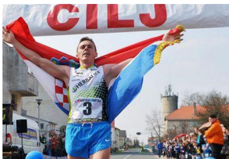
Slika 6. Supermaraton Zagreb-Čazma-Utrka „Od Kaptola do Kaptola“

Supermaraton Zagreb-Čazma-Utrka „Od Kaptola do Kaptola“ (slika 6) je sportska manifestacija koja obuhvaća sljedeće sportske manifestacije: start Supermaraton (Trg bana Josipa Jelačića, Zagreb) i slijedi stari Kolomanov put do Čazme, planinarski pohod „Oko Čazmanskog kaptola“, atletska natjecanja i zabavne igre za djecu i učenike, prezentacije i probne vožnje automobila, old-timere različitih marki i demonstracija snage (vuča automobila ljudskom snagom). Vrhunac događanja je doček maratonaca uz Puhački orkestar Čazma i degustacija lovačkih gulaša iz kotlića i vina „Čazmanskog Vinokapa“. Završetak manifestacije označava Moto-alka, trening i natjecanje uz proglašenje pobjednika.