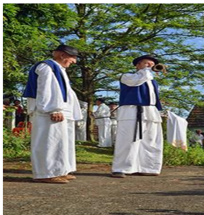
Slika 14. Zapovijed pod lipom

Zapovijed pod lipom (slika 14) starinski običaj čitanja i dijeljenja pošte pod starom lipom ispred crkve nakon nedjeljne mise našlo je novi način oživljavanja običaja od starine, kada je seoski poštar čitao i dijelio pristiglu poštu. Ovakva događanja povezuju prošlost i sadašnjost i poučavaju na zanimljiv i šaljiv način mlade i goste kako se nekada živjelo, kakvi su bili odnosi u obitelji i selima, kako je seljak živio, plaćao poreze, išao na vojne... U manifestaciji sudjeluju svi mještani Gornjeg i Donjeg Miklouša i brojni pozvani gosti, folklorashi i prijatelji, koji svečano ukrašenim selom prolaze u svečanoj povorci od seoskog doma do crkve i natrag.