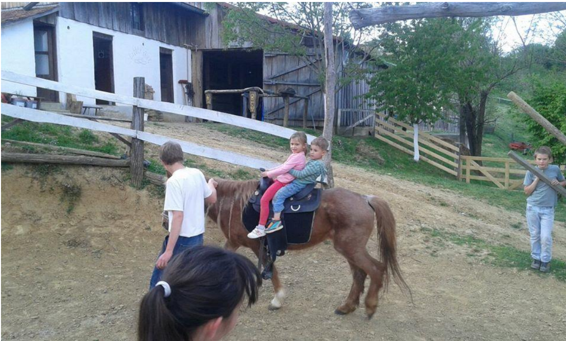
Slika 7. Pripreme za jahanje