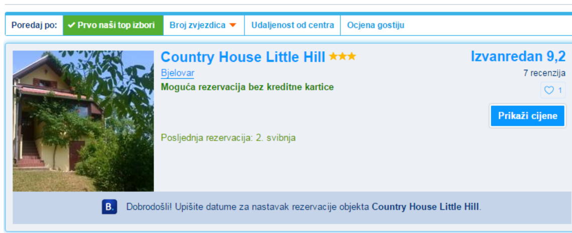
Slika 23. Ocjene recenzije gostiju

Prema vlastitim mogućnostima izdvajanja financijskih sredstava izletište koristi uglavnom klasične promocijske instrumente: oglašavanje, osobnu prodaju, direktni marketing, unapređenje prodaje suradnjom sa kompetentnim kadrovima i edukacijama na temu jačanja turističkih kapaciteta i trendova, te suradnju s medijima, no pretežito lokalnim i regionalnim.