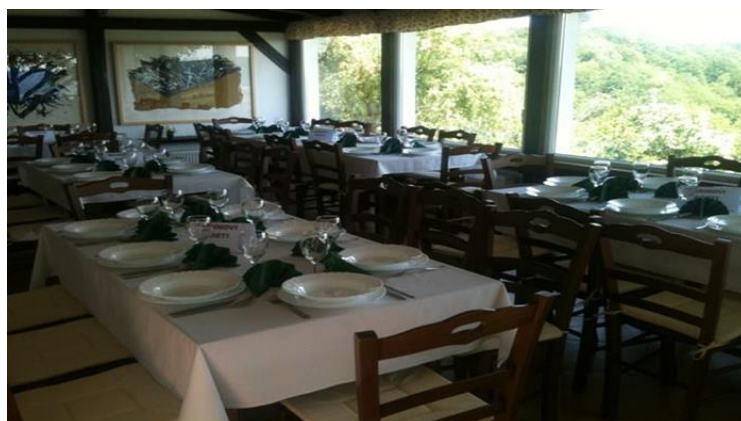
Slika 9. Velika sala za primanje gostiju