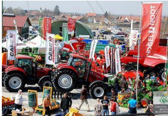
Slika 10. Međunarodni sajam u Gudovcu

Međunarodni pčelarski sajam, Izložba vina i vinogradske opreme u Gudovcu. Ove su priredbe postale veoma zapažene u zemlji i svijetu. Pokazale su potpunu svrhovitost održavanja na ovom mjestu, prostoru, vremenu i od davnina jakom i važnom stočarskom i poljoprivrednom kraju. Sajam ima prodajnu i izložbenu namjenu.