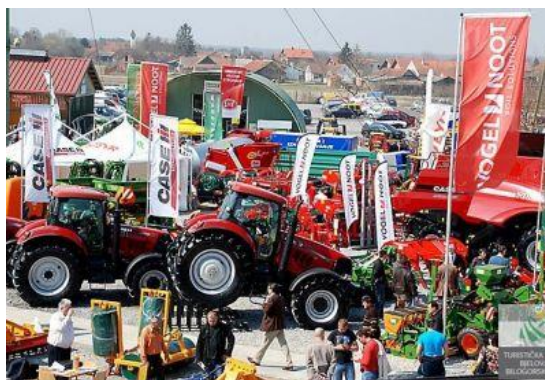
Slika 10. Međunarodni sajam u Gudovcu

Međunarodni pčelarski sajam, Izložba vina i vinogradske opreme u Gudovcu. Ove su priredbe postale veoma zapažene u zemlji i svijetu. Pokazale su potpunu svrhovitost održavanja na ovom mjestu, prostoru, vremenu i od davnina jakom i važnom stočarskom i poljoprivrednom kraju. Sajam ima prodajnu i izložbenu namjenu.