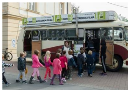
Slika 9. DOKUbus