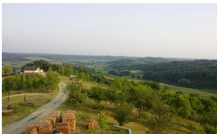
Slika 16. Izletišta „Na malenom brijegu“

ekološkoj proizvodnji poljoprivrednih i prehrambenih proizvoda 2006. godine pod brojem 333 te temeljem zakonskih odredbi ima pravo koristiti eko znak, ali obitelj Vljajinić je izašla iz ekološke proizvodnje 2016. godine. Matični broj poljoprivrednika je 50287931. Jedinstveni identifikacijski broj gospodarstva je HR 30065323. Gospodarstvo je upisano u Vinski registar 2011. godine. Turističkom djelatnosti izletišta se bavi od 2010. godine. Registrirani su kao izletišta kapaciteta do 80 osoba istovremeno, te od 2012. imaju registriranu ruralnu kuću za odmor kapaciteta dva kreveta + dva pomoćna. Obitelj Vljajinić broji sedam članova u četiri generacije. Gospodarstvo je jedna od destinacija Pisaničke eko etno staze.