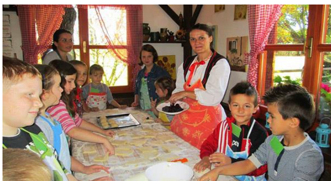
Slika 8. Aktivnosti djece na izletu