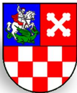
Slika 2. Grb Bjelovarsko-bilogorske županije