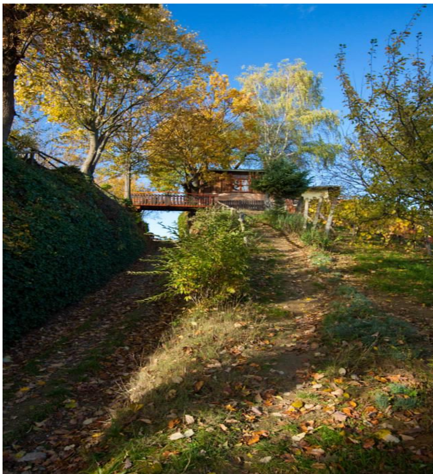
Slika 3. Puteljkom na brijeg