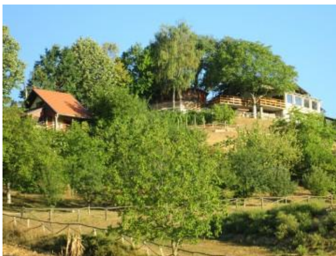
Slika 15: Pogled na Maleni brijeg s istočne strane;

U općini Velika Pisanica nalazi se naselje Ribnjačka. Iznad sela je maleni brijeg, visoravan koja počinje iz Podravine i pretače se k jugu u seosku padinu Ribnjačke. Najljepši dio toga brijega je izletište „Na malenom brijegu“.