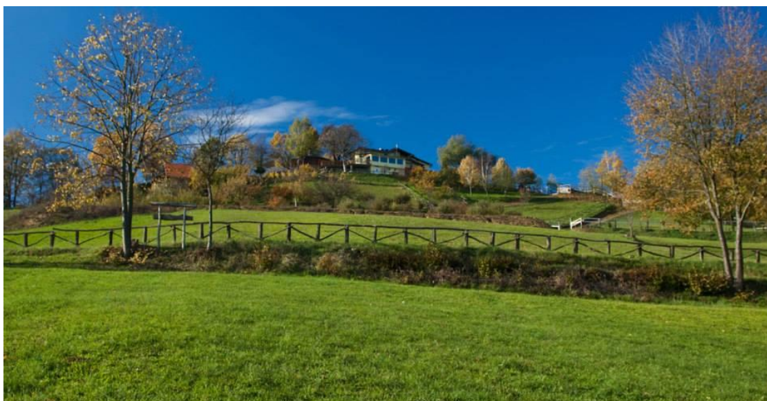
Slika 4. Pogled s istoka