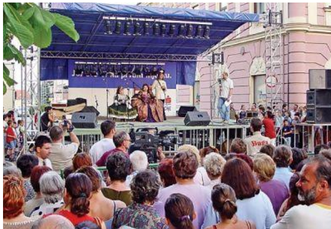
Slika 7. Bjelovarska nedjelja uz caricu

Bjelovarska nedjelja uz caricu ili Terezijana (slika 7) je turistička, kulturna i zabavna priredba grada Bjelovara koju je pokrenula i koju od 1996. godine organizira Turistička zajednica grada Bjelovara, odnedavno Turistička zajednica Bilogora-Bjelovar. Povod za organiziranje priredbe pod ovim nazivom je odluka austrijske carice i hrvatske kraljice Marije Terezije iz 1756. godine, koja je nakon Severinske bune odlučila tu postaviti čvrsto vojničko uporište: Novi Varaždin. Godina je to planske izgradnje današnjeg Bjelovara, koji uz vojni postaje kulturni, obrtnički, prometni i gospodarski centar područja i cijele Vojne Krajine-Granice. Iako vladarica sama nikada nije boravila u Bjelovaru, preko svojih vojnih zapovjednika je imala potpunu kontrolu nad izgledom i razvojem grada i njegovih stanovnika. Priredba zorno prikazuje zamišljeni posjet carice i njenu komunikaciju sa podanicima na šaljiv način. Cijelu priredbu prate brojni kulturno-umjetnički sadržaji: koncerti na više pozornica u središtu grada, izložbe, gastronomske ponude, stari zanati, scenski povijesni prikazi i zabavne ponude za velike i male. Od 2009. godine, carica u sva tri dana njenog događanja, uz pratnju konjičke povijesne postrojbe "Bjelovarski graničari Husari 1756" kočijom dolazi na središnji trg (slika 10) pred palisade, a njen dolazak najavljuje se atraktivnim pucnjem iz topa, nakon čega slijede programi i događanja.