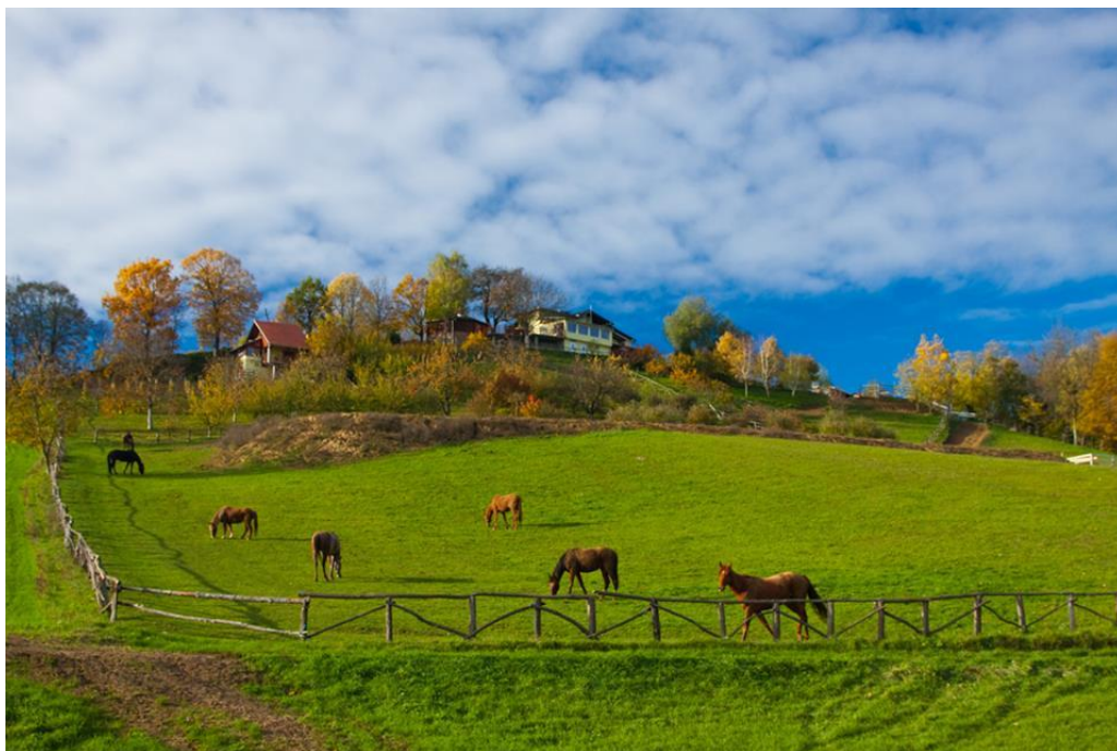
Slika 1. Konji