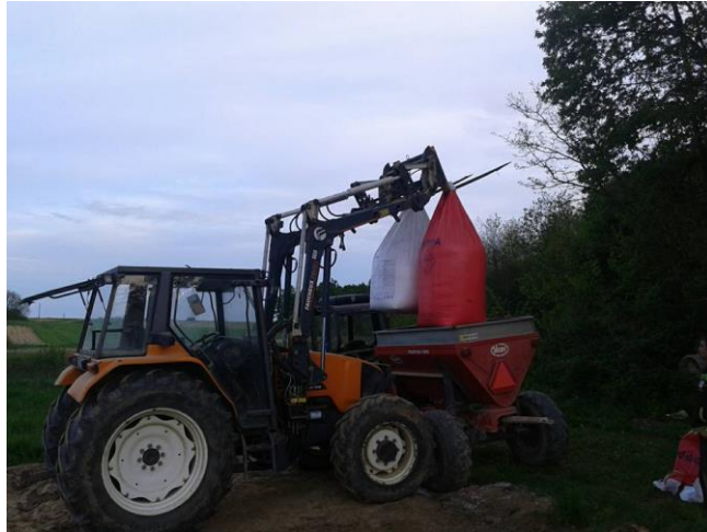
Slika 4: Punjenje rasipača umjetnog gnojiva