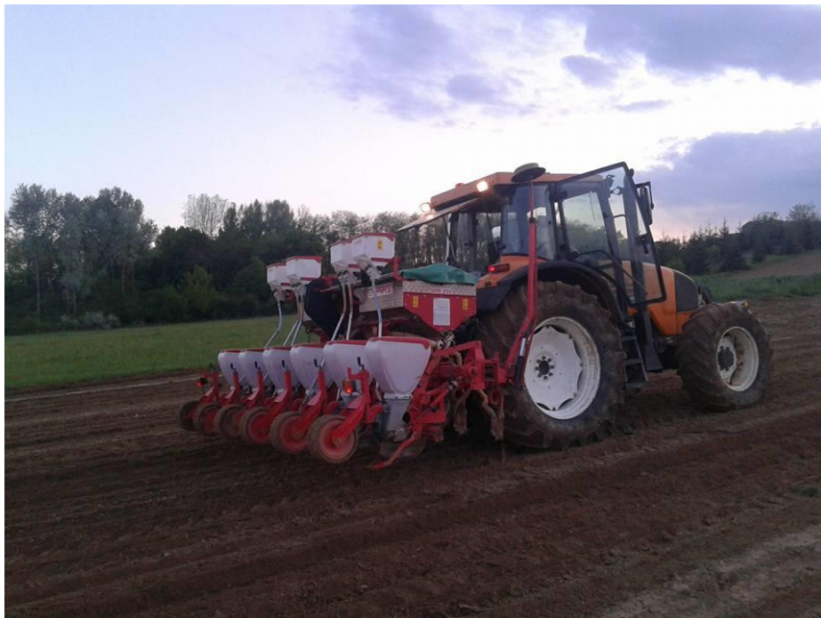
Slika 5: Sjetva kukuruza

Sjetva kukuruza na OPG-u Bukal obavljena je traktorom Renault Ergos 95 i pneumatskom sijačicom za preciznu sjetvu Gaspardo 6 redova. Razmak između redova bio je 70 cm, unutar reda 19 cm, a dubina sjetve podešena je na 5 cm.