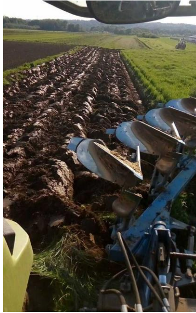
Slika 3: Suvremeni plug premetnjak

Gospodarstvo je sjetvu kukuruza provelo na 15 ha vlastitih površina i na 35 ha koje koristi u najmu. Dio površina obrađen je jesenskim oranjem, a ostalo je obrađeno proljetnim oranjem. Oralo se traktorom Claas 6430 i plugom Krone 4 brazde, te traktorom Renault i plugom Krone 3 brazde. Nakon oranja, u polje se krenulo s rotobranom i teškom branom.