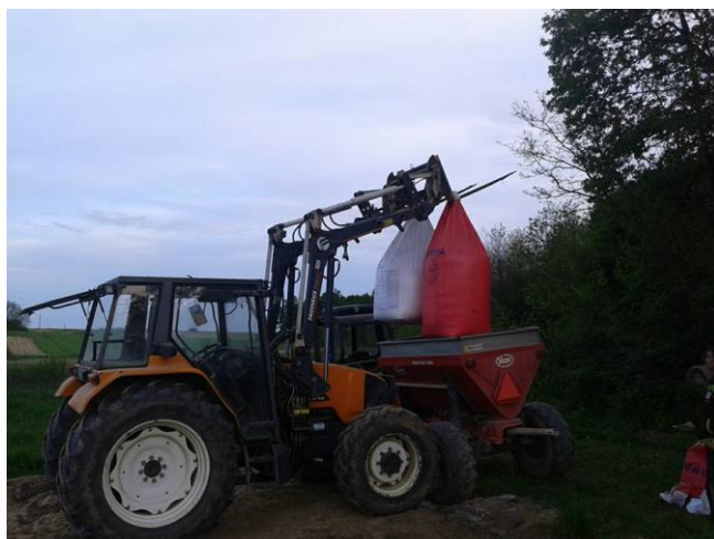
Slika 4: Punjenje rasipača umjetnog gnojiva