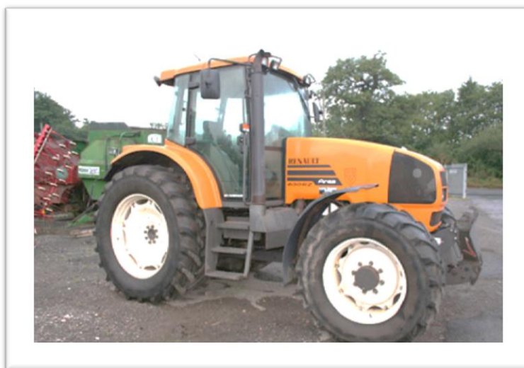
Slika 2: Suvremeni traktor

Suvremeni traktori koriste velike dizelske motore, čija se snaga kreće od 18 do 575 KS (15 do 480 kW) i generalno se mogu razvrstati prema pogonu na traktore s pogonom na dva kotača, traktore s pogonom na dva kotača pomagane prednjim kotačima, traktore s pogonom na četiri kotača (često sa zglobnim skretanjem) i gusjeničare (s pogonom na dvije ili četiri gusjenice). Većina traktora ima mogućnost prijenosa snage na priključke, što je i osnovna namjena. Prvi traktori su koristili remen omotan oko remenice za pokretanje stacionarnih (nepokretnih) strojeva. Moderni traktori koriste kardan (eng. power take-off shaft - skraćeno PTO) za prijenos okretne snage na strojeve koji mogu biti stacionarni ili vučeni. Gotovo svi moderni traktori mogu pružiti hidrauličnu tekućinu i energiju priključnim strojevima. ( www.gospodarski.hr )