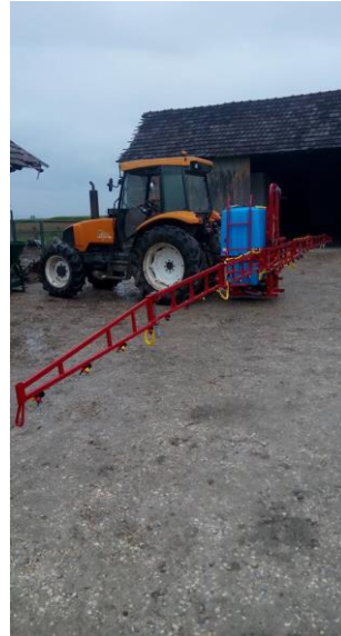
Slika 6 i 7: Prskanje kukuruza