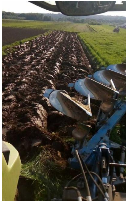
Slika 3: Suvremeni plug premetnjak

Gospodarstvo je sjetvu kukuruza provelo na 15 ha vlastitih površina i na 35 ha koje koristi u najmu. Dio površina obrađen je jesenskim oranjem, a ostalo je obrađeno proljetnim oranjem. Oralo se traktorom Claas 6430 i plugom Krone 4 brazde, te traktorom Renault i plugom Krone 3 brazde. Nakon oranja, u polje se krenulo s rotobranom i teškom branom.