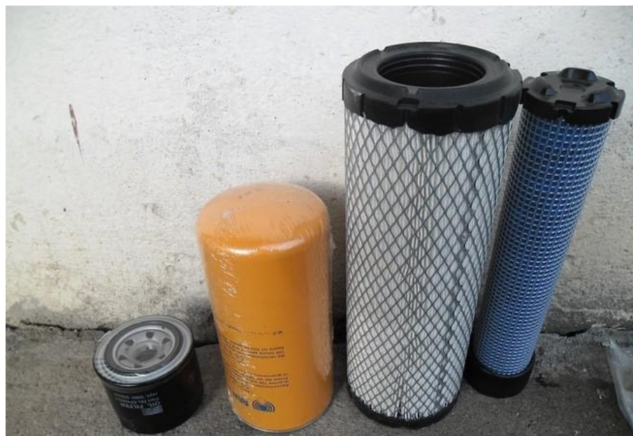
Slika 8: Zamjenski dijelovi,

je potrebno redovito i potpuno održavanje kako bi nesmetano obavljali posao za koji su namijenjeni i kako ne bi došlo do zastoja u samom procesu rada.