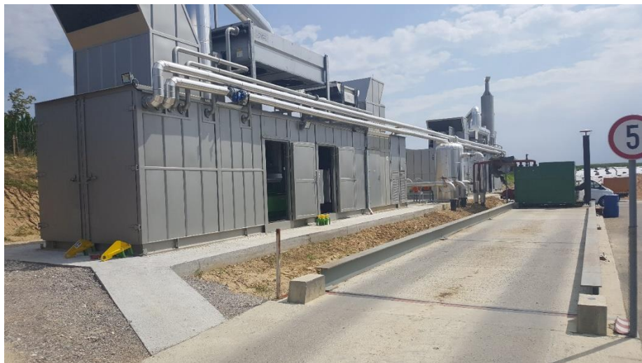
Slika 19: Plinski motori s unutrašnjim izgaranjem