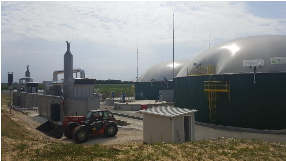
Slika 14: Bioplinara Organica Kalnik 1 d.o.o.

Na gospodarstvu Čakija odlučili su se dio proizvedenog silažnog kukuruza prodati u bioplinaru za potrebe proizvodnje bioplina. Krenulo se silirati 10. rujna 2015. Siliranje je provedeno samohodnim silokombajnom, a transport zelene mase s polja do bioplinare obavljen je sa 7 traktora i prikolica. Na ulazu u bioplinaru svaka prikolica je posebno vagana, zatim je zelena masa istovarena u horizontalne silose u bioplinari i opet se išlo na vagu, kako bi se dobila točna neto količina istovarene zelene mase. Svakom prikolicom je prosječno dovezeno 10 tona zelene mase. Budući da nije bilo većih kvarova, siliranje na OPG Čakija obavljeno je u jednom danu. Cijena 1 kilograma zelene mase bila je 25 lipa, a isplaćivanje otkupljene zelene mase obavljeno je u roku jednog mjeseca preko računa.