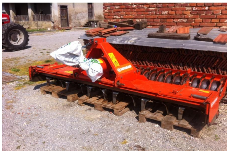
Slika 9. Rotodrljača 3 m