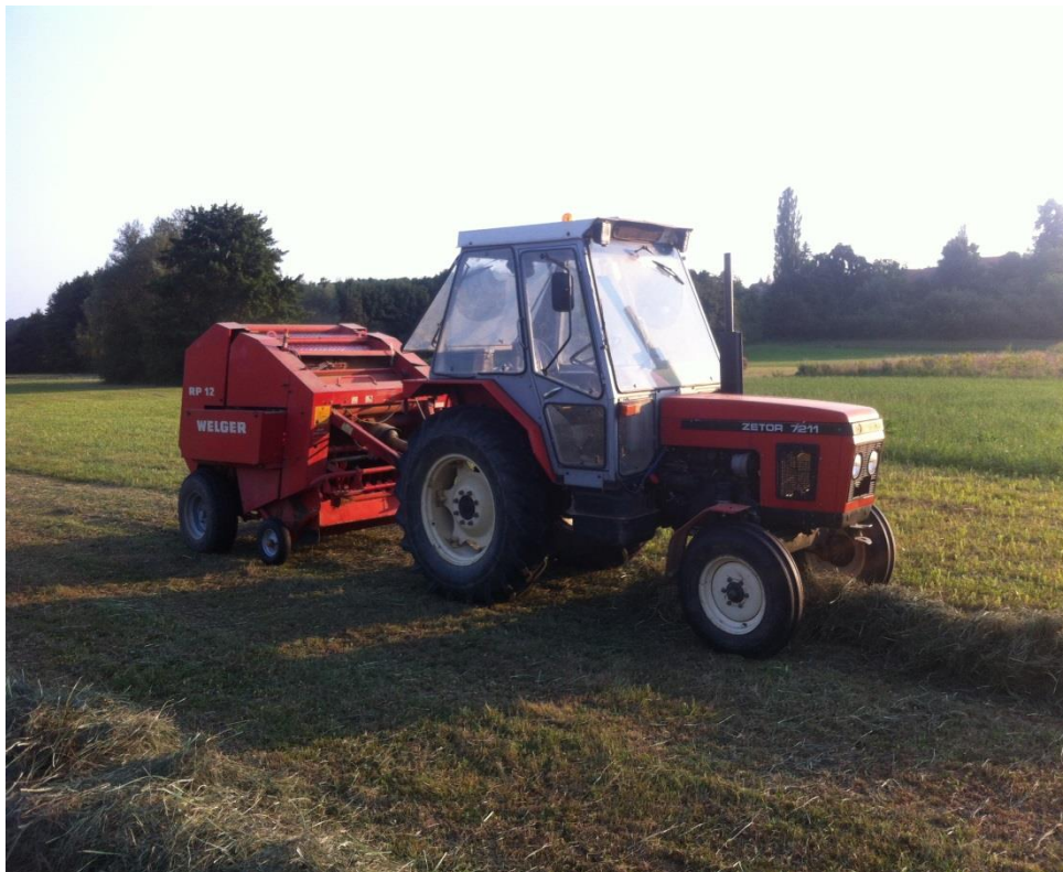
Slika 2. Zetor 7211