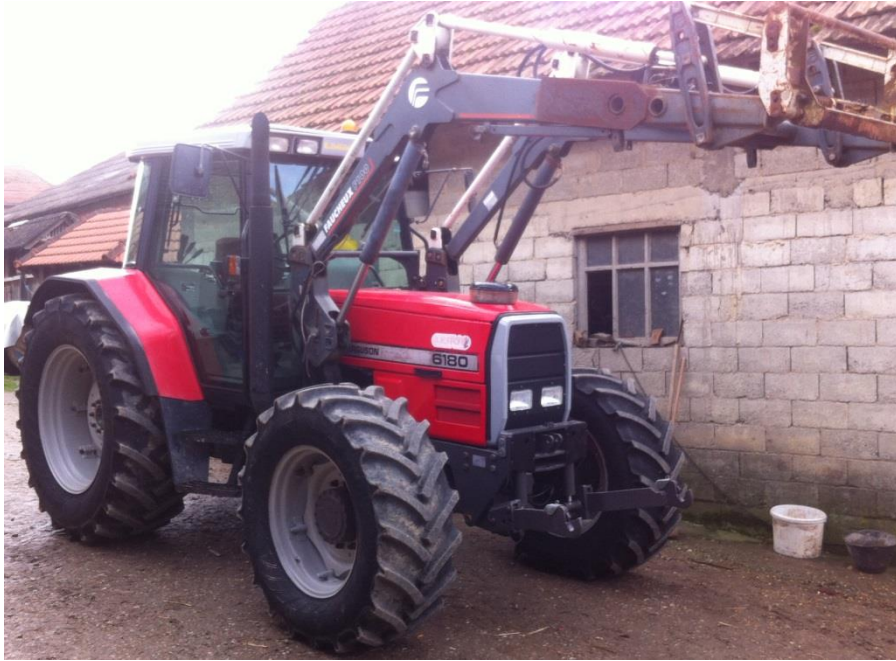
Slika 1. Massey Ferguson 6180