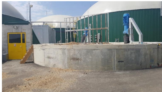
Slika 16: Predmješaće jame za silažu i gnojovku

drvnim otpadom u mješavini 80% digestat – 20% drveni otpad. Tako zamiješani digestat sa drvetom stavlja se na duge hrpe visoke do 1-1,5 m da aerobno fermentiraju. Hrpe se okreću (miješaju) u trenutku kada temperatura unutar hrpe prođe 60 °C. Kada se prestane proizvoditi toplina unutar hrpe digestat je postao kompost. Nakon fermentacije iz postrojenja izlazi digestat sa cca 6-7% suhe tvari. Takav digestat ide na separaciju i separira se na: kruti digestat (cca 25% ST) i tekući digestat (cca 2-3% ST). Tekući digestat će se odvoziti na poljoprivredne površine kao gnojivo bogato hranjivim tvarima.