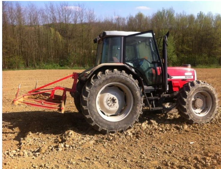
Slika 8. Blanja

Na površinama koje su bile određene za sjetvu silažnog kukuruza, najprije je bio rasipan stajski gnoj, zatim je bilo izvršeno duboko jesensko oranje, kako bi se postigla što bolja priprema i usitnjavanje tla, te akumulacija vode u tlu. U prvoj polovici travnja, kada su bile mogućnosti za ulazak traktora u polje, izvršeno je zatvaranje brazde s blanjom. Prije same sjetve obavljena je predsjetvena gnojidba i priprema tla rotodrljačem.