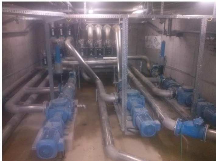
Slika 17: Crpne pumpe