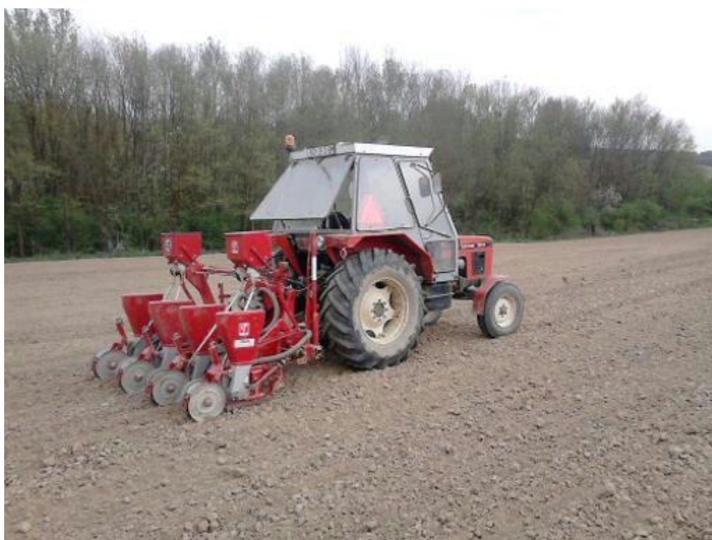
Slika 12: Sijačica četveroredna pneumatska Gaspardo

Snimio: Danijel Čakija ( 4.svibanj 2015.)