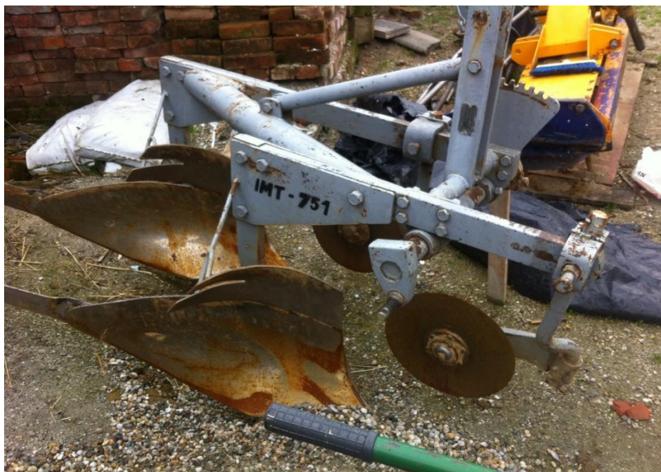
Slika 4. Plug dvobrazdni klasični IMT