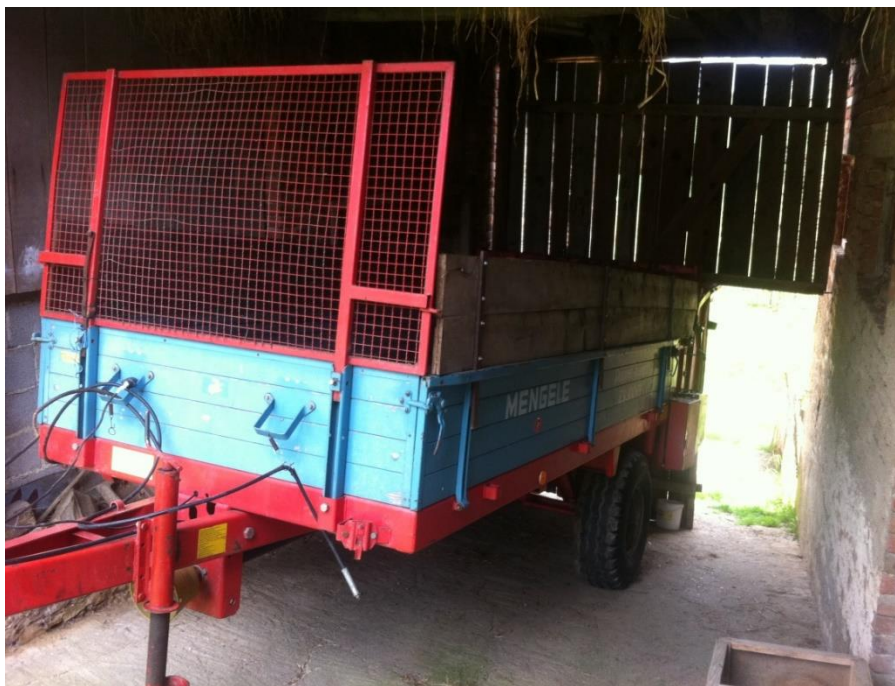
Slika 10. Prikolica za stajski gnoj, MENGELE

Gnojidba je obavljena u osnovnoj obradi obradi tla s 5 tona po hektaru stajskog gnoja. U predstjetvenoj pripremi stavljeno je još 250 kg/ha UREE i 350 kg/ha NPK 15:15:15. Za sjetvu je ukupno utrošeno 600 kg/ha mineralnog gnojiva.