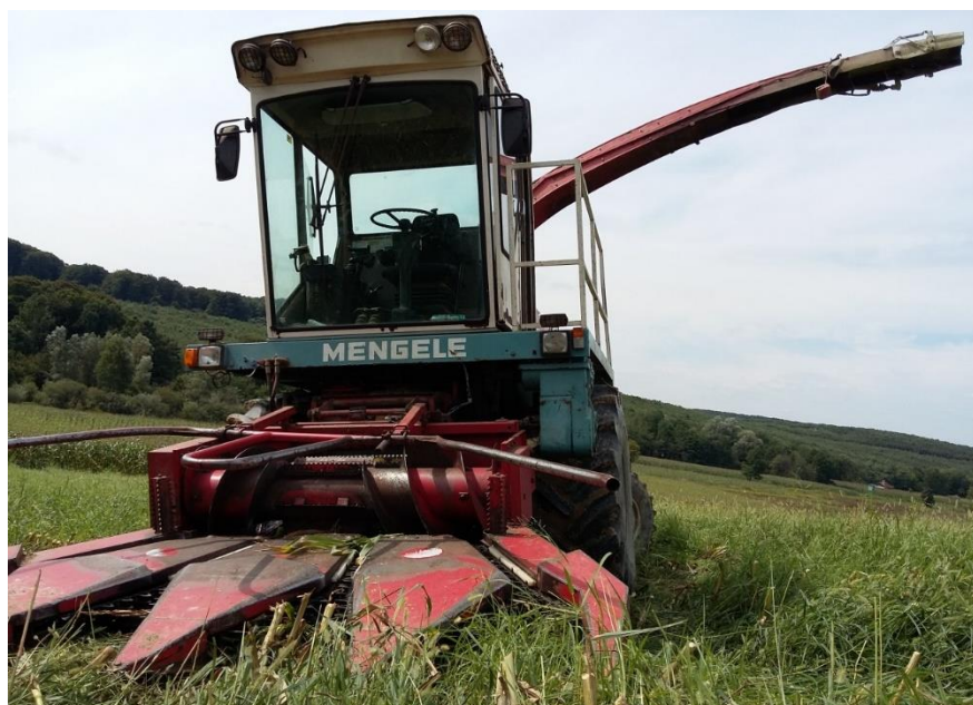
Slika 13: Samohodni silokombajn MENGELE

Siliranje je provedeno samohodnim četverorednim kombajnom marke Mengele. Siliranje je obavljeno 10. rujna 2015.. Ukupno je dobiveno 255 tona zelene mase na 5 ha, odnosno 55 t/ha. Prilikom siliranja kukuruzne silaže visina reza je bila 30 cm iznad tla, a dužina sječke iznosila je 2 cm.