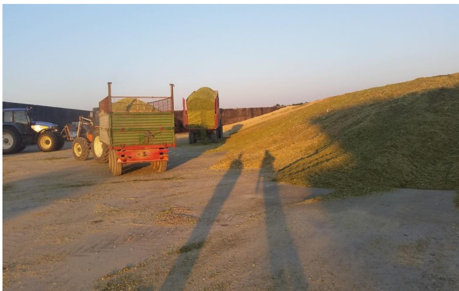
Slika 15: Dovoz zelene mase u silos