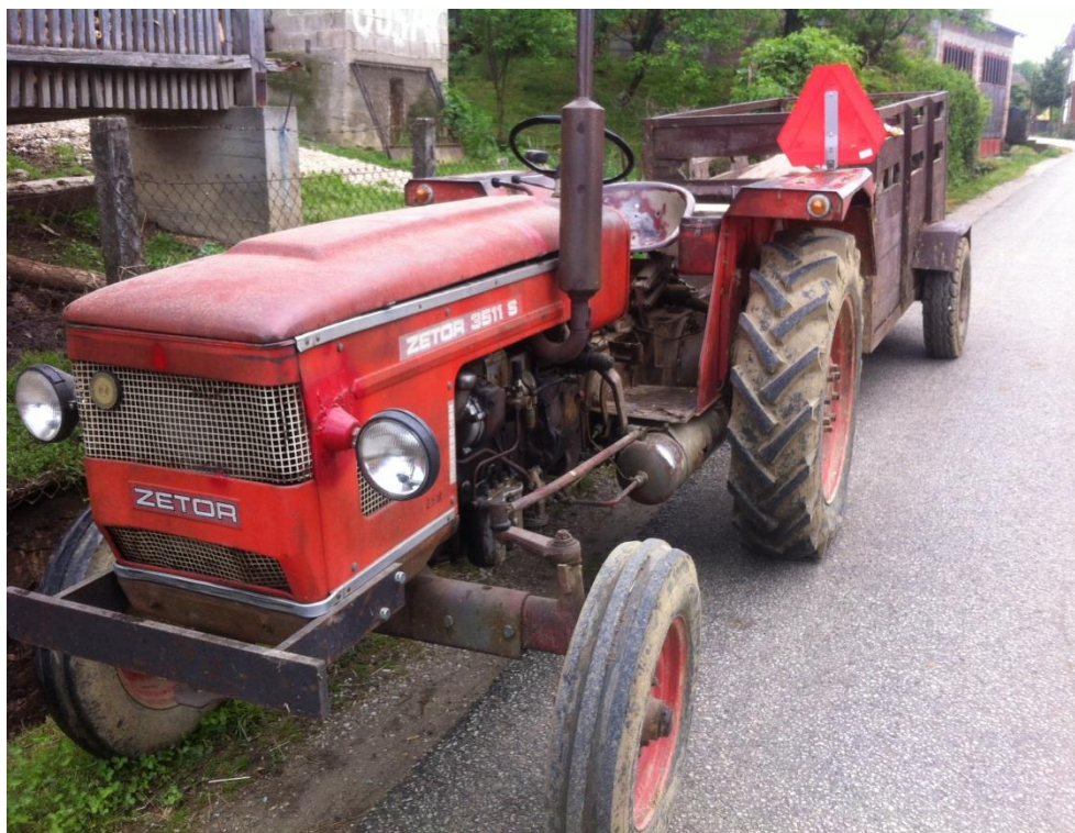
Slika 3. Zetor 3511 S