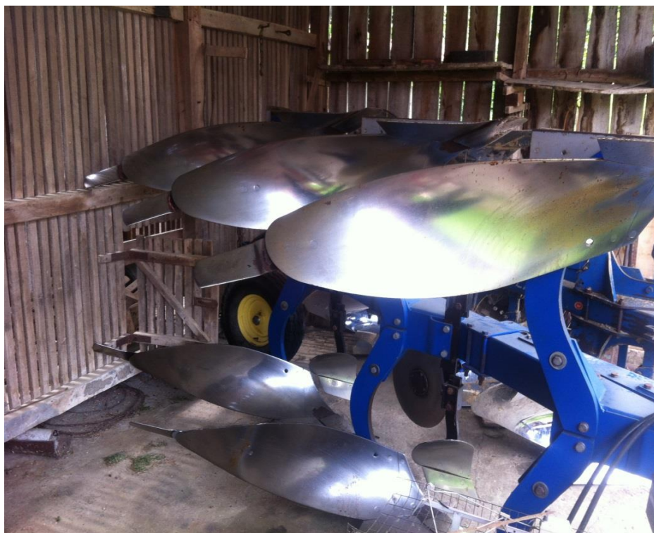
Slika 5. Plug trobrazdni premetnjak