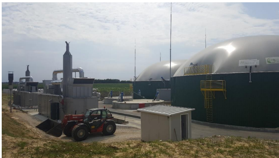
Slika 14: Bioplinara Organica Kalnik 1 d.o.o.

Na gospodarstvu Čakija odlučili su se dio proizvedenog silažnog kukuruza prodati u bioplinaru za potrebe proizvodnje bioplina. Krenulo se silirati 10. rujna 2015. Siliranje je provedeno samohodnim silokombajnom, a transport zelene mase s polja do bioplinare obavljen je sa 7 traktora i prikolica. Na ulazu u bioplinaru svaka prikolica je posebno vagana, zatim je zelena masa istovarena u horizontalne silose u bioplinari i opet se išlo na vagu, kako bi se dobila točna neto količina istovarene zelene mase. Svakom prikolicom je prosječno dovezeno 10 tona zelene mase. Budući da nije bilo većih kvarova, siliranje na OPG Čakija obavljeno je u jednom danu. Cijena 1 kilograma zelene mase bila je 25 lipa, a isplaćivanje otkupljene zelene mase obavljeno je u roku jednog mjeseca preko računa.