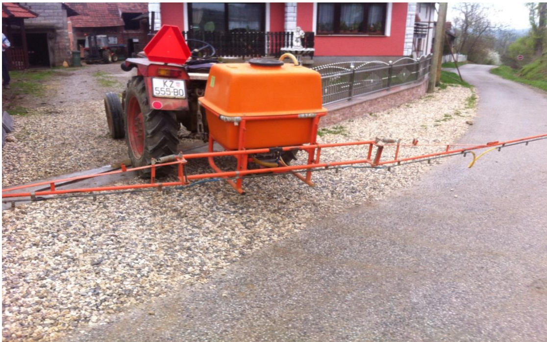
Slika 7. Traktorska prskalica