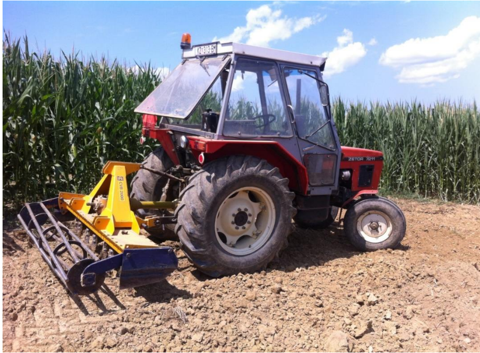
Slika 6. Rotodrljača 2 m