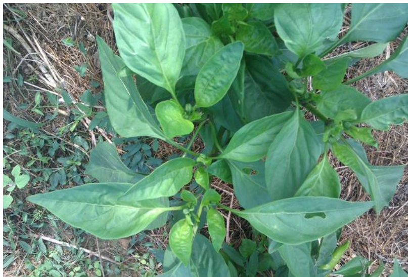
Slika 1. Biljka paprike

Prema Lešić (2004.) paprika ( Capsicum annuum L.) je jednogodišnja zeljasta biljka (Slika 1). Korijen joj je vretenast i brzo počinje grananje. Prodire do 60 cm dubine, ali glavina je korijena u gornjih 30 cm tla. Širi se u promjeru do 60 cm.