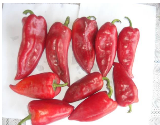
Slika 5. Deformacija plodova