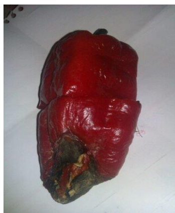
Slika 6. Vršna trulež