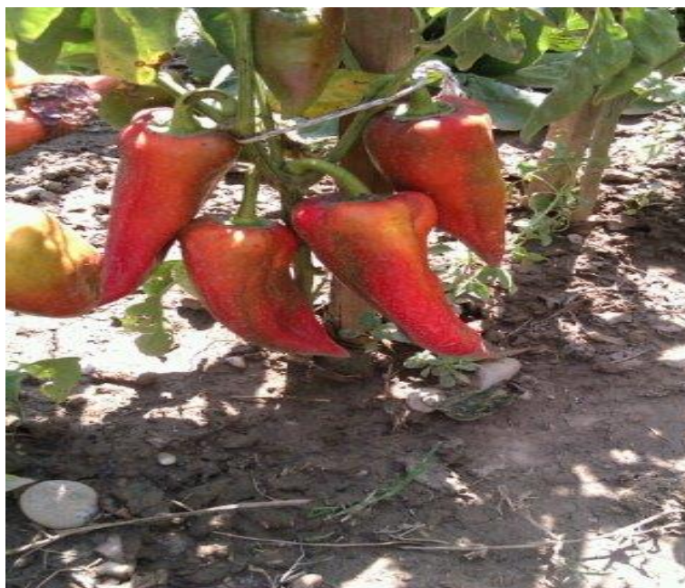
Slika 3. Sorta paprike tipa kapije

Prema Matotanu (2002.) sorta paprike tipa kapije (Slika 3. i 4.) ima plodove spljošteno stožastog oblika sa zašiljenim vrhom. Plodovi su dužine 12 – 18 cm, promjera u najširem dijelu 4 – 7 cm. Imaju uglavnom 2 do 3 sjemene pregrade i perikarp debljine 4 – 6 mm. Težina plodova je najčešće 80 – 120 g. U tehnološkoj zriobi plodovi su zelene ili tamno zelene boje, a u fiziološkoj zriobi pocrvene. Kurtovska kapija na kojoj je izvršena analiza je kasna sorta, spljošteno stožastih plodova, visećeg položaja na biljci s najčešće 2 sjemene pregrade. U tehnološkoj zriobi plodovi su tamnozeleni, dok su u fiziološkoj tamnocrvene boje. Težine su od 70 do 80 g, dužine 14 do 16 cm, promjera u najširem dijelu 4 do 6 cm i debljine perikarda 5 do 5,5 mm. Namijenjena je za preradu rezanjem plodova u filete, odnosno za ajvar.