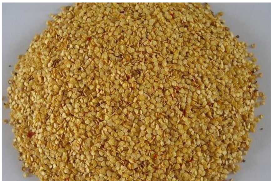
Slika 2. Sjeme paprike

Sjeme (slika 2) je bubrezastog oblika, 3 do 6 mm promjera i 0,5 do 1 mm debljine, plosnato, glatko, blijedožute boje. U jednom plodu može biti 70 do 600 sjemenki, a u 1 g oko 160 sjemenki.