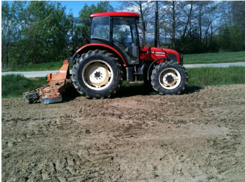
Slika 2. Traktor Zetor 7341 Super turbo

Kao što je već prije navedeno, na gospodarstvu su trenutno 3 traktora, koja služe svrsi i obavljaju sve poslove na farmi i u poljima. OPG u skoroj budućnosti planira nabavku 4 traktora zbog širenja obujma poslova i potrebe za većim i modernijim strojevima.