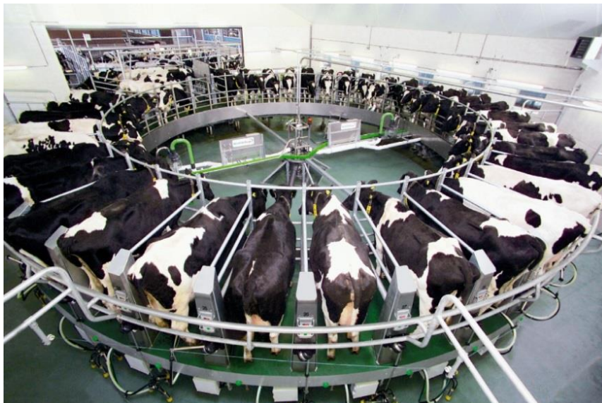
Slika 3. Izmuzište tipa rotolaktor

To je tip izmuzišta s rotirajućom platformom za krave u izvedbi tandemskih odjeljaka, u obliku riblje kosti ili s paralelnim rasporedom. Krave iz predprostora ulaze na svoje mjesto na rotirajućoj platformi i tijekom jednog kruga bivaju pomuzene, nakon čega izlaze iz izmuzišta. Skidanje muzne jedinice je automatizirano, a slijedi u trenutku kada protok mlijeka padne na 200 g/min.