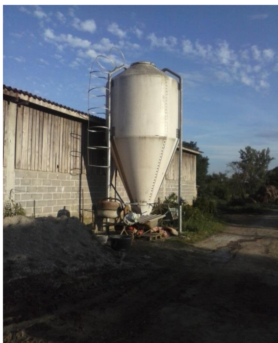
Slika 8: Vertikalni silos

Gotovi koncentraci su skladišteni u vertikalni silos mjesečne dinamike punjenja. Ukupna zapremina silosa je 18 t, tipa „Eurosilos“. Objekt je postavljen na AB temeljnu ploču dimenzija 3,0 x 3,0 m , visina silosa iznosi 5,6 m, a promjer 2,06 m.