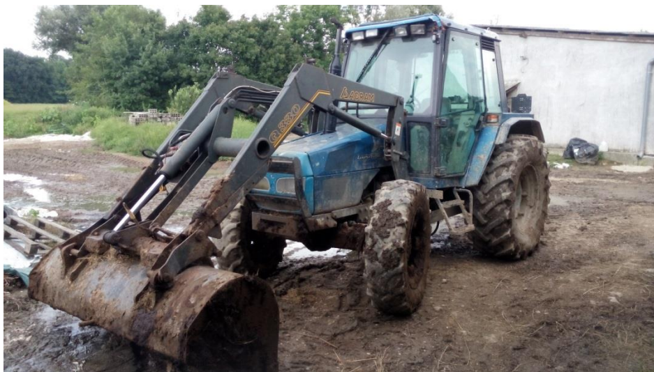
Slika 9: Traktor s prednjim utovarivačem

Koncepcija hranidbe potpunim obrokom ( TMR ) na farmi trenutno ne postoji, ali je u planu nabave. Silaža se izuzima traktorom s prednjim utovarivačem koji ima korpu.