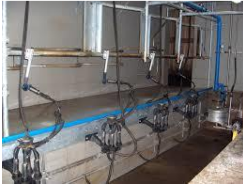
Slika 6: Izmužište

Prostor za kretanje životinja unutar staje čine blatni hodnik između kose ploče i hranidbenog stola. Hranidbeni stol odvojen je krmnom zabranom i smješten je s vanjske strane proizvodnog dijela staje.