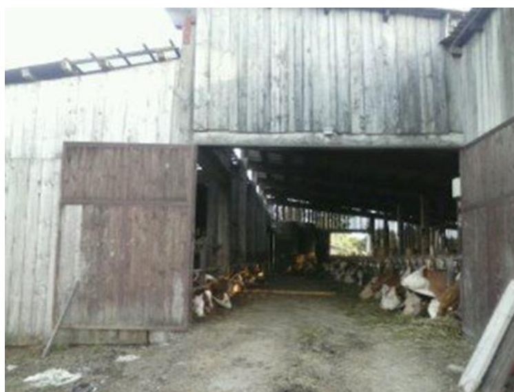
Slika 4: Staja za muzne krave OPG Šmar

U radu su korištene metode prikupljanja i obrade podataka o korištenim strojevima i opremi na farmi, kao i o troškovima i prihodima vezanim uz proizvodnju mlijeka na farmi. Rezultati istraživanja prikazani su u tekstu, tablično i grafički.