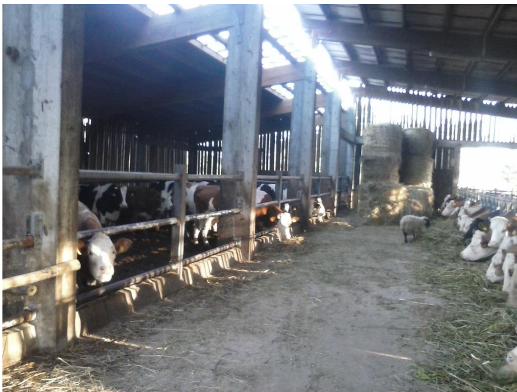
Slika 11: Prirodna ventilacija i osvjetljenje