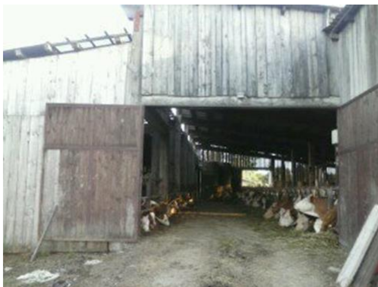
Slika 4: Staja za muzne krave OPG Šmar

U radu su korištene metode prikupljanja i obrade podataka o korištenim strojevima i opremi na farmi, kao i o troškovima i prihodima vezanim uz proizvodnju mlijeka na farmi. Rezultati istraživanja prikazani su u tekstu, tablično i grafički.