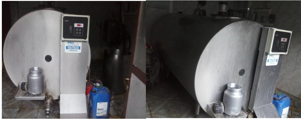
Slika 5: Laktofriz