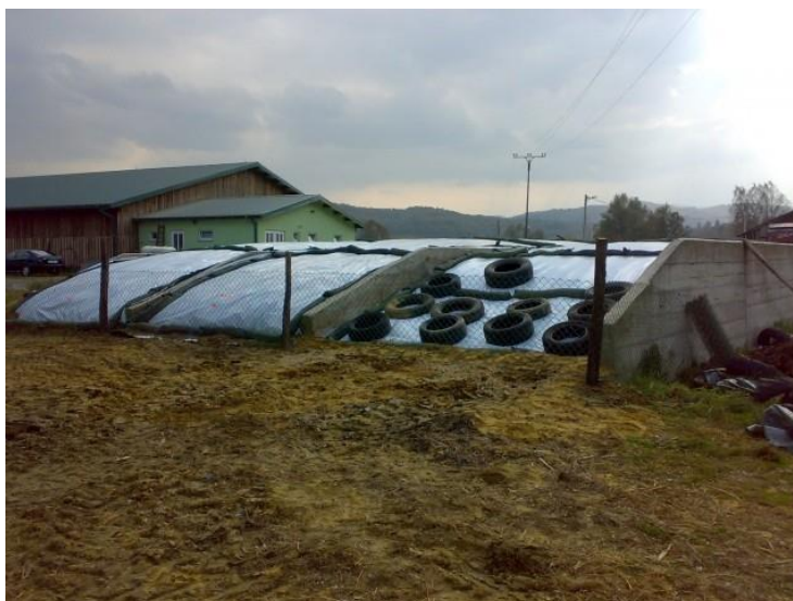
Slika 7: Horizontalni silosi