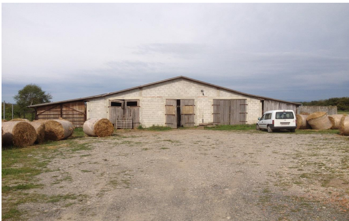
Slika 6. Staja za predtov