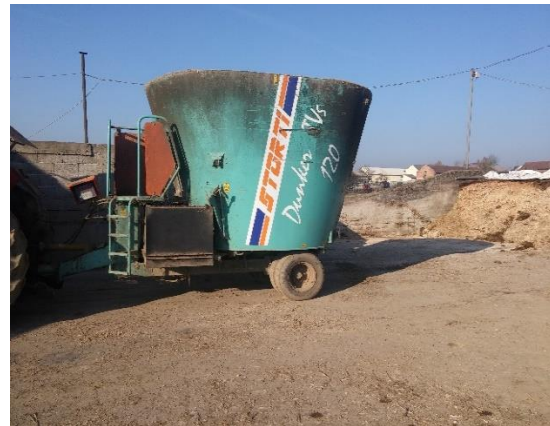
Slika 4. Mikser prikolica Storti