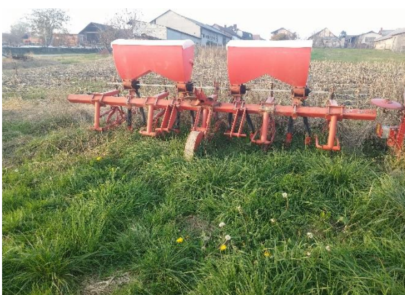
Slika 3. Međuredni kultivator IMT