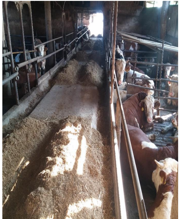
Slika 8. Druga staja za završni tov