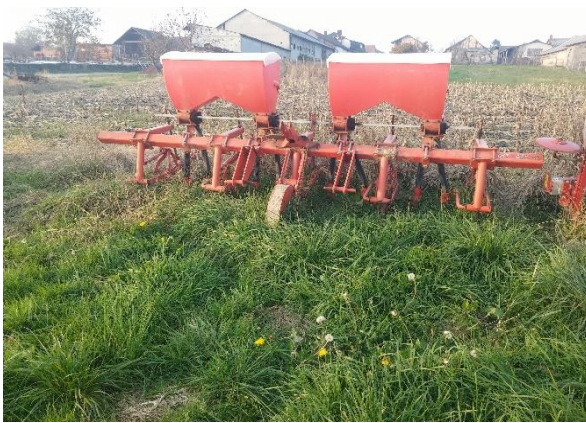
Slika 3. Međuredni kultivator IMT