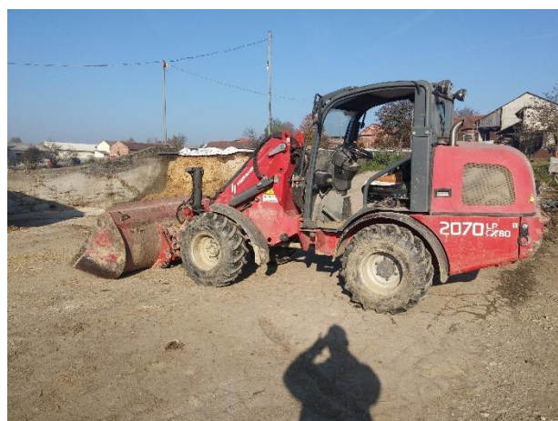
Slika 5. Utovarivač Weidemann