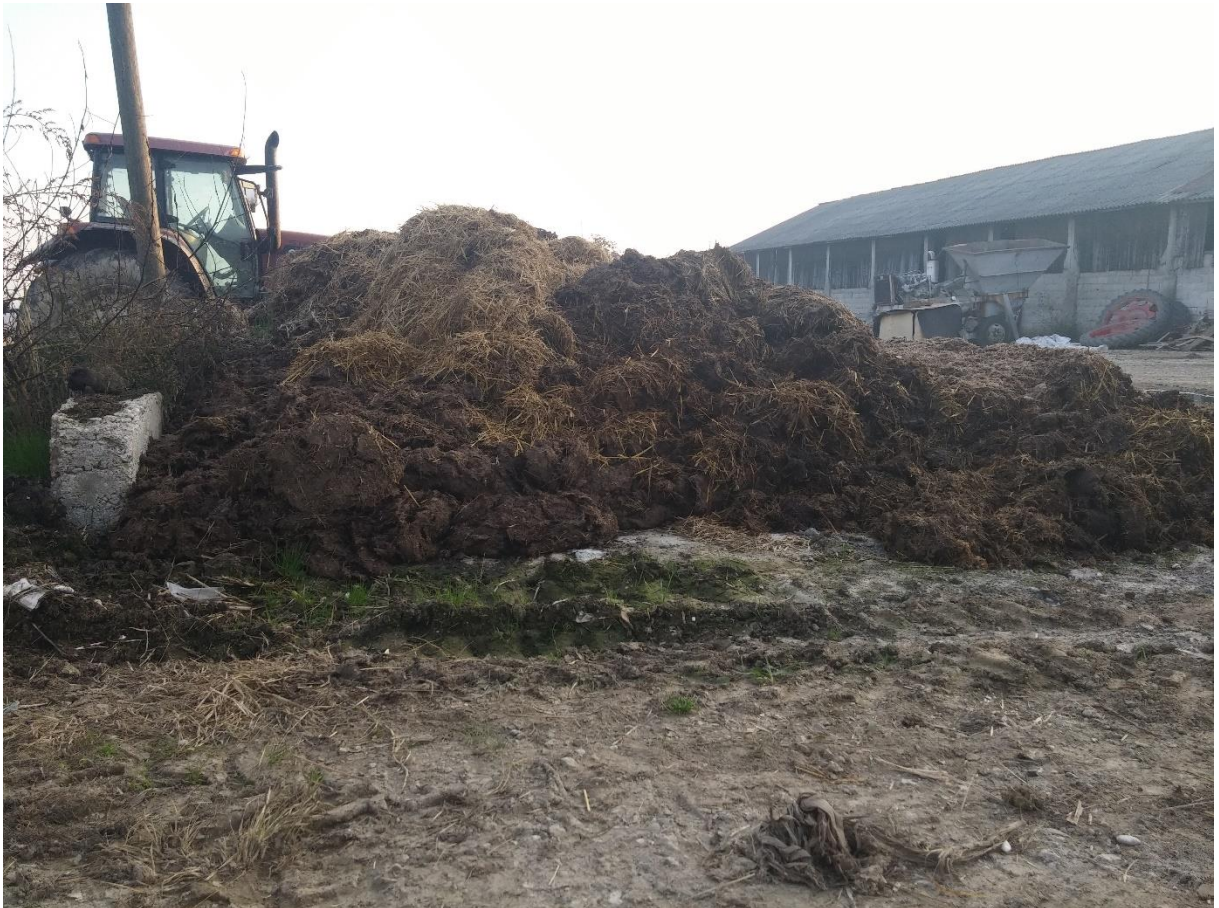
Slika 12. Depo za stajnjak

Depo za stajnjak je veličine 10 x 10 m, a visine 1 m. To je depo za odlaganje krutog dijela stajnskog gnoja koji je nenatkriven.