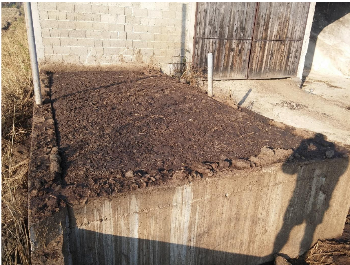
Slika 11. Jama za tekući gnoj

U produžetku svake staje nalazi se jama za tekući gnoj koja služi za prikupljanje veće količine tekućega gnoja. Jedno uvjetno govedo (500kg) dnevno proizvede oko 40-50 kilograma krutoga gnoja i mokraće. Jama za tekući gnoj je izgrađena od vodonepropusnog betona. Radi sprječavanja da se gnojovka u jami na površini skruti i da bi se održala homogenost mase, koriste se mješalice za miješanje tekućeg gnoja. Gnojovka se ispumpava jednom mjesečno do razine poda a postupak se ponavlja kada gnojovka dođe do određene visine bazena.