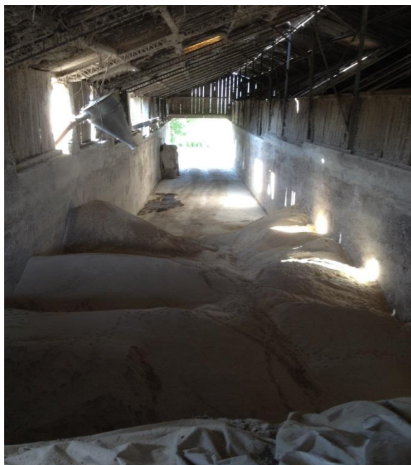
Slika 10. Unutarnji (natkriveni) silos