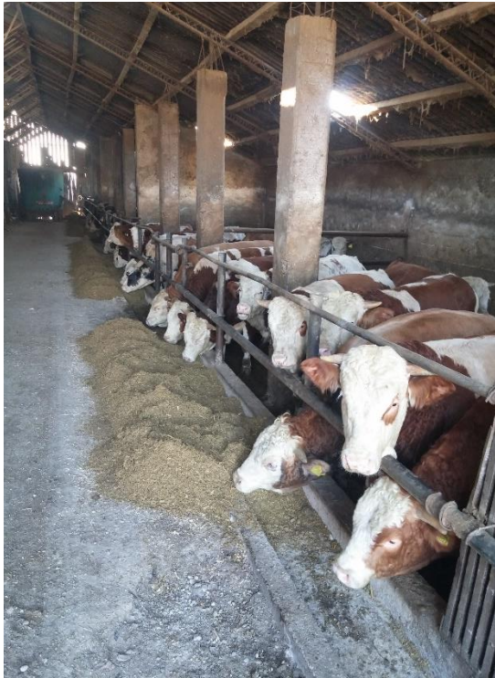
Slika 7. Prva staja za završni tov