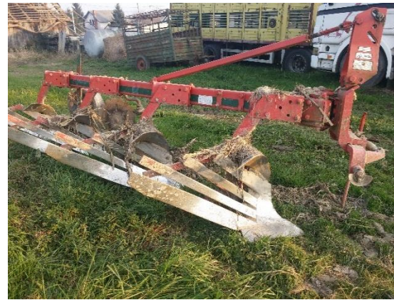
Slika 2. Plug Vogelnoot