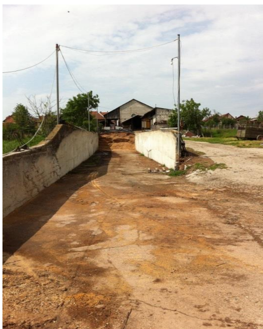
Slika 9. Vanjski silos

Horizontalni silosi su izgrađeni od armiranog betona, puno su duži nego širi, kao i viši nego plići i s tim zadovoljavaju sve kriterije za postizanje što manjeg gubitka, a posebno zadovoljavaju praktičnost, jer se troši manje ljudskog rada kod punjenja i pražnjenja. Siliranje se radi po lijepom vremenu, jer prekidi zbog kiše bitno kvare slojeve silaže, a sam traktor poslije kiše može nanositi blato na silažu, što joj može umanjiti vrijednost. Dovezena masa za siliranje istovaruje se na početku u sam silos iskipavanjem. Masa silaže koja se dopremi s njive mora se odmah i gaziti. Gaženje je brzo da bi se istiskivanjem zraka dobili anaerobni uvjeti, kako se ne bi razvile štetne bakterije, a istovremeno se pospješilo množenje korisnih bakterija. Na taj način se dobiva maksimalna kakvoća silaže. Nakon gaženja, silaža se pokriva plastičnom folijom. Folija je crne boje koja štetnim djelovanjem sunca ne gubi elastičnost, niti se silaža zagrijava (problem s prozirnomo folijom je taj što se stvara staklenički efekt, što nikako nije dobro za siliranje). Folija je šira sa svake strane silosa za jedan metar, iz jednog komada, kako ne bi bilo podlijevanja vode na silažu.