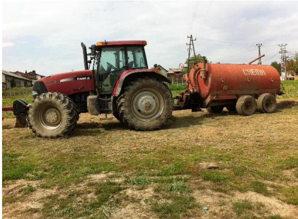
Slika 1. Traktor Case i cisterna Creina