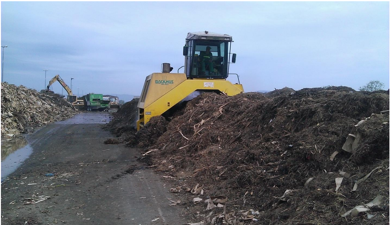
Slika 11. Backhus 16.50 u radu