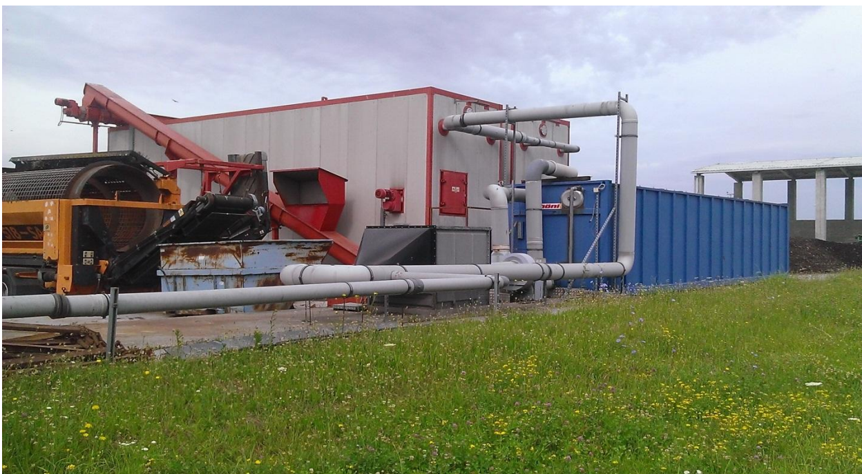
Slika 16. Zatvoreni tip kompostane (2 komore, pužni transporter i sustav za pročišćavanje zraka)