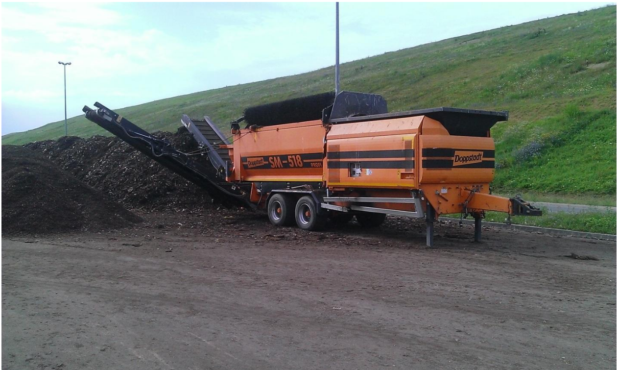
Slika 13. „Doppstadt SM-518“ stroj za prosijavanje komposta