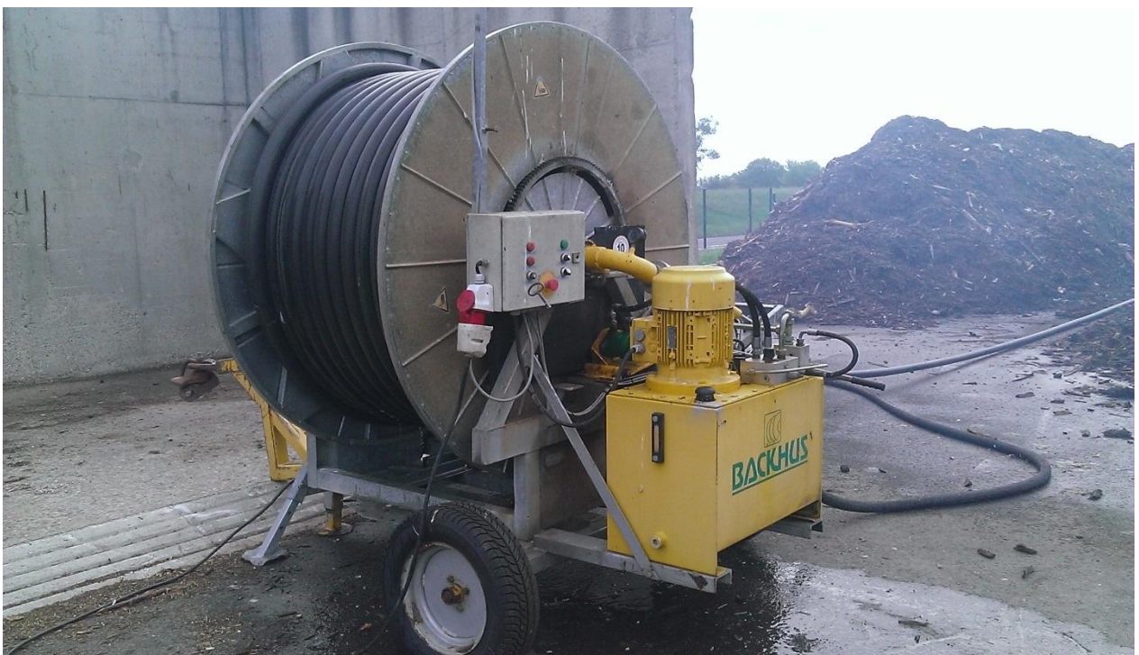
Slika 12. Sustav za ovlaživanje kompostne hrpe