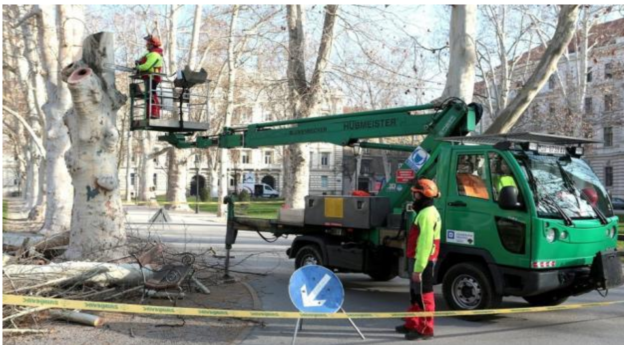
Slika 4. Orezivanje drveća

Da bi do procesa kompostiranja uopće došlo, bio-otpad je potrebno sakupiti i dovesti do kompostišta. S obzirom na površine koje se održavaju u Zagrebu, količina dovezenog bio-otpada je velika. Biomasa se skuplja s javnih površina grada Zagreba tokom čitave godine. Ostaci koji nastaju nakon rezidbe i rušenja drveća u parkovima i drvoredima, košnje trave, sakupljanje lišća u jesenskom periodu, te rezidbe grmlja i živica tvore biomasu koju koristimo u proizvodnji komposta. Otkad je kompostana otvorena sa svim sadašnjim strojevima i uređajima, podružnica Zrinjevac sakuplja bio-otpad koji nastaje izvan grada Zagreba te su trenutno jedini u Zagrebačkoj županiji koji imaju strojeve za usitnjavanje velikih panjeva i slične krupne biomase.