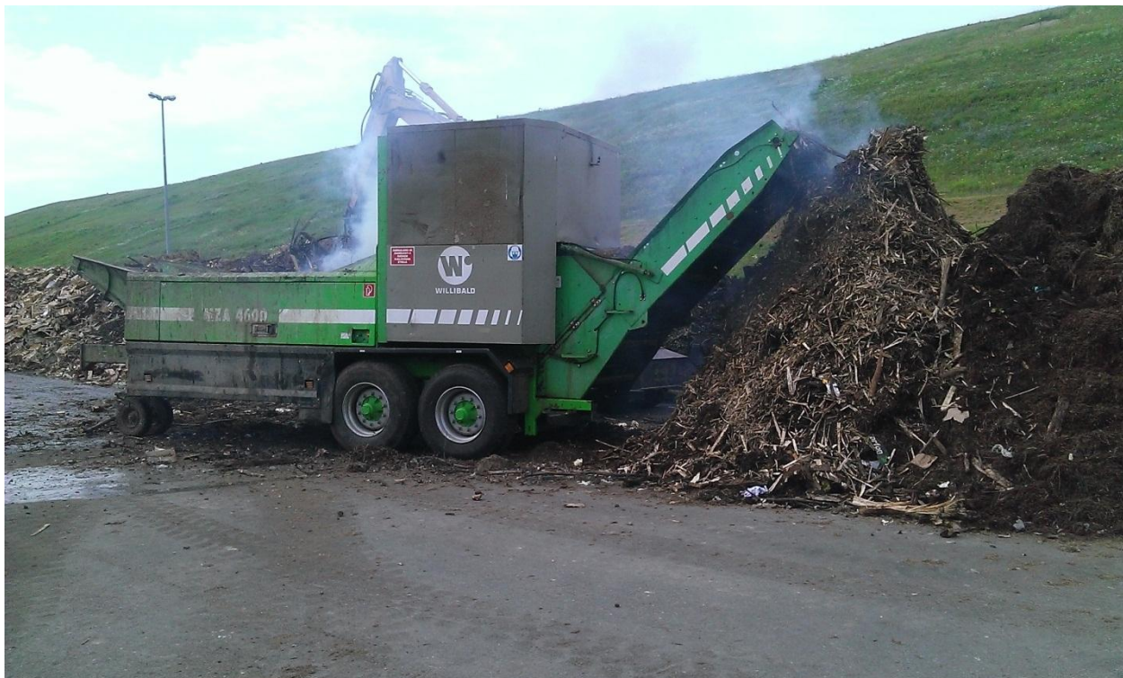
Slika 7. Usitnjivač Willibald MZA-4600

Analizom rada stroja „Willibald“ može se zaključiti da stroj ima jako veliki kapacitet, ali i nedovoljno kvalitetno usitnjavanje. Jednom garniturom noževa (48 komada) može usitniti 2000-3000 m 3 biomase. Nova generacija usitnjivača (u SAD i Europi) je uz smanjenje kapaciteta znatno povećala kvalitetu usitnjavanja. Korištenjem takvih strojeva i boljom kvalitetom noževa, postiže se bolje usitnjavanje te se znatno skraćuje vrijeme fermentacije bio-otpada.