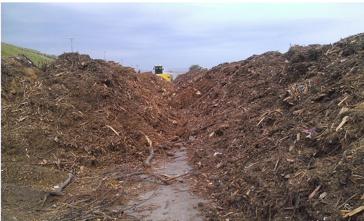
Slika 10. Formiranje kompostnih hrpa

Intenzivan proces razgradnje zelenog otpada u tako složenoj hrpi manifestira se porastom temperature unutar hrpe.