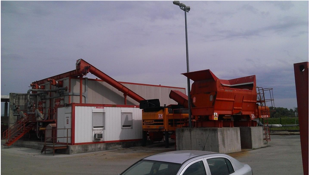
Slika 15. Zatvoreni tip kompostane (server soba, drobilica i sito)