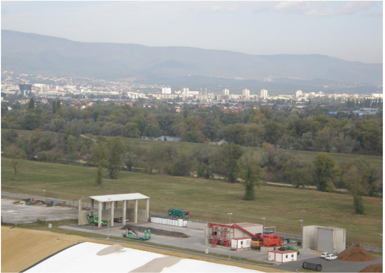
Slika 1. Postrojenje kompostane Jakuševac