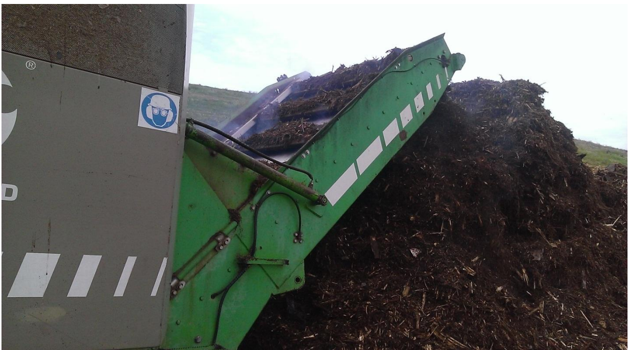
Slika 9. Hrpa mljevenog materijala pri izlasku iz drobilice