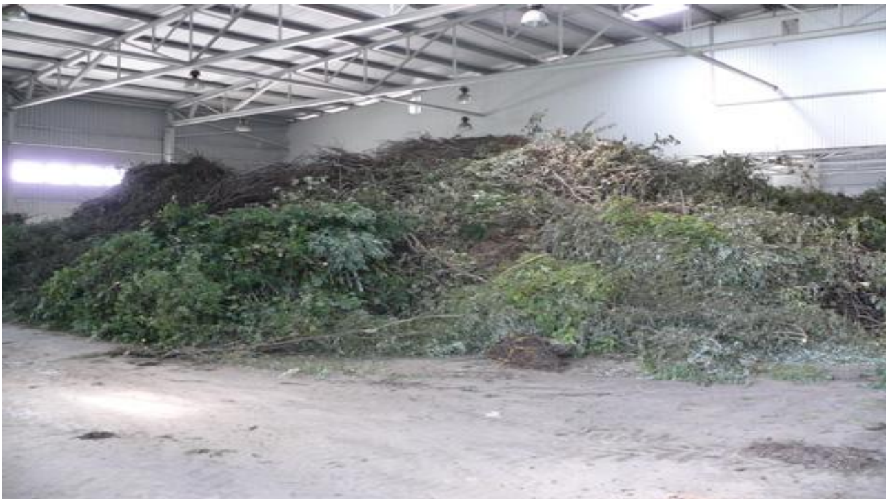
Slika 6. Organski otpad na odlagalištu