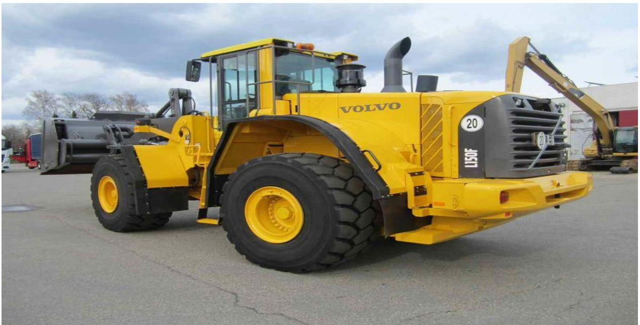
Slika 14. „Volvo“ utovarivač zglobni