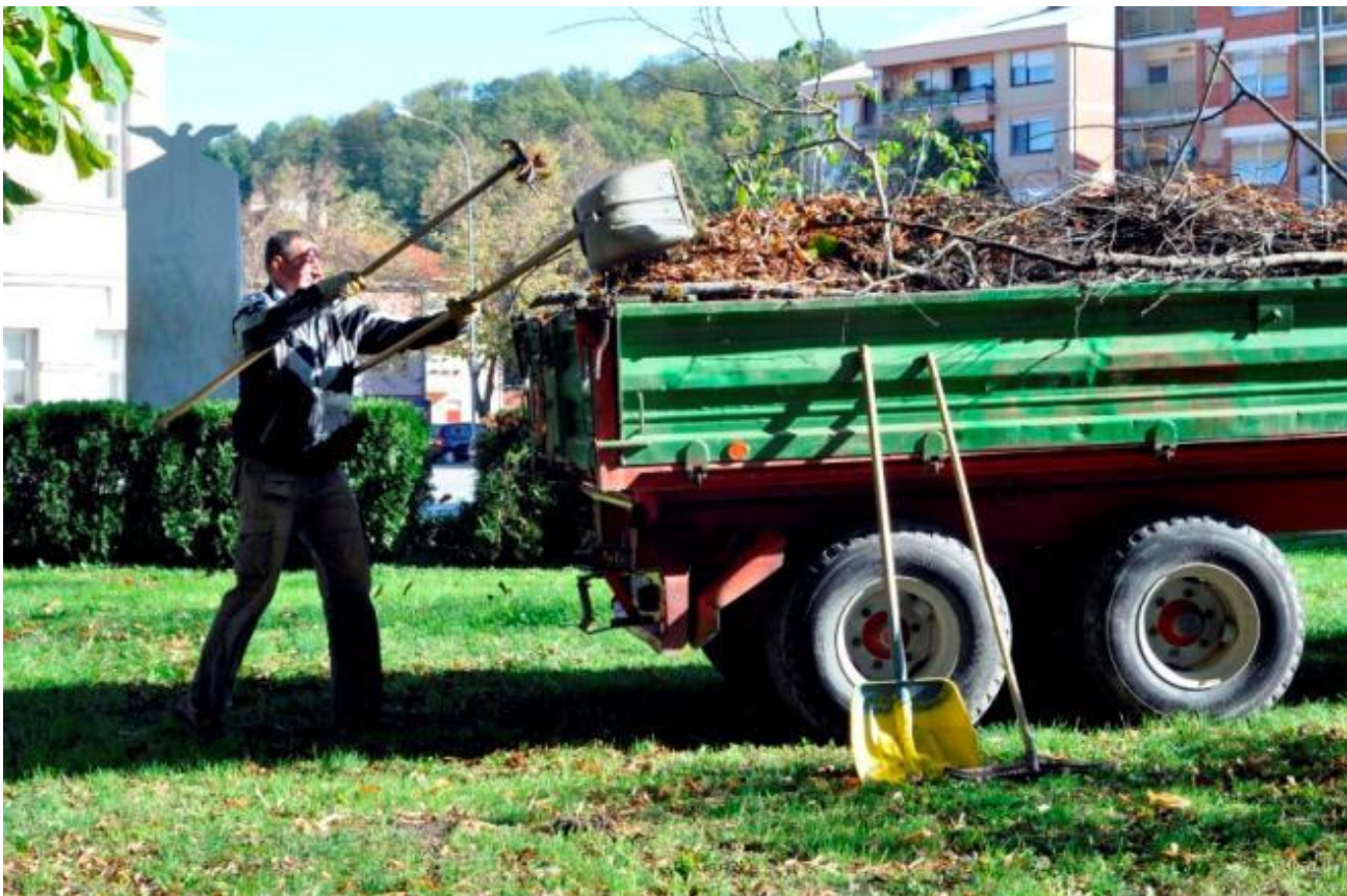
Slika 5. Utovar bio-otpada u kamion