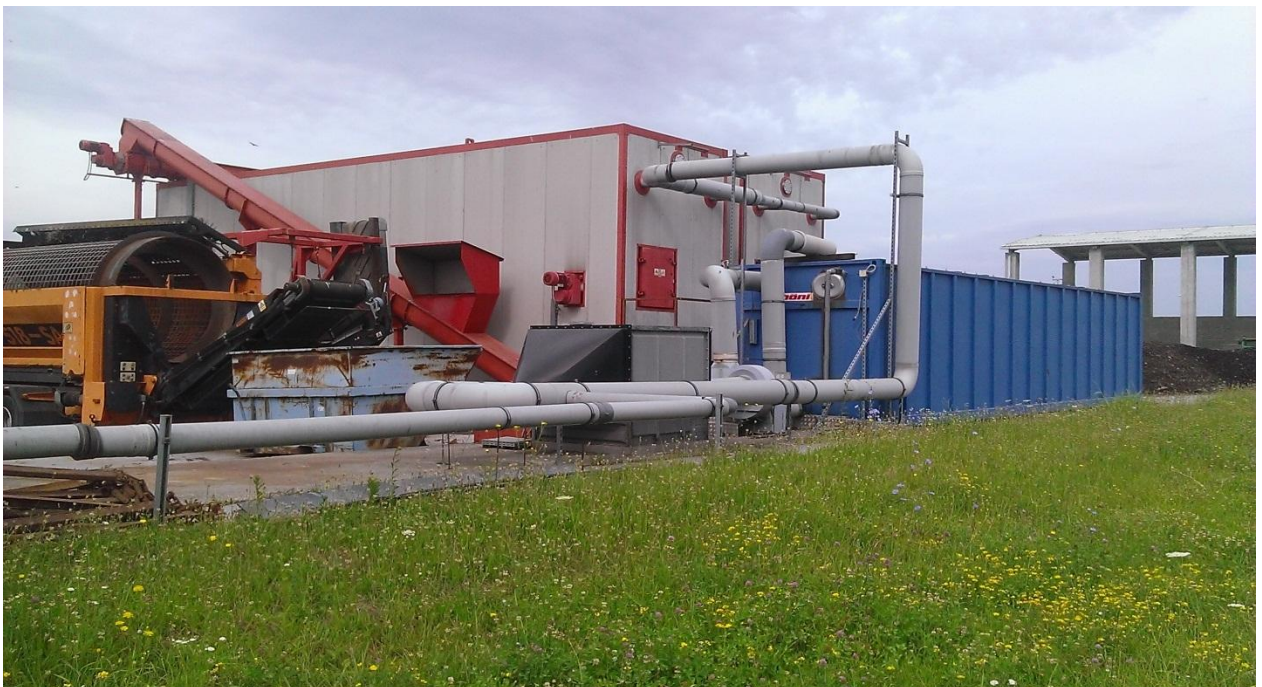
Slika 16. Zatvoreni tip kompostane (2 komore, pužni transporter i sustav za pročišćavanje zraka)