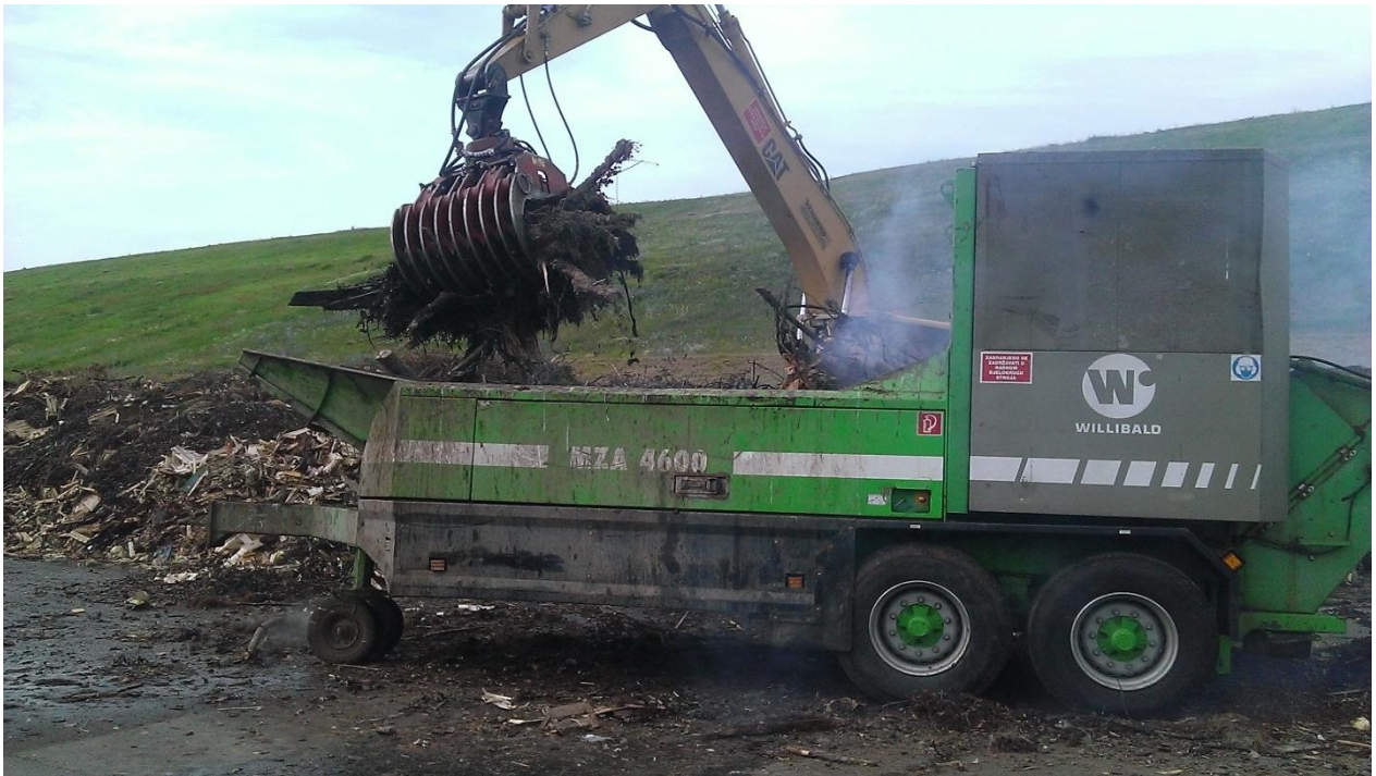
Slika 8. Utovar i mljevenje drobilicom Willibald-MZA-4600