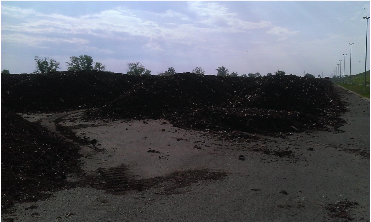
Slika 2. Snimak kompostane Jakuševac