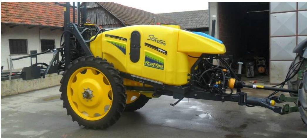
Slika 11. Vučena prskalica za zaštitu bilja

Strojevima kojima se provodi kemijska zaštita bilja postavljeni u neki standardi u pogledu opremanja minimalnom opremom, bez koji niti jedna prskalica ne bi smjela biti korištena za primjenu pesticida. Na gospodarstvu gdje se istraživanje provodilo koristile su se dvije prskalice marke Caffini vučena od 2900 litara i nošena od 800 litara.