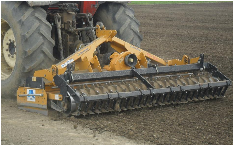
Slika 9. Predsjetvena priprema rotodrljačom

Dopunska obrada tla obavljena je neposredno prije sadnje roto drljačom marke Alpego radnog zahvata od 3 metra. Na slici 9. prikazana je navedena roto drljača u radu na istraživanom gospodarstvu.