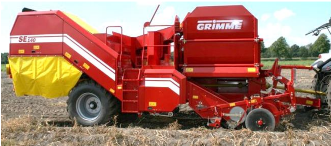
Slika 12. Prikaz kombajna u radu

Vađenje krumpira može se obaviti na više načina. Postoje različite vrste jednostavnih uređaja, pa sve do složenih strojeva koji u jednom proходу vade 3 i više redova. Kod istraživanog gospodarstva postupak ubiranja krumpira obavljen je jednorednim vučenim kombajnom marke Grimme SE140. Na slici 12. prikazan je istraživani kombajn za berbu krumpira u radu.