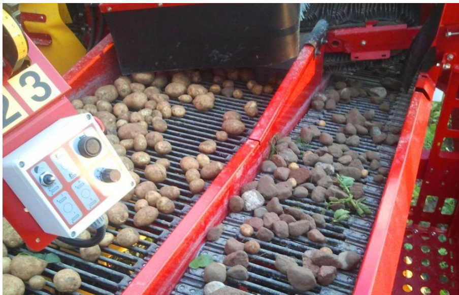
Slika 15. Sklop za elektronsko upravljanje trakama za sortiranje

Na slici 15. prikazan je sklop multifunkcijskih traka za prosijavanje. Traka za grubo prosijavanje koja omogućuje optimalno odvajanje i transport krumpira uz mogućnost reguliranja brzine preko elektro-ventila kojim se regulira protok ulja a samim time i brzina traka neovisno o broju okretaja kardanskog vratila. Također tu se nalazi i mala traka koja je zadužena za transport gomolja sitne frakcije, kamenja, i zemlje.