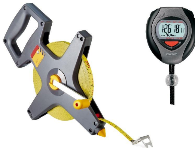
Slika 6. Mjerni uređaji

Radna brzina utvrđena je mjerenjem vremena koje je bilo potrebno da uređaj prijeđe put od 30 metara. Udaljenost od 30 metara izmjerena je mjernim lancem, a vrijeme digitalnim zapornim satom. Na slici 6. prikazana je oprema kojom je izvršeno mjerenje udaljenosti i vremena.