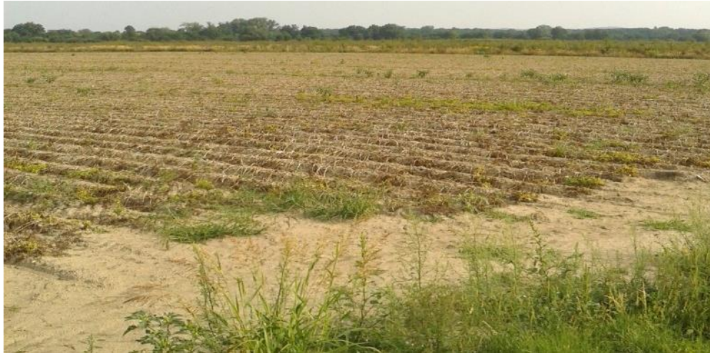
Slika 4. Kemijski odstranjen nadzemni dio biljke (desikacija)

Temeljni cilj pri vađenju krumpira je racionalno vađenje svih gomolja iz zemlje sa što manjim oštećenjima uz odvajanje zemlje, kamenja i biljnih ostataka. Prije početka vađenja potrebno je s zasađene površine odstraniti cimu. Ona se može odstraniti mehanički ili kemijski.