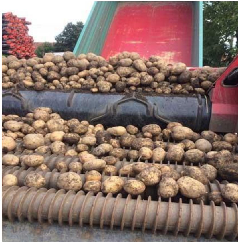
Slika 5. Dorada krumpira prije skladištenja

Pri svakom čuvanju bez obzira na kvalitetu skladišta, postoje određeni gubici, a koji ovise o zdravstvenom stanju ulazne robe, propadanjem gomolja zbog bolesti, te klijanja. U početku su gubici najveći a odnose se na ishlapljivanje, dok je kasnije moguće pojava suhe i mokre truleži i eventualne pojave klica (Lešić i sur., 2004.).