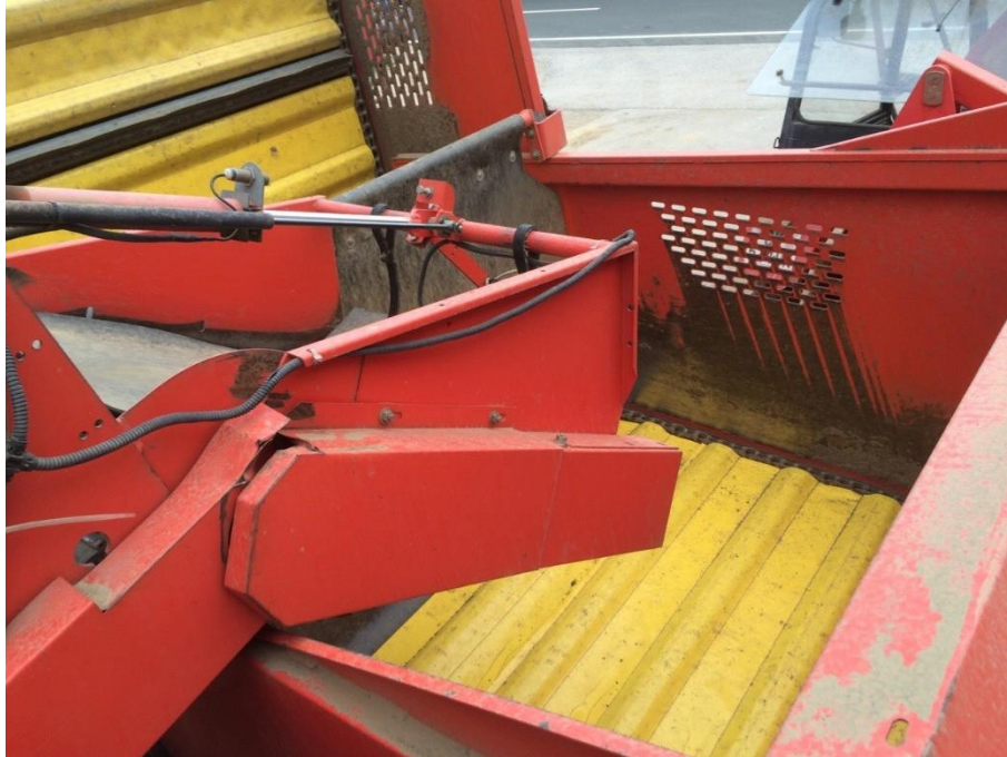
Slika 16. Spremnik za spremanje gomolja

Razmak između rešetaka na glavnoj traci jest 3.5 cm tako da se jedan dio zemlje odvoji tokom transporta krumpira do trake za izdvajanje zemlje, gdje se mora odvojiti sva zemlja bez da oštećuje gomolj. Kasnije slijedi traka za kalibraciju koja se može otvoriti i pritvoriti ovisno o tome koju minimalnu vrakciju gomolja želimo u spremniku. Na kraju dolazi traka koja gomolj nosi u spremnik na kojoj bi trebala biti jedna osoba koja prati brzinu traka i proces kombajniranja krumpira.