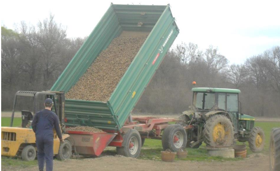
Slika 3. Priprema sjemenskog krumpira za sadnju

Za sadnju se trebaju izdvojiti zdravi neoštećeni gomolji mase oko 50-60 g. Veličina gomolja određuje način sadnje, tj. razmak sadnje između redova i unutar reda kao i dubinu sadnje. Gomolji se mogu prerezati tako da na svakom odrezanom komadu (frakciji) imaju 2-3 okca. Rezanje je uvijek riskantan postupak i rezati se smije samo zdravo i fiziološki mlado sjeme. Rezanjem se prekida dormantnost, tj. pobuđuju se klice i čini se sjeme fiziološki starijim. Rezani gomolji sade se neposredno nakon rezanja u vlažno i zagrijano tlo gdje postoje relativno dobri uvjeti za zarašćivanje rane reza. Vrijeme sadnje ovisi od tipa tla, području uzgoja i vremenskim uvjetima godine. Optimalan rok za sadnju krumpira u ravničarskim predjelima je od sredine ožujka do početka travnja, a u brdsko-planinskim predjelima od početka do kraja travnja. U južnim dijelovima (Dalmacija i otoci), sadnja krumpira počinje od kraja siječnja. Dubina sadnje ovisi o tipu tla, klimatskim uvjetima i krupnoći sadnog gomolja. Uobičajena dubina sadnje je 8-12 cm, tako da je gomolj pokriven slojem tla 5-6 cm. Količina gomolja za sadnju ovisi o njihovoj krupnoći, obliku i vegetacijskom prostoru (Lešić i sur., 2004.).