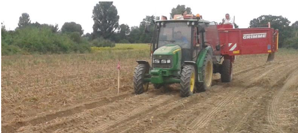
Slika 7. Postupak mjerenja brzine rada kombajna

Na slici 7. prikazano je mjerenje brzine rada kombajna.