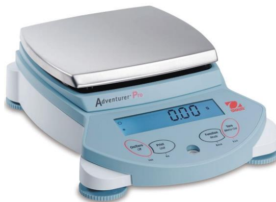
Slika 8. Digitalna Vaga

Nakon prolaza jednorednog kombajna za vađenje i transport krumpira do spremnika, utvrđena je količina krumpira koja je ostala na parceli. Utvrđivao se broj gomolja i njihova masa (kg). Na slici 8. prikazana je digitalna vaga kojom je mjerena masa gomolja koji je izvađen nakon prolaza kombajna.