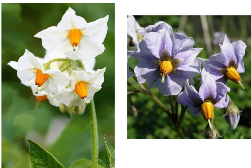
Slika 2. Cvat krumpira

karakteristika, a dugi dan i srednje temperature stimuliraju cvatnju. Visoke temperature i pojava sekundarnog rasta je pojačavaju, iako temperatura viša od 25°C uzrokuje opadanje cvjetova pri čemu se razvija i mali broj bobica. Ako cvjetovi ne abortiraju, razvijaju se u bobice u kojima se formira 100 – 200 sjemenki. Sjemenke su sitne, plosnate i ovalne i nazivamo ih pravim ili botaničkim sjemenom, a služe u oplemenjivanju te u novije vrijeme i za direktnu sjetvu za proizvodnju jestivog krumpira. Prinos nasada iz pravog sjemena niži je od prinosa uzgojenog iz zdravih sjemenskih gomolja, a veći je i udio malih gomolja. Prednost je uzgoja krumpira direktno iz sjemena, pored jeftinog prijevoza na veće udaljenosti i ta što se pravim sjemenom ne prenose ekonomski važni virusi uzročnici degeneracije krumpira, pa se dobiva zdrav usjev (Lešić i sur., 2004.).