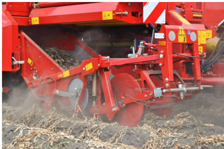
Slika 14. Sklop za praćenje terena

Na slici 14. prikazan je sklop za praćenje terena kod kombajna u radu. Funkcija sklopa za praćenje terena je precizniji rad sklopa za vađenje, odnosno manji gubici.