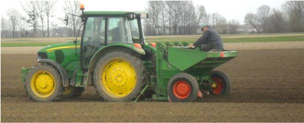
Slika 10. Sadnja krumpira

Na gospodarstvu gdje se provodilo istraživanje koristila se četveroredna sadilica krumpira marke Hassia.