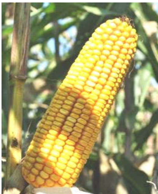
Slika 2. Hibrid PR37K67

Siliranje se vršilo u vrijeme voštane zriobe zrna. Vlažnost zrna bila je oko 35 – 40%, što je i najpovoljnije vrijeme. Silirala se cijelokupna biljka. Visina skidanja kukuruza za silažu iznosila je 25cm, a dužina sječke između 10-12mm. Hibrid P0412 AQUAmax dao je prinos od cca60t/ha, a hibrid PR37K67 prinos od 55t/ha. Prinosi su bili očekivani. Silaža se uskladištila u odgovarajuće horizontalne silose na obiteljskom poljoprivrednom gospodarstvu Konjačić.