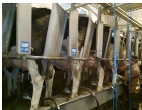
Slika 22. Izmuzište

Izmuzište je marke BouMatic, starosti 13 godina. Model izmuzišta je riblja kost i kapaciteta je 2 puta po 10 mjesta. Prosječna brzina mužnje iznosi oko 2-2,5 l/min. Spremnik za mlijeko je kapaciteta 8.000 litara i također je marke BouMatic. Spremnik zadovoljava sadašnje potrebe u proizvodnji mlijeka. Higijena izmuzišta, spremnika za mlijeko i opreme je besprijekorna, što se odražava na kvaliteti mužnje, te naposljetku na kvaliteti mlijeka. Izmuzište te sva potrebna oprema prilikom mužnje (osim spremnika za mlijeko) peru se, te dezinficiraju 2 puta dnevno (odmah nakon mužnje) dok se spremnik pere i dezinficira jednom dnevno nakon što cisterna odveze mlijeko.