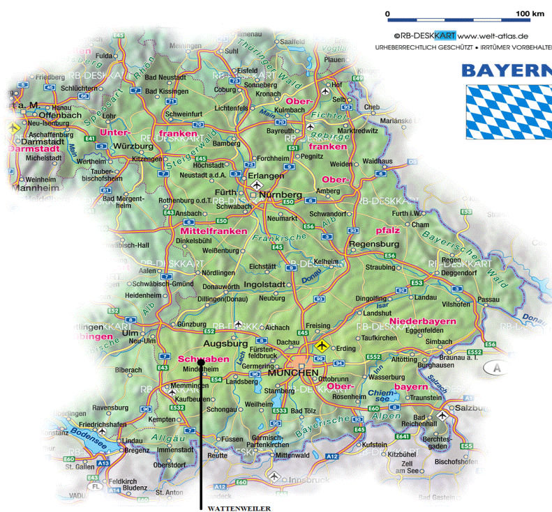
Slika 3. Položaj sela Wattenweiler