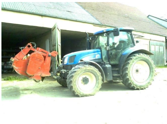
Slika 10. Prikaz garaže i radionice u pozadini traktora