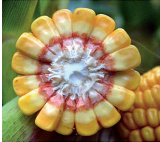
Slika 1. Mliječna linija na zrnu kukuruza