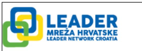
Slika 1. Izgled logotipa LEADER mreže Hrvatske

Uz bottom-up pristup definitivno najveću ulogu ima pristup umrežavanja i kooperacije. U razdoblju prije informatizacije pristup informacijama te razmjena iskustava je bila otežana za razliku od današnjeg doba. Danas živimo u vremenu kada su svugdje oko nas dostupne informacije, no većina njih može biti netočna. Samim time, LEADER bi se u nekim segmentima dao usporediti i s modernim pristupom poduzetništvu. Naime, takav pristup poduzetništvu je imao autor Humberto Barreto (Škrtić i Mikić., 2011). Humberto Barreto govori kako se moderni pristup odnosno moderna teorija poduzetništva bazira na tri pretpostavke, a to su: proizvodna funkcija, logika racionalnog odabira i perfektnost informacija. Upravo ta točnost informacija danas i jest najveći problem. Stoga, umrežavanje i kooperacija kao jedan od sedam principa LEADER programa i jest najvažniji.