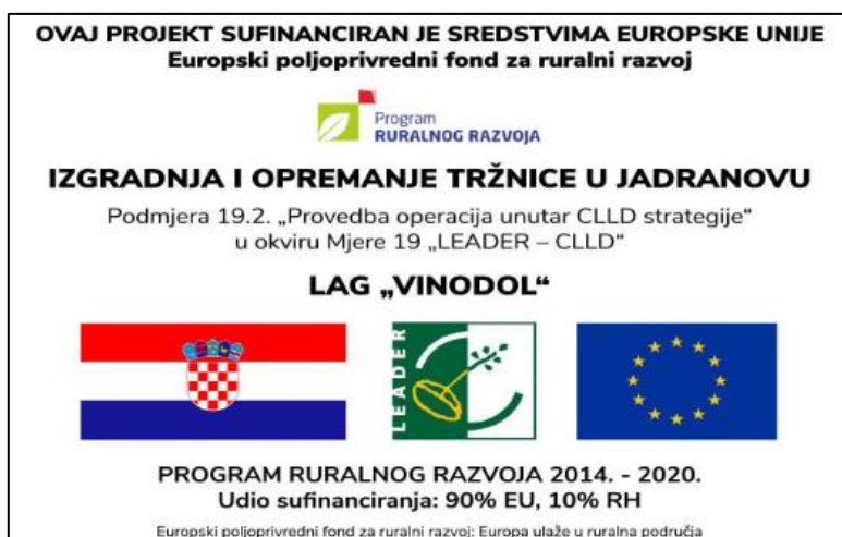
Slika 13. Oznaka o sufinanciranosti projekta za izgradnju i opremanje tržnice u Jadranovu

Jadranovu (slika 13) . Ukupna vrijednost projekta je 115.576,68 EUR (870.812,50 HRK) od kojih je dio sufinanciranih iz bespovratnih sredstava dobivenih na LAG natječaju 31.994,82 EUR (241.064,97 HRK) u sklopu tipa operacije 7.4.1. Jadranovo je mjesto koje broji 1.077 stanovnika te nije imalo tržnicu za opkrbu stanovništva i sve većeg broja turista s lokalnim poljoprivrednim proizvodima s OPG-ova koji se nalaze na području LAG-a Vinodol. Stoga, došlo se na ideju za izradu projekta izgradnje i opremanja tržnice u Jadranovu koja bi bila izgrađena na površini od 270 m 2 .