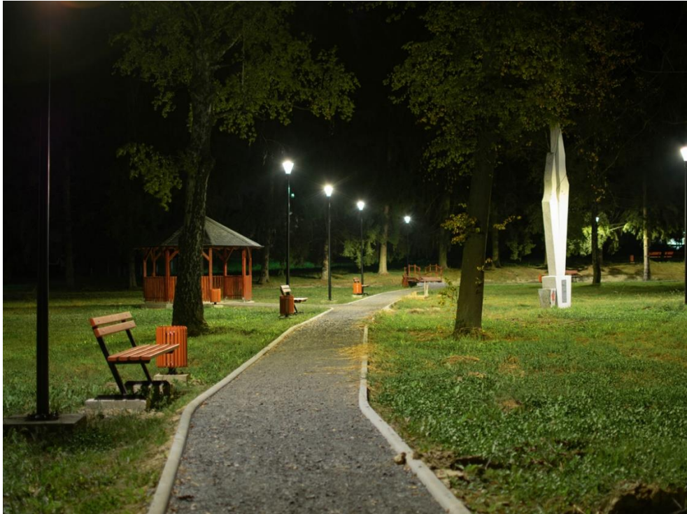
Slika 10. Izgled novouređenog parka u Subotici Podravskoj