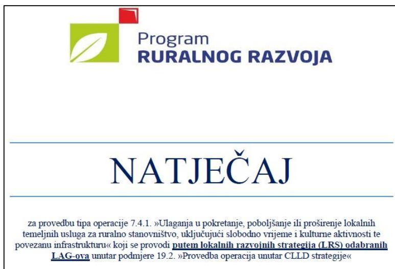
Slika 4. Izgled naslovne strane objavljenog Natječaja