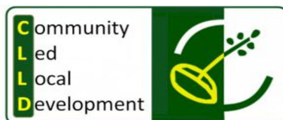
Slika 2. Logotip CLLD-a

LEADER mreža Hrvatske (slika 1) je nacionalno nevladino udruženje LAG-ova i potpornih organizacija odnosno institucija isključivo iz javnog i civilnog sektora za lokalni razvoj koje djeluju na nacionalnoj razini te pružaju pomoć LAG-ovima. Osnovana je 12. travnja 2012. godine na inicijativu tada 20 LAG-ova te 7 institucija i organizacija.