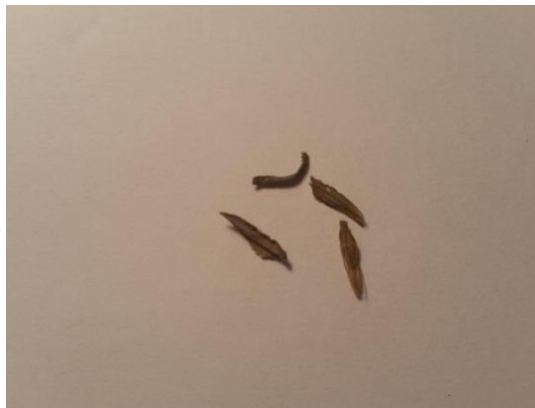
Slika 9. Sjeme cinije ( Zinnia elegans L.)

Cinija je jednogodišnja cvjetna vrsta iz porodice Asteraceae . Jedna je od najzahvalnijih ljetnih cvjetnica visine od 20 do 70 cm. Stabljika joj je uspravna, jednostavna ili razgranata, prekrivena dlačicama. Listovi su nasuprotni, ovalnog oblika, sroliki, dlakavi i hrapavi. Cvjetovi su smješteni na vrhu stabljike u različitim nijansama boja osim plave. Cvatnja traje od lipnja pa sve do listopada. Razmnožava se sjemenom koje je srolikog ili šiljastog oblika do 1 cm dužine, smeđe nijanse. Zahtjeva sunčano mjesto, zaštićeno od vjetra. Uspijeva na humusnom tlu, ali će uspijevati i na siromašnim tlima. Osnovna namjena cinija je sadnja na cvjetnu gredicu s ostalim ljetnicama, međutim zbog različitih veličina može se koristiti i u druge svrhe (Gospodarski list, 2013 ).