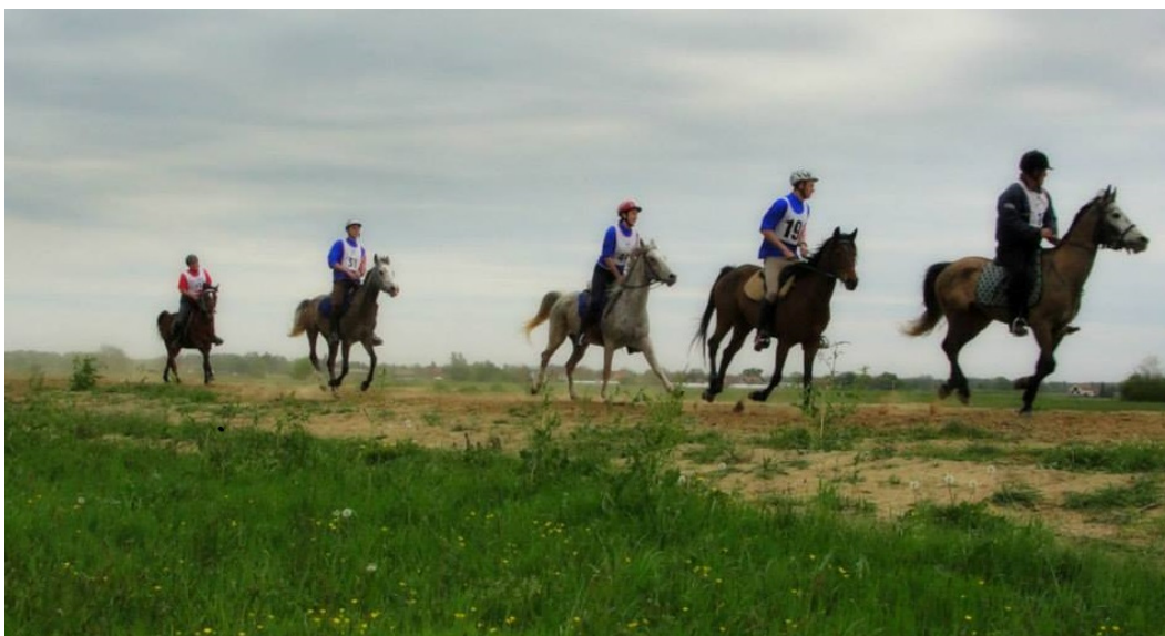
Slika 5. Utakmica u daljinskom jahanju - Croatia Cup Otrovanec

Svoje osobine iznimno dobro prenosi na svoje potomke pa u križanju sa drugim pasminama daje konje koji su se pokazali jednaki, a često i s boljim rezultatima u daljinskom jahanju. Dokaz tome je veliki postotak (90%) arapskih konja i konja s velikim postotkom njihove krvi u samom vrhu daljinskog jahanja.