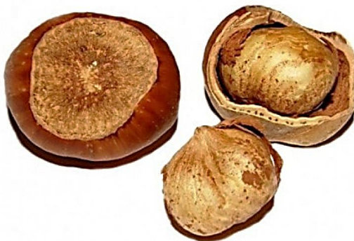
Slika 2. Rimski lješnjak