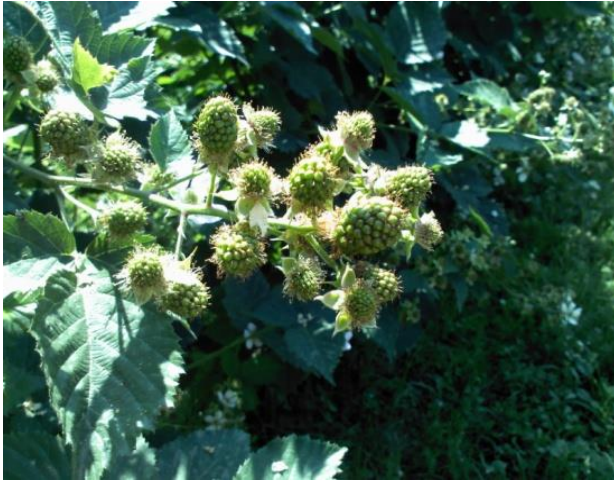
Slika 6. Plod kupine