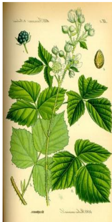
Slika 3. Morfologija

Cvatne grančice se razvijaju u pazuhu listova na dvogodišnjim mladicama. Cvijet kod kupine je hemafroditan (dvospolan) i srednje krupan, sa većim brojem tučkova i prašnika i dvojnim cvjetnim omotačem. Cvjetovi kupine su bijeli ili ružičasti, grupirani u grozdaste ili metličaste cvati. Cvijet je sastavljen od 5, ponekad od 3 ili 7 čašičnih listića, od 5 cvjetnih ovalnih listića i većeg broja prašnika i plodnica, koji se nalaze na zajedničkom cvjetištu (slika 3., 4. i 5.).