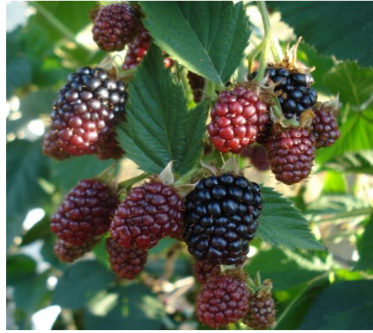
Slika 7. Zrioba kupine

Po zriobi kupina spada u sitno voće koje najkasnije dolazi u rodnost. Sazrijeva od polovice kolovoza, do prve dekade rujna. Kupina je voće koje ima mnogostruku upotrebu, a od sitnog voća najotpornija je na transport.