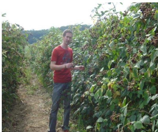
Slika 9. Ekološki kupinjak – Platužić