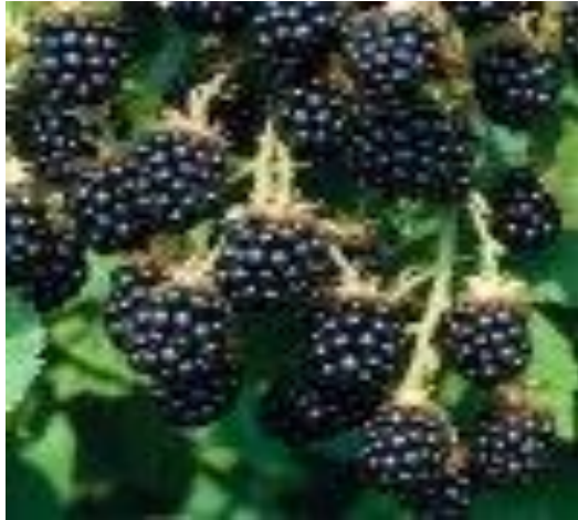
Slika 11. Thornfree