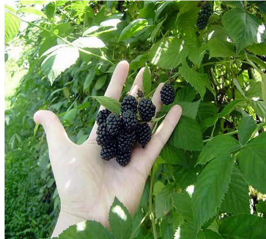
Slika 12. Boysen