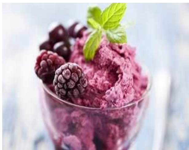
Slika 2. Sladoled od kupine