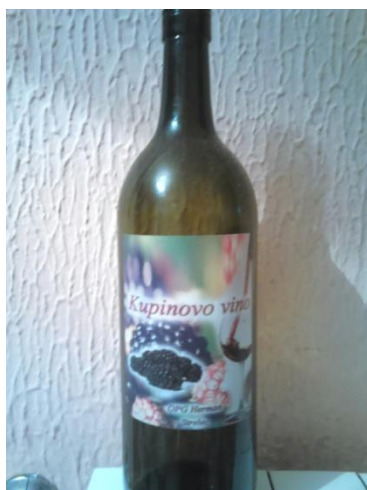
Slika 1. Kupinovo vina

Prema Koci i Karadenizu (2009.), koji su istraživali antioksidativnu aktivnost 7 divljih i 10 sorti kultiviranih kupina, bolji izvor prirodnih antioksidanasa je divlja kupina. Divlja kupina ima veću vrijednost antioksidativne aktivnosti, koja je i u velikoj je korelaciji sa ukupnim fenolima i antocijanima.