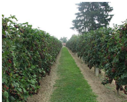
Slika 10. Integrirani kupinjak – Herman

Tijekom 2013. provedeno je jednogodišnje istraživanje na dva lokaliteta i na dvije sorte kupina uzgajane po principima integrirane i ekološke proizvodnje. U vegetacijskoj godine prikupljeni su svi potrebni podaci o primjenjivanim agrotehničkim mjerama u uzgoju kupina. Berba je obavljena jednokratno, a za potrebe pokusa uzeti su iz svakog nasada prosječni uzorci od cca 1 kg zrelih plodova u tri ponavljanja. Uzorci su dostavljeni na analizu u agrokemijski laboratorij Visokog gospodarskog učilišta u Križevcima.