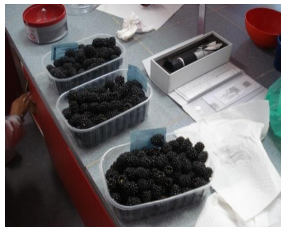
Slika 14. Uzorci kupina