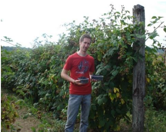
Slika 13. Berba – OPG Platužić