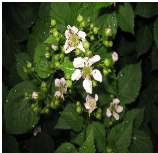
Slika 5. Cvatne grančice