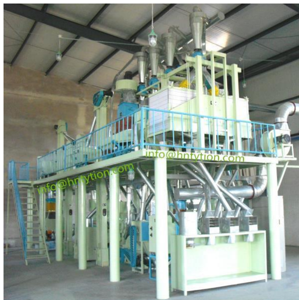
Slika 2. Mlin

Žitarica se ubacuju u mlin kroz ulazni lijevak. U lijevku se nalazi zaštitni poklopac koji štiti radnika, sprječava povrat žitarice i regulira doziranje žitarice u prostor rotora. Brzina vrtnje se povećava pomoću multiplikatora. Izlazno vratilo multiplikatora spojeno je spojkom s radnim vratilom mlina (Slika 2).