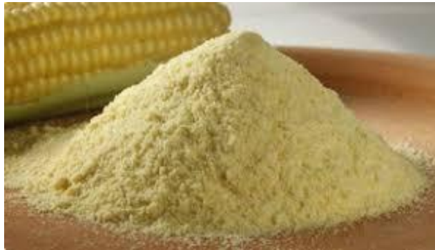
Slika 4. Kukuruzno brašno

Brašno je neizostavni sastojak u svakoj kuhinji bez obzira radite li kruh, bezglutenske slastice ili druge pekarske delicije. Proizvod je namijenjen tržištu je isključivo kukuruzno brašno namijenjeno za prodaju kupcu (Slika 4).