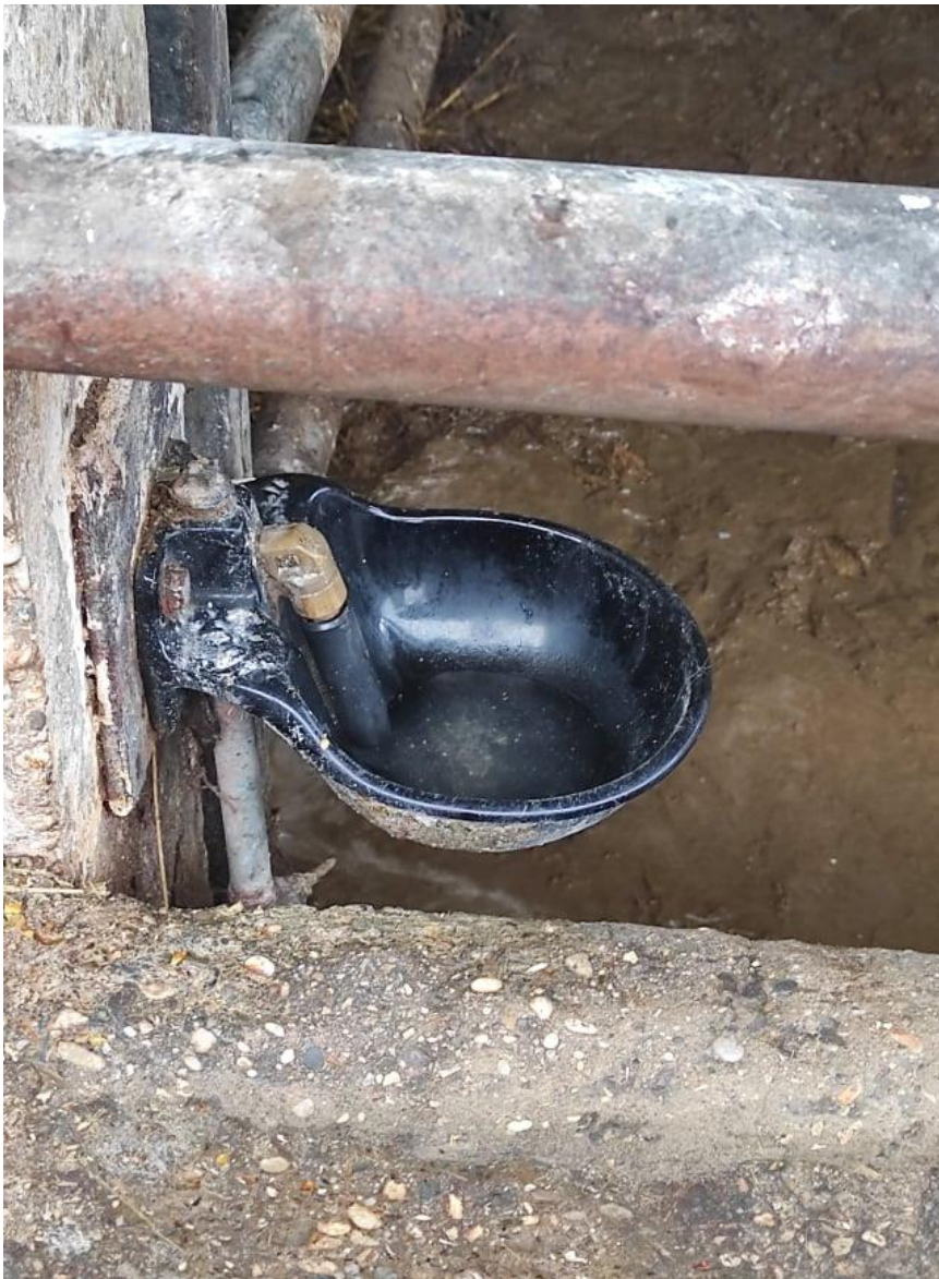
Slika 19. Termo pojilica

Pojilice za junad nalaze se u svim objektima gdje borave životinje. Na farmi tovne junadi Poljanski Lug koriste se individualne automatske termo pojilice. Pojilice su smještene na oba kraja boksa. Tovno june dnevno u prosjeku popije 40 – 60 litara vode zimi, a ljeti 50 – 80 litara vode. Pojilice se nekoliko puta tjedno moraju ručno očistiti zbog zoo-higijenskih razloga, odnosno radi nakupljanja stelje u otvorima za pojenje. Prednost ovakvih pojilica je što sprječava smrzavanje vode ukoliko temperatura zraka padne ispod nule.