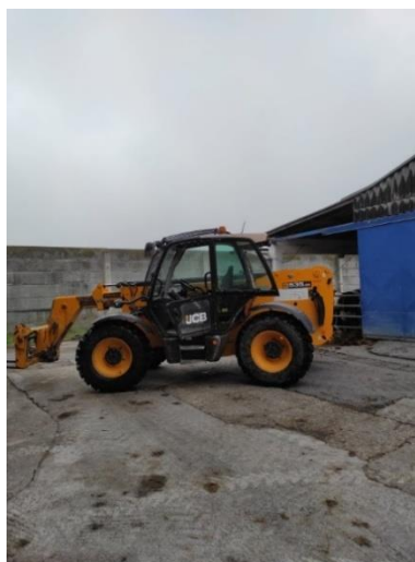
Slika 4. JCB 535-95 AGRI PLUS