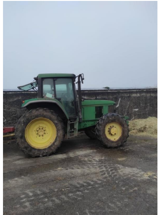
Slika 2. John Deere 6910