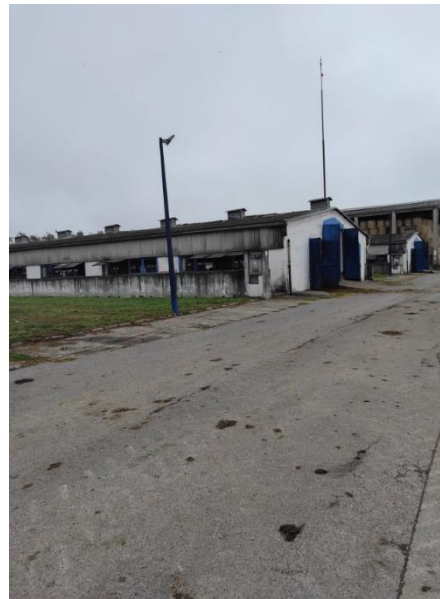
Slika 14. Zatvorena staja