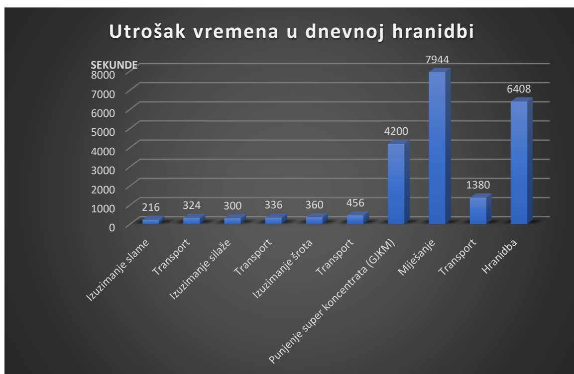
Grafikon 2. Utrošak vremena u procesu dnevne hranidbe