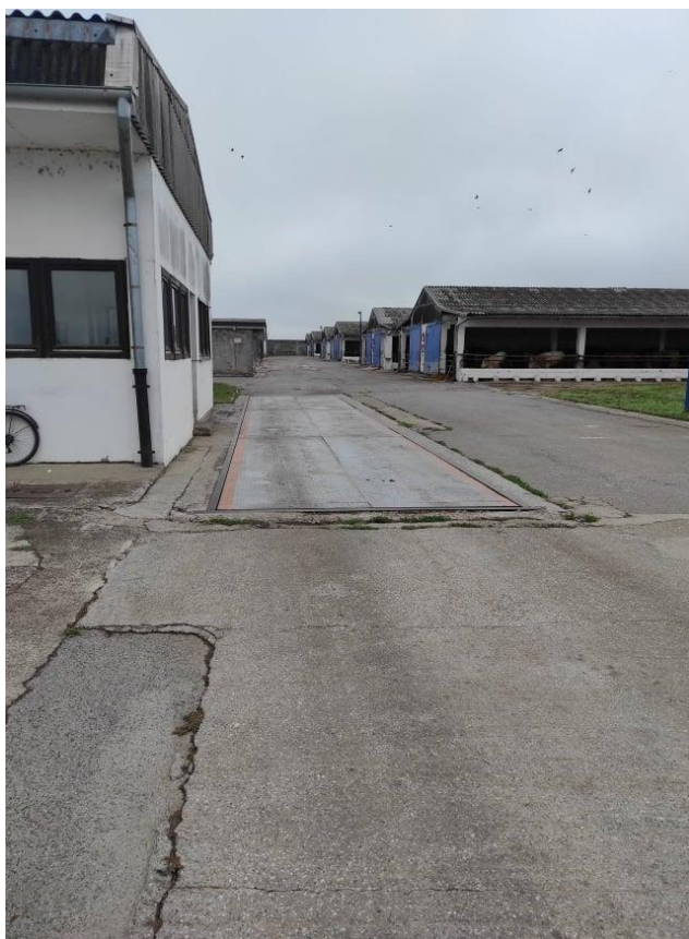
Slika 10. Vaga na farmi

Stočna vaga smještena je na ulazu farme. Koristi se kod vaganja junadi prije i nakon utovara te prije i nakon istovara junadi. Vaga je digitalna te olakšava rukovanje i ubrzava postupak vaganja junadi.