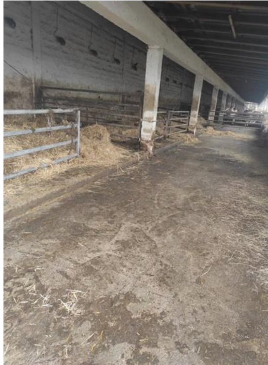
Slika 15. Puni pod