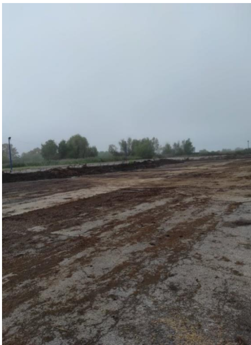
Slika 17. Velika deponija

Sa svake strane farme nalaze se deponije za stajnjak. Dimenzija veće deponije je 120 metara x 20 metara, a manja je dimenzija 65 metara x 10 metara. Depo služi za odlaganje krutog stajskog gnoja i on je nenatkriven.