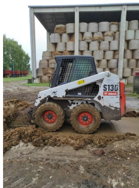
Slika 7. BOBCAT