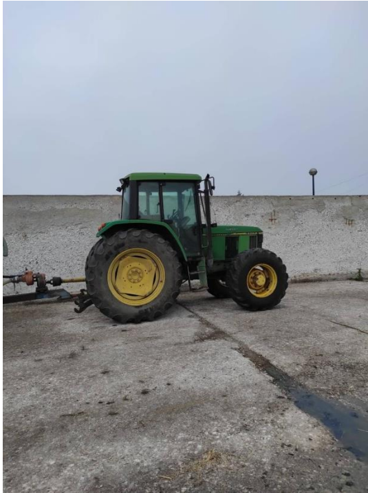
Slika 1. John Deere 6400