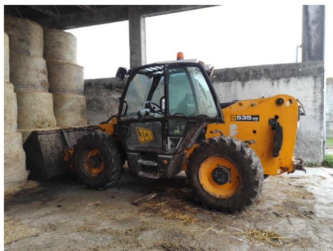
Slika 5. JCB 535-95 AGRI