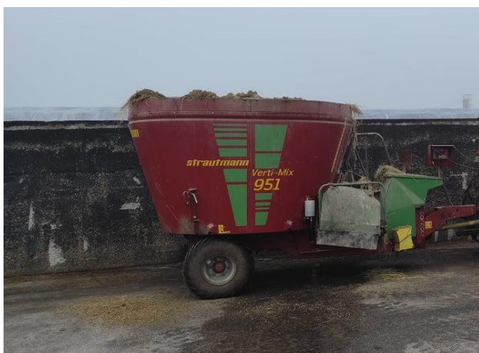
Slika 8. Strautmann Verti-Mix 951