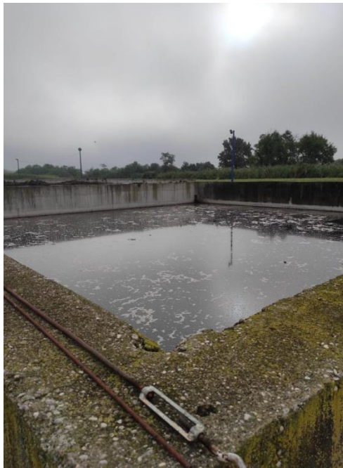
Slika 16. Laguna za tekući gnoj

Na farmi Poljanski Lug postoje dvije lagune za tekući gnoj. Dimenzija jedne lagune je 20 metara x 20 metara x 6 metara, dok je druga nešto manja s dimenzijama 15 metara x 10 metara x 6 metara. Zbog držanja na dubokoj stelji, na farmi nastaje kruti stajski gnoj, a tekući gnoj slijeva se u lagune iz deponija s krutim stajskim gnojem. Jedno uvjetno june (500 kg) na dnevnoj bazi proizvede oko 40-50 kilograma krutoga gnoja i mokraće. Jama, odnosno laguna za tekući gnoj je izgrađena od vodonepropusnog betona. Radi sprječavanja da se gnojnica u laguni na površini skruti i da bi se održala homogenost mase, koriste se mješalice za miješanje tekućeg gnoja.