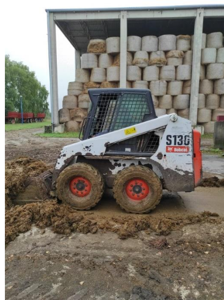
Slika 7. BOBCAT