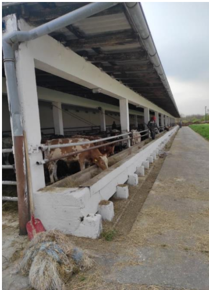
Slika 13. Poluotvorena staja