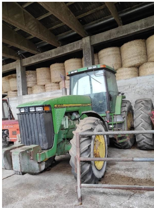
Slika 3. John Deere 8100