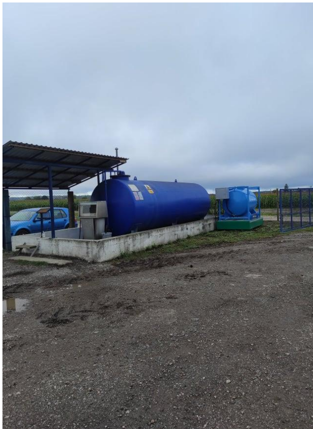
Slika 12. Spremnik za gorivo

Spremnik goriva na farmi Poljanski Lug nalazi se na drugom ulazu na farmu koji služi za ulazak i izlazak traktora PC ratarstva. Važnost postojanja spremnika za gorivo na farmi jest ta da se smanji utrošak goriva. Samim odlaskom radnih vozila s farme do najbliže benzinske pumpe dolazi do nepotrebnih troškova. Spremnik za gorivo zapremnine je 20 000 litara dizel goriva.