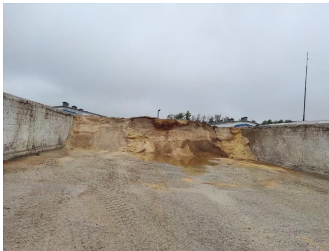
Slika 15. Silos na farmi Poljanski Lug

Šest trenč silosa dimenzije su 60 metara x 15 metara x 2,8 metara, dok su ostala dva natkrivena silosa dimenzija 60 metara x 10 metara x 2,8 metara. U četiri silosa pohranjuje se zelena silaža te u svaki stane 205 vagona ( 1 vagon = 10 000 kilograma) zelene silaže. Dva silosa služe za pohranu prekrupljenog kukuruza, te u svaki od dva silosa stane 250 vagona.