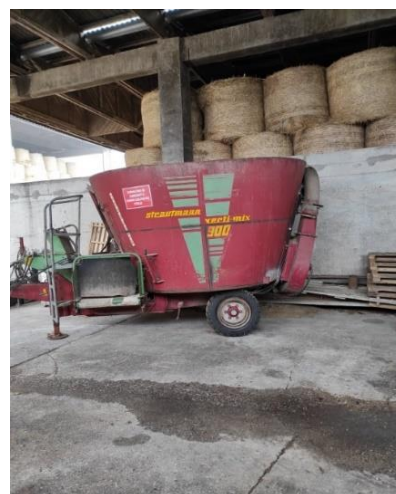
Slika 9. Strautmann Verti-Mix 900