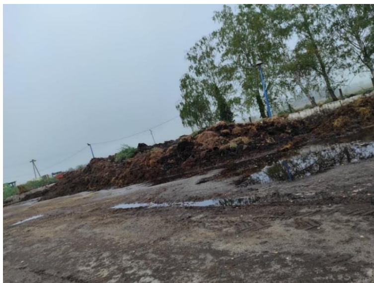
Slika 18. Mala deponija