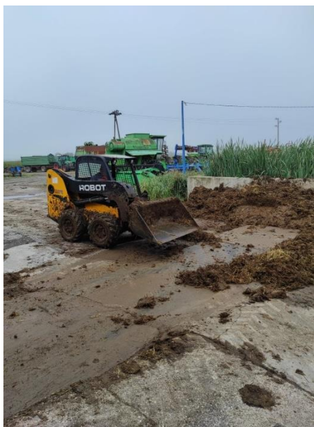
Slika 6. JCB 160 ROBOT