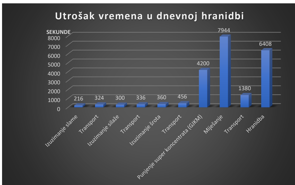
Grafikon 1. Utrošak vremena u jednom prohodu mikser prikolice

vremena postotno učešće je 0,99%, odnosno 216 sekundi. Miješanje obroka u jednom prohodu mikser prikolice postotno sudjeluje sa 36,23% i to vremenski iznosi 662 sekunde, dok u dnevnom utrošku vremena postotno učešće iznosi 36,23%, a to vremenski iznosi 7944 sekunde. Najčešća radna operacija je sam transport i izuzimanje krme za obrok. Prosjek jednog prohoda mikser prikolicom iznosi 1827 sekundi ili 30 minuta. Prosjek zbroja prohoda mikser prikolicom iznosi 21924 sekundi, odnosno 6 sati.