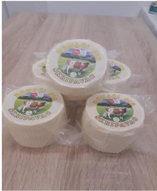
Slika 6. Škripavac