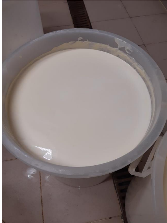
Slika 3. Odvojeno kiselo vrhnje