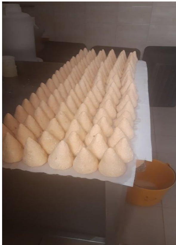
Slika 4. Proizvodnja Prgica

Prgice se proizvode od svježeg sira (tehnologija je opisana na prethodnoj stranici). Svježi sir se dobro ocijedi i izmiješa, dodaje mu se sol i crvena mljevena ljuta paprika (a može po volji i češnjak) zbog postizanja karakteristika sira (bolje postojanosti i boljeg okusa sira). Nakon što se dobro izmiješa, rukama se formiraju stošci koji se stavljaju na dimljenje u sušaru. Dimljenje traje oko 1 h i 30 minuta. Prgice se do prodaje čuvaju u hladnjaku na +4 do +8°C , a prodaju se kao nezapakirani proizvod (u vrećicama za zamrzavanje).