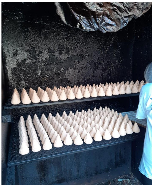
Slika 5. Dimljenje prgica