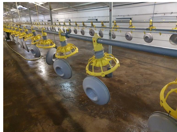
Slika 4. Hranilice MiniMax