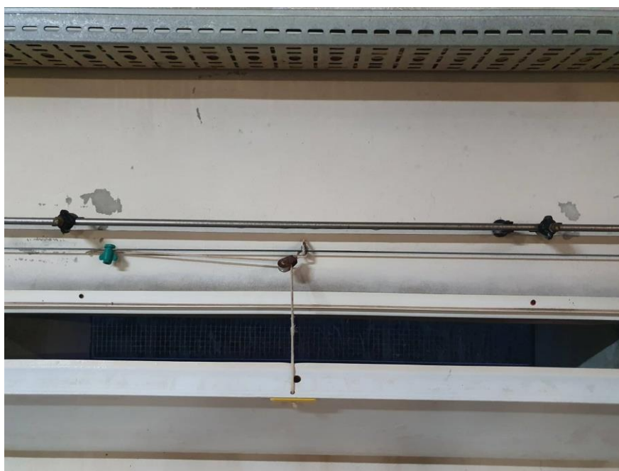
Slika 1. Rashladni sustav na farmi