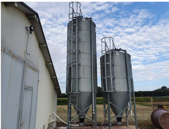
Slika 3. Silosi za hranu

sustav preko remenice ili direktnim pogonom. Sustav hranjenja s hranilicama MiniMax sastoji se od usipnika za hranu, cijevi sa spiralom za prijenos hrane, pogonskog elektromotora sa senzorom, ovjesnog sustava s vitlom, žice protiv sjedanja peradi na liniju hranjenja i hranilica MiniMax. Hranilice MiniMax slobodno se okreću oko cijevi. Dno hranilice izgrađeno u obliku slova "V" ulazi duboko u stelju, što osigurava lagani pristup do hrane jednodnevnim pilićima. Glatki rub hranilice napravljen je na način da onemogućuje oštećenja prsa tijekom tova. Montaža hranilice vrši se bez vijaka, što omogućava laganu zamjenu hranilice i olakšano pranje.