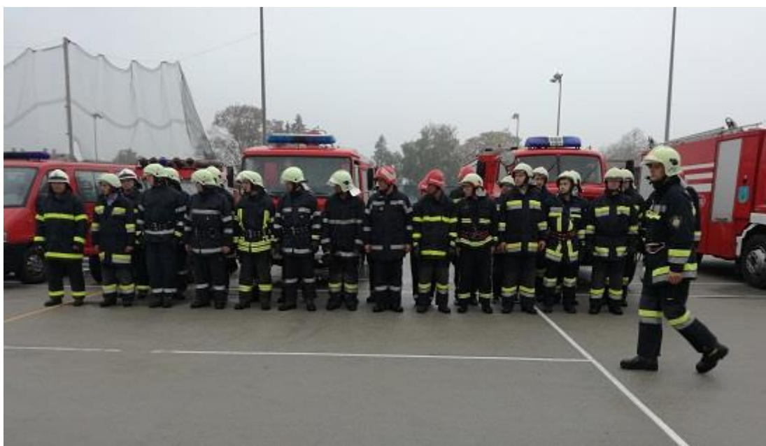
Slika 9. DVD Drnje