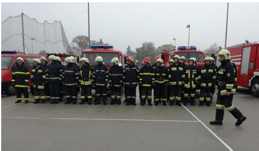
Slika 9. DVD Drnje