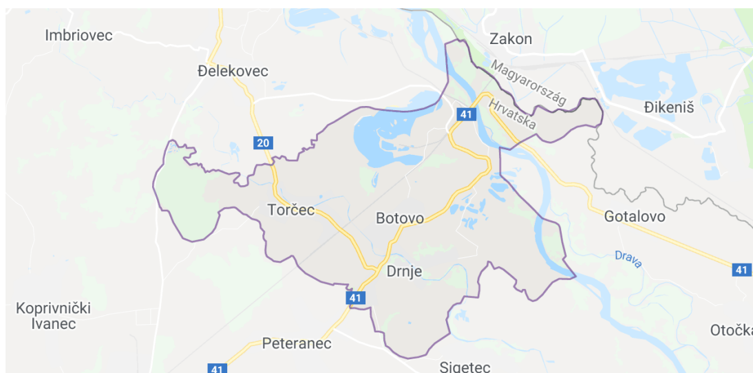
Slika 2. Karta općine Drnje

mlinovima, dok su kovači potkivali konje ili popravljali poljoprivredna pomagala. Općina Drnje osnovana je 1898. godine izdvajanjem iz općine Peteranec, a kasnije su joj pridodana mjesta Botovo i Torčec. Godine 1963. općina Drnje pridodana je općini Koprivnica, a ponovno proglašenje samostalne općine dogodilo se 1993. godine. Blizina grada Koprivnice, procesi deagrarizacije i industrijalizacije dovode do promjene strukture stanovništva te je iz godine u godinu sve veći broj zaposlenika u sekundarnom sektoru. (Petrić, 2000.).