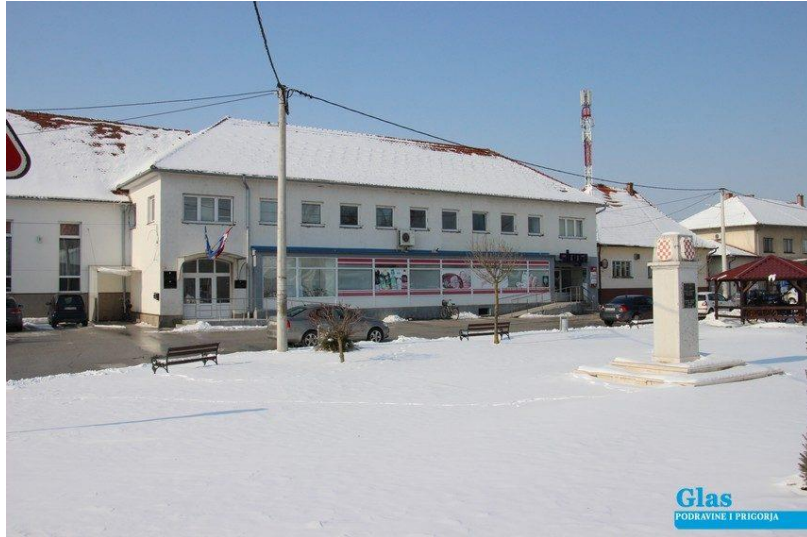
Slika 7. Općinska zgrada