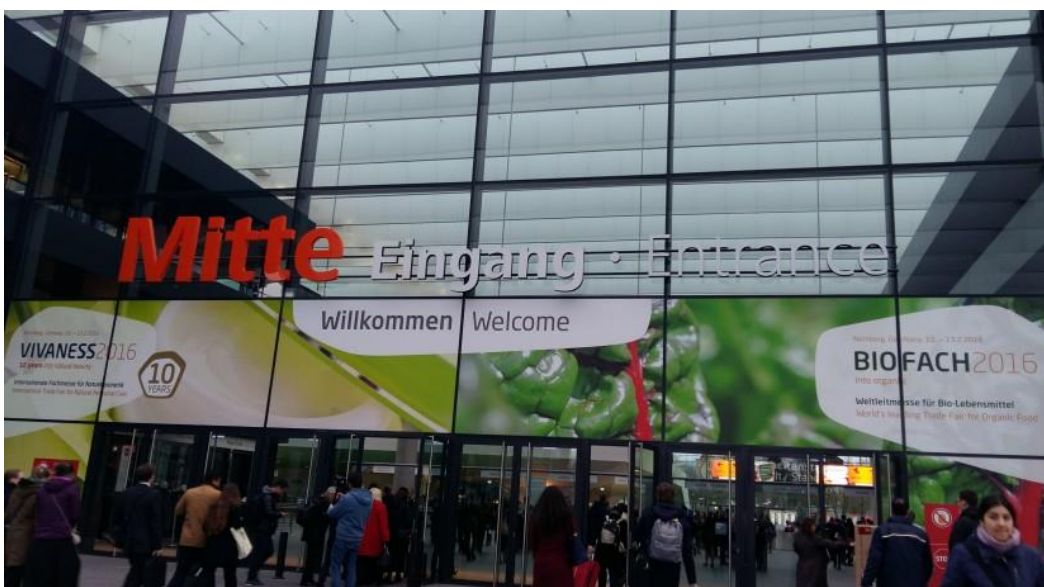
Slika 3. Međunarodni sajam BIOFACH u Njemačkoj

Međunarodni sajam BIOFACH (slika 3) jedan je od najvećih eko sajmova u svijetu, a odražava se od 1990.g. u izložbenom centru u Nürnbergu, Njemačka. Sajam BIOFACH održava se pod pokroviteljstvom svjetske organizacije IFOAM – Međunarodna organizacija za ekološku poljoprivredu. Republika Hrvatska na sajmu je prvi puta sudjelovala 2009.g. pod pokroviteljstvom Ministarstva poljoprivrede. Neki od hrvatskih eko proizvođača koji se predstavljaju na sajmu su; Art of Raw, Bobica, Ecogos, Exploria, Jan Spider i mnogi drugi.