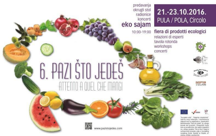
Slika 2. Prikaz plakata manifestacije „Pazi što jedeš“

„Pazi što jedeš“ manifestacija je koja se održava u Puli od 2011. godine (slika 2). Manifestacija je edukativnog i sajmenog karaktera na kojoj izlažu eko proizvođači iz cijele Hrvatske. 2017.g. tema sajma bila je „Znanje i okus“-prenošenje znanja i očuvanje okusa, a naglasak je bio na tradicijskim receptima karakterističnim za Istru. Organizator ovog sajma je Etnografski muzej Istre.