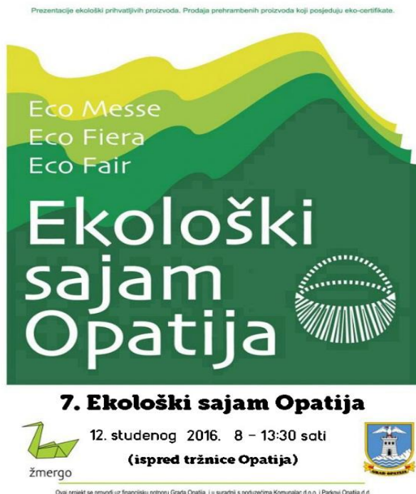
Slika 1. Prikaz plakata Ekološkog sajma u Opatiji