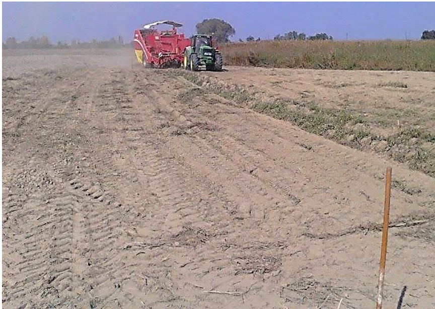
Slika 6. Postupak mjerenja brzine rada kombajna