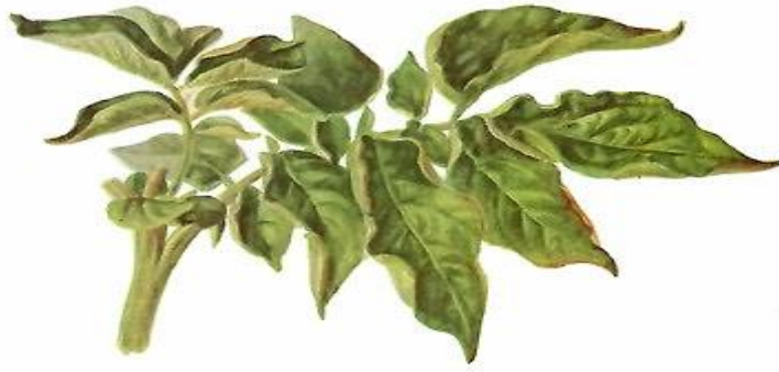
Slika 3. List krumpira