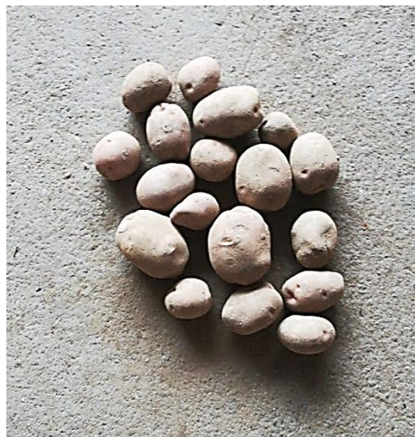
Slika 14. Ostatak gomolja nakon prolaska kombajna brzinom B