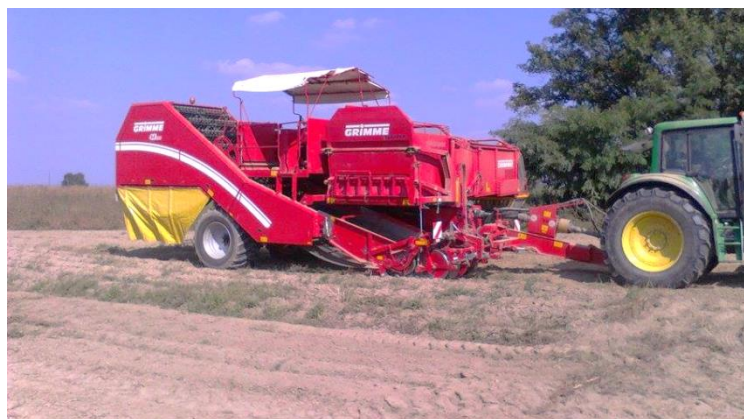
Slika 8. Vađenje krumpira iz zemlje

U izradi ovoga završnog rada praćen je rad dvorednog vučenog kombajna GRIMME SE 260 koji je spojen preko priključnog vratila s vlastitim spremnikom za prihvat gomolja. U jednom pohodu kombajn izvadi gomolj iz zemlje (slika 8., slika 9.), potresa zemlju (slika 10.) i gomolje sprema u spremnik (slika 11.).