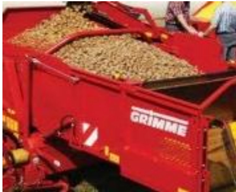
Slika 11. Spremanje gomolja u spremnik