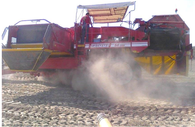
Slika 9. Vađenje krumpira iz zemlje