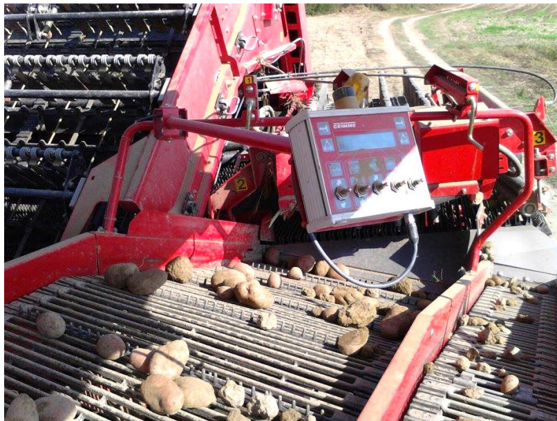
Slika 10. Potresanje zemlje