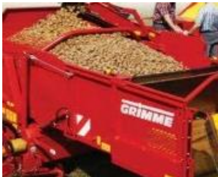
Slika 11. Spremanje gomolja u spremnik