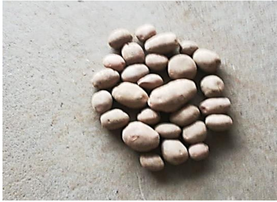
Slika 13. Ostatak gomolja nakon prolaska kombajna brzinom