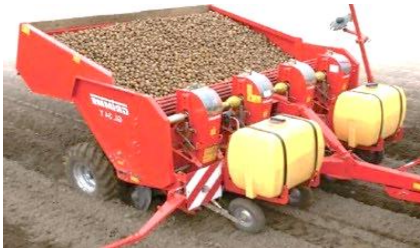
Slika 7. Postupak sadnje

Svaka od tih skupina ima više izvedba i tipova sadilica. Bez obzira na konstrukcijske osobine sadilice trebaju zadovoljiti određene kriterije. Sadilice ne smiju oštetiti gomolj tijekom sadnje, moraju održavati dubinu sadnje, održavati zadani razmak sadnje u redu, lako podešavanje razmaka između redova, ne smije imati više od 3% praznog mjesta i da dobro formiraju pravilan greben uzduž cijelog reda. Na gospodarstvu gdje je istraživanje provedeno korištena je automatska četveroredna sadilica proizvođača Grimme.