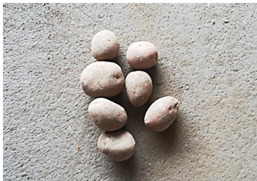
Slika 15. Ostatak gomolja nakon prolaska kombajna brzinom C