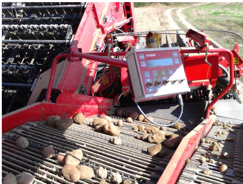
Slika 10. Potresanje zemlje