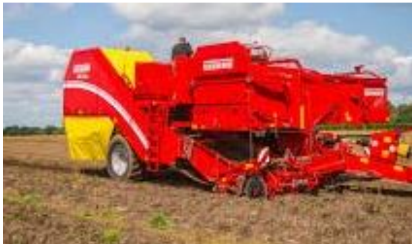
Slika 12. Prikaz kombajna tvrtke „Grimme“