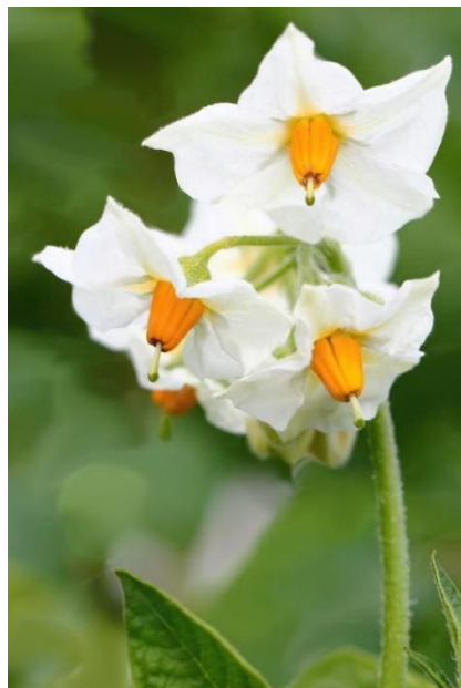
Slika 4. Cvijet krumpira

Cvjetovi se razvijaju na vrhu stabljike, na razgranatom dršku. Cvijet ima 5 sraslih lapova, 5 latica koje su srasle, a vrhovi su im slobodni, 5 međusobno sraslih prašnika i jedan tučak. Krumpir je samooplodan, ali može biti i stranooplodan (Buturac, 2002.).