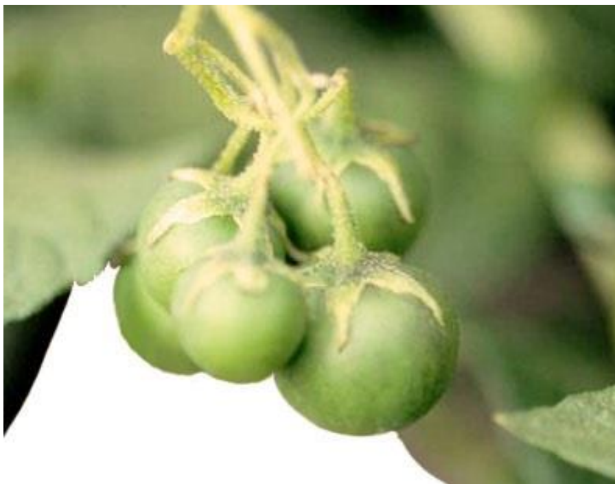
Slika 5. Plod krumpira

Plod je bobica, okruglastog ili ovalnog oblika (slika 5). Zelene je boje, sadrži puno vode i veliki postotak solanina. Sjemenke se nalaze u bobici, sitne su i spljoštene, žutosmeđe boje. Masa 1000 sjemenki je oko 0,5 grama, a hektolitarska težina oko 60 kg. Duljina vegetacije je vrlo različita, od 2,5 do 6 mjeseci (Buturac, 2002.).