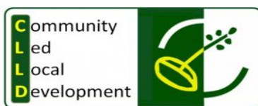
Slika 2. Logo CLLD-a

CLLD 4 (slika 2) je mehanizam za uključivanje predstavnika javnog, gospodarskog i civilnog sektora na lokalnoj razini u izradu i provedbu integrirane lokalne strategije koja pomaže njihovom području u održivom razvoju. CLLD se provodi putem integriranih i multisektorskih strategija lokalnog razvoja dizajniranih na način da uvažavaju lokalne potrebe i potencijale, uključuje inovativne razvojne mogućnosti u lokalnom kontekstu, umrežavanje i suradnju. Cilj CLLD-a je LEADER pristup učiniti učinkovitijim za potporu inovacijama i lokalnom upravljanju.